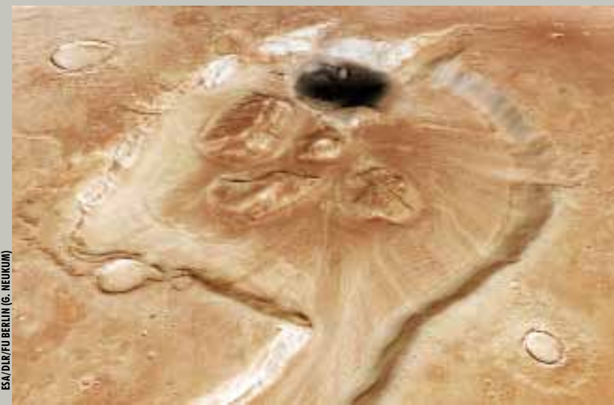
En la superficie de Marte hay cañones y morfologías fluviales que indican la posible presencia de agua en el pasado

El detector MicroARES hará las primeras medidas de los campos eléctricos de la superficie del planeta. Se supone que estos campos se generan cuando los granos se frotan unos con otros en la atmósfera marciana, que está llena de polvo. Aterrizar en el