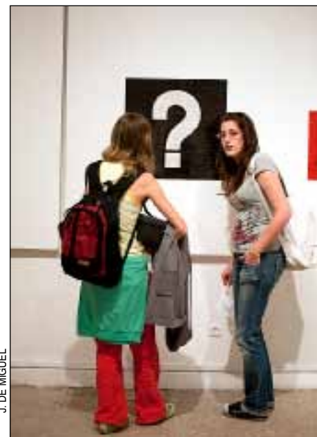
En estas páginas algunas imágenes de la muestra Expresáte que busca concienciar sobre la realidad y los riesgos del SIDA, treinta años después de su aparición. Gran parte de las obras son fotografías, pero también hay alguna escultura denuncia, pinturas y dibujos.

Los trabajos han sido realizados por estudiantes de Bellas Artes del campus de Moncloa y del CES Felipe II de Aranjuez