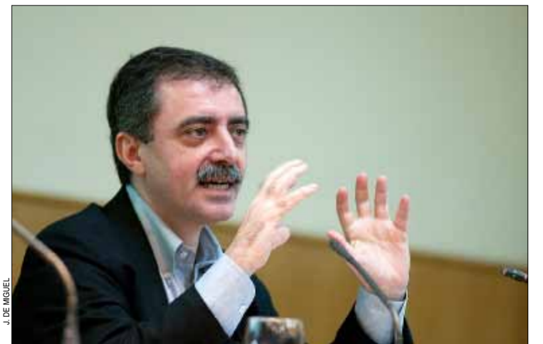
Manuel Borja-Villel, director del Museo Nacional Centro de Arte Reina Sofía, durante su conferencia

De una manera práctica, la visión de Borja-Villel se ha reflejado en una reordenación de la colección permanente del Reina Sofía, y también en la organización de exposiciones de autores poco conocidos. Según el director, esta política ha conseguido llevar a mucha más gente al museo y que son además más fieles.