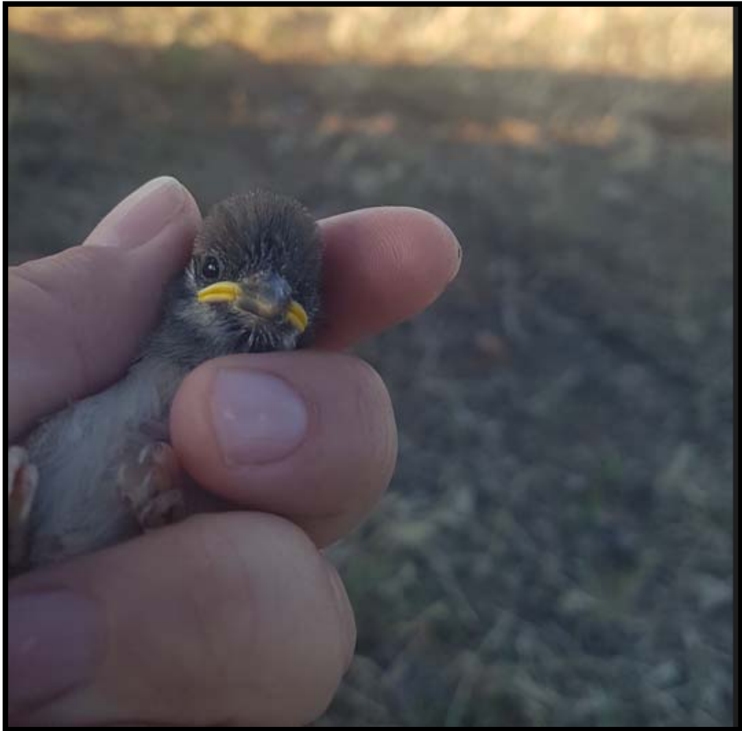
Tabla 8. Fecha media de inicio de la reproducción: (INICIO), fecha media de eclosión (ECLOSIÓN) de los huevos y vuelo de los pollos en la temporada de reproducción de 2022 en la Primera Puesta: (P1), en la Segunda Puesta: (P2) y en la Tercera Puesta (P3).