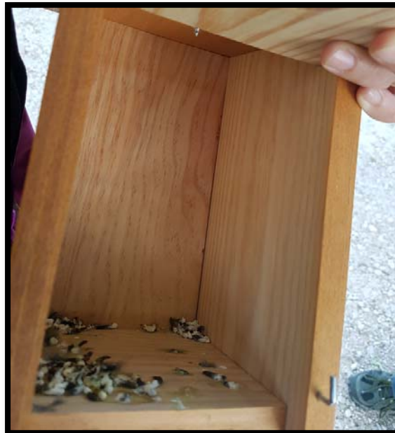
Fotografía 7. Dormidero de invierno en el Campus de Somosaguas en febrero de 2022.