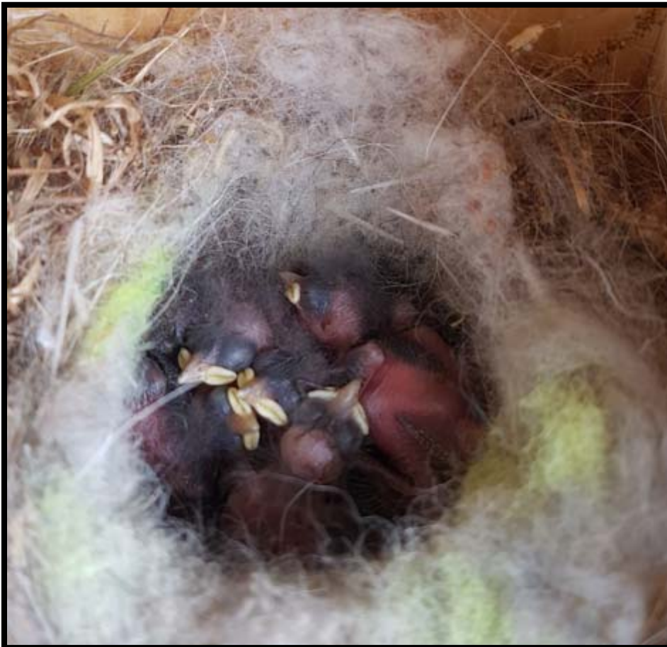
Fotografía 9. Nido con pollos de Carbonero garrapinos