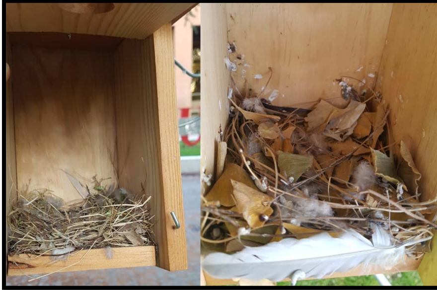
Fotografía 10. Caja Nido con nido poco construido NPC, con más aportes de material.

2.- NPC. NIDO POCO CONSTRUIDO (Fotografía 10). Cuando los aportes son lo suficiente para ya encontrar forma de nido. A partir de ese momento, el nido puede evolucionar a estar totalmente construido en menos de 2 días.