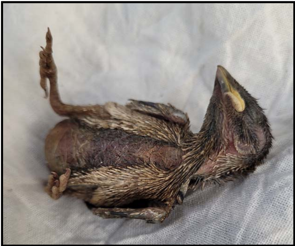
Fotografía 11. Pollo muerto en nido.

En la primera puesta han muerto pollos por inanición (no polladas completas) en 13 cajas nido, en la segunda en 15 cajas y en la tercera en 18 cajas. La tercera puesta suele ser la menos productiva, pero este 2022 ha sido catastrófica, han muerto los pollos de 21 de las 23 cajas que iniciaron esa 3ª puesta.