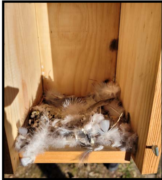
Fotografía 6. Nido de invierno en el Campus de Somosaguas en febrero de 2022.

Al limpiar las cajas, también se anotó la presencia de “ nidos de invierno ”, que son cajas con muchas plumas en el interior, aportados por las aves en invierno para pasar los días más fríos (Fotografía 6). También se pueden encontrar dormideros de invierno, que son cajas vacías en las que se acumulan un gran número de individuos y dejan la caja con muchas heces (Fotografía 7).