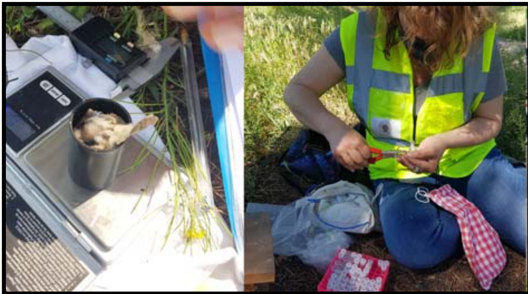
Fotografía 16. Anillamiento y toma de muestras biológicas.