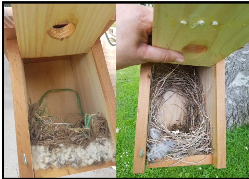
Fotografía 11. Caja Nido con nido medio construido NMC.

3.- NMC. NIDO MEDIO CONSTRUIDO (Fotografía 11). Son nidos avanzados en su construcción, pero aún no terminados. Hay individuos jóvenes que pueden iniciar la puesta con este tipo de nido, por ello, hay que tenerlo muy en cuenta a la hora de planificar las revisiones.