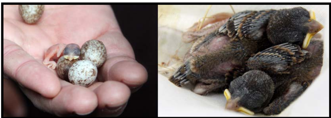
Fotografía 14. Pollos y huevos de Gorrión molinero en el Campus de Somosaguas en 2022.