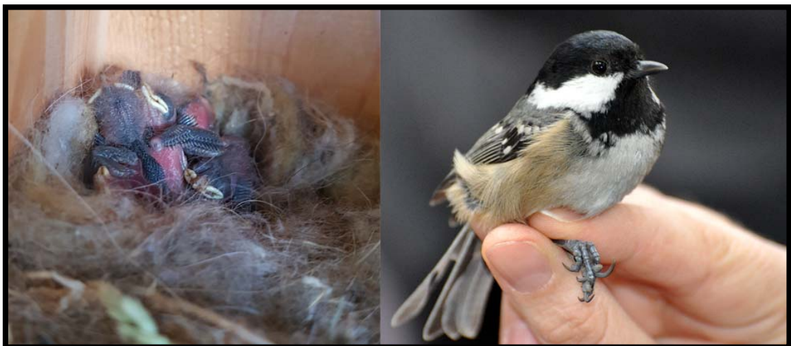
Fotografía 4. Caja nido con pollos y adulto en mano de Carbonero garrapinos ( Periparus ater ).

Ave de pequeño tamaño, pesa unos 9 gr. de media. No hay dimorfismo sexual y en invierno realizan movimientos desde la sierra, asociados a la fuga de tempero, sobre todo en la ciudad de Madrid. Suelen ser muy filopátricos. Realizan una única puesta en mayo con una media de 7 huevos y tras 14 días de incubación, los huevos eclosionan y los pollos se desarrollan en el nido una media de 12 días, momento en el que abandonan nido. Los pollos se independizan a los pocos días de dejar el nido, pero se suelen mantener junto sus hermanos durante el otoño. La capacidad reproductora comienza en la siguiente primavera y pueden vivir un máximo de 8 años.