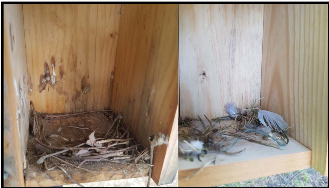
Fotografía 9. Caja Nido con APORTES, con aportes de materia vegetal.

1.- APORTES (Fotografía 9). Si en la caja nido se encontraban Aportes, como trozos de vegetación, pelusas algodonosas, acículas de pino, plumas o plumón, pelos de perro, humano o conejo, etc. Eso significa que han entrado al nido, han considerado la posibilidad de construir un nido en el interior de la caja, puesto que han realizado aportes, pero luego no han continuado por diversas razones. Por ejemplo, ausencia o muerte de pareja o han encontrado una caja posteriormente que, por su nidotópica, les ha gustado más, o han visto que, por su cercanía a carreteras o bancos utilizados a menudo por humanos, había muchas molestias, etc. También es posible que la densidad de reproductores sea baja y han probado varias cajas antes de decidirse por una en concreto.