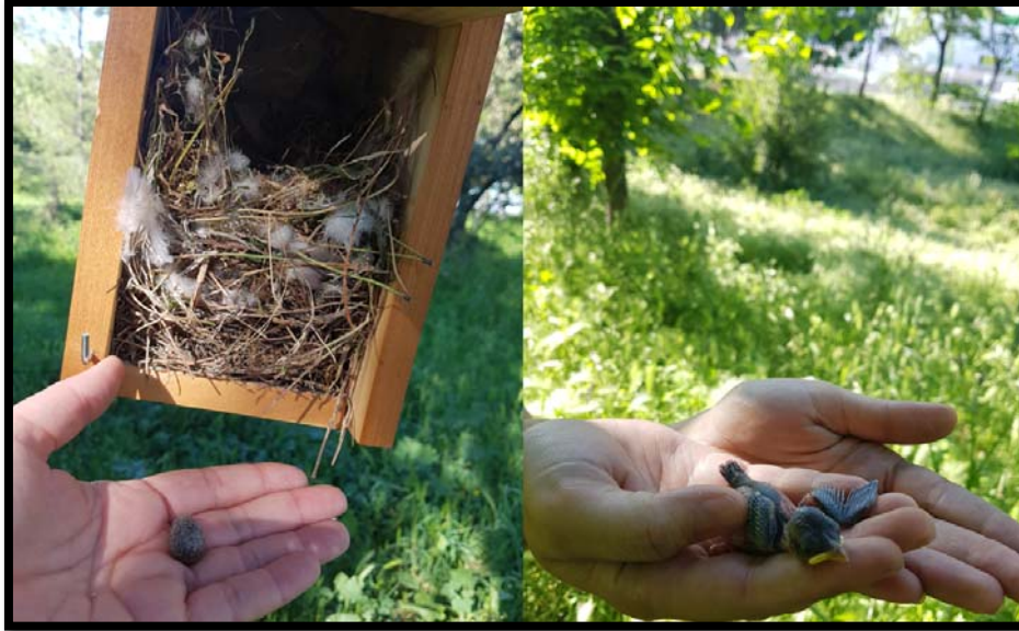
Fotografía 18. a) Nido Totalmente construido y huevo b) pollo de 6 días en 2022.