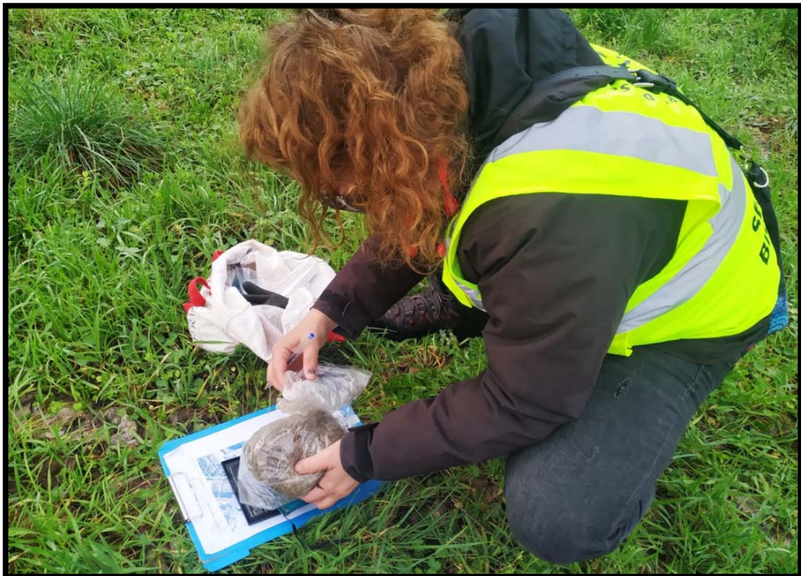
Fotografía 5. Limpieza y pesado del contenido de nidos de 2021 en el Campus de Somosaguas.

Por lo general, los nidos más pesados son aquellos que han tenido un mayor éxito reproductor, es una medida indirecta de calidad parental. Las parejas de mejor calidad realizan más aportes al nido que permiten el aislamiento del mismo e incluyen material (como algunas especies de herbáceas) que evitan la presencia de parásitos externos, como el ácaro rojo ( Dermanyssus sp. ).