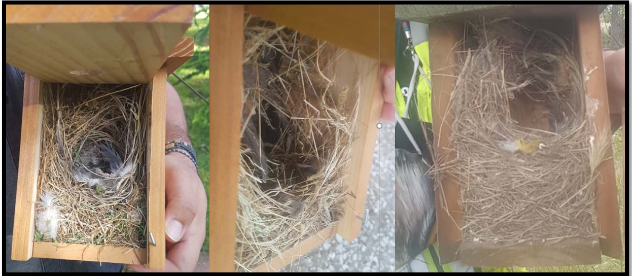
Fotografía 12. Cajas Nidos con nido totalmente construido NTC de Gorrión molinero.

4.- NTC. NIDO TOTALMENTE CONSTRUIDO (Fotografías 12 y 13). Nidos en los que se ha finalizado su construcción, con un cuenco sin forrar, típico de aves más jóvenes, o forrado con plumas de otras especies o pelos de conejo, perro o humano.