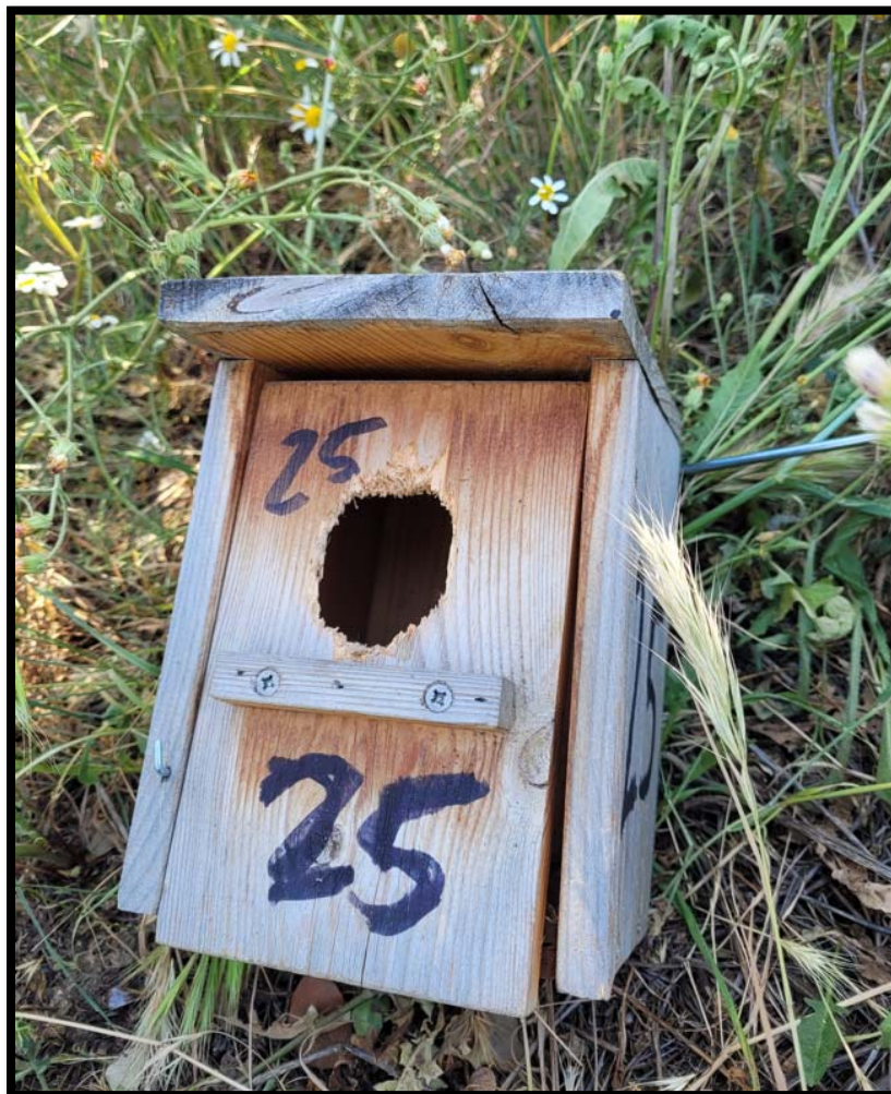
Fotografía 10. Caja nido depredada por pícido (pájaro carpintero).

En la primera puesta ha desaparecido en 3 cajas la pollada entera, posiblemente por depredación, en la segunda ninguno y en la tercera han desaparecido de 5 cajas, un número muy alto debido quizá a las olas de calor que se sucedieron en esos días de finales de junio o principios de julio y que pudieron llevar a una falta gran falta de alimento.