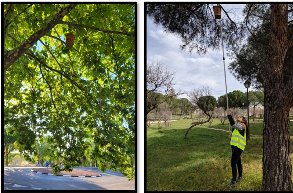
Fotografía 1. Caja nido y Técnico bajando una caja de Somosaguas para su seguimiento científico.

En este informe se muestran los resultados del seguimiento de la reproducción de la temporada de cría de 2022. Como cada año, las cajas nido se controlaron para determinar que especies las ocupaban, porcentaje de ocupación por aves, inicio y éxito en la reproducción, fechas de puesta de huevos, productividad, tamaño de puesta, fechas de eclosión, número de pollos nacidos y volados y su condición física, tasa de reposición de la población, incremento de abundancias, número de parejas reproductoras, etc. Además, se realizó el Anillamiento Científico de pollos nacidos en las cajas nido, puesto que proporciona información muy precisa no solo sobre el ave en concreto que se está anillando, sino sobre parámetros de la reproducción que pueden influir sobre su supervivencia futura (número de hermanos, fecha de nacimiento, etc.). Se puede precisar el lugar exacto de nacimiento, lo cual es muy útil, no solo para especies migratorias sino para especies sedentarias que presentan movimientos dispersivos no tan acusados. En el Campus de Somosaguas existe una Estación de Anillamiento de Aves de Esfuerzo Constante y es común recapturar como adultos, individuos ya anillados como pollos en cajas nido.