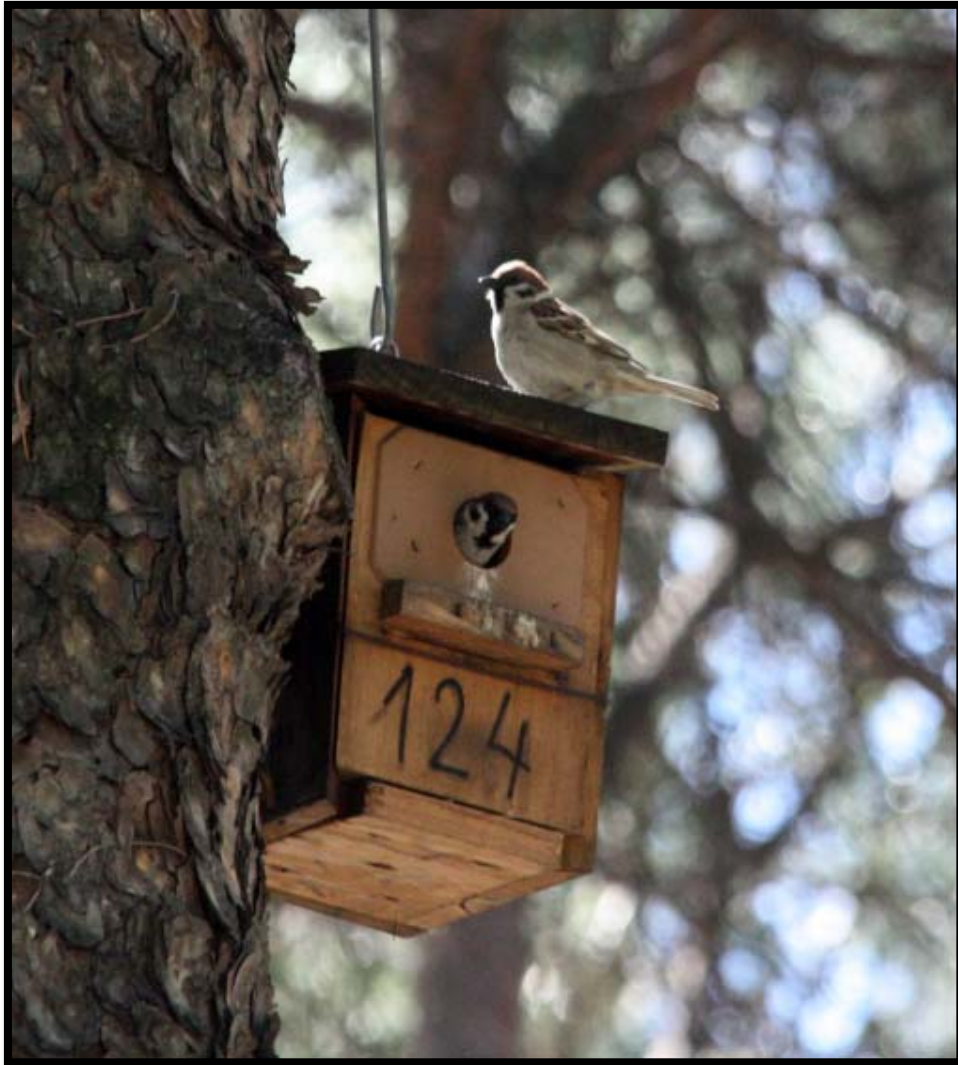
Fotografía 3. Caja nido con la pareja reproductora de Gorrión molinero Passer montanus

nido, aunque esos últimos aspectos son objetivo de estudio en la actualidad al observar discrepancias con estos datos en la ciudad de Madrid.