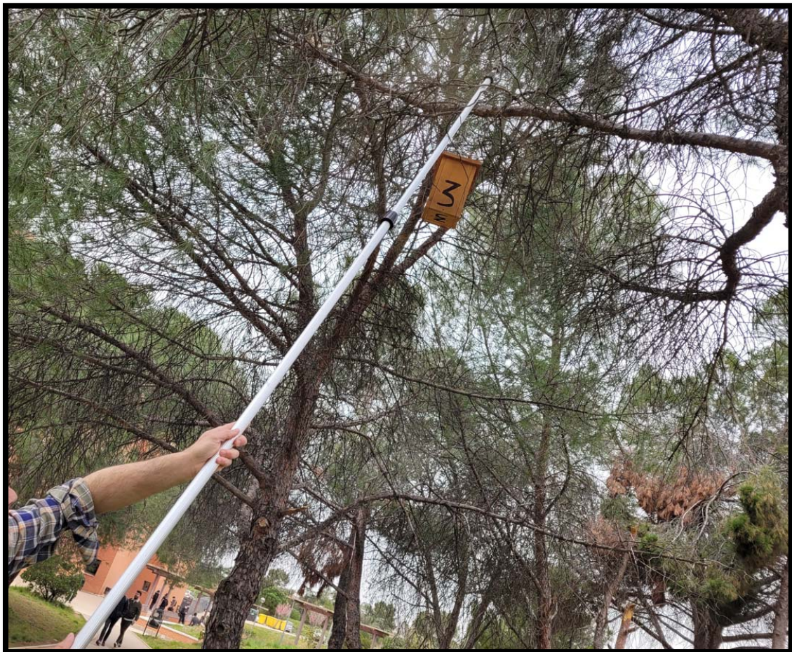
Fotografía 8. Revisión de caja nido en la Universidad Complutense de Madrid en 2022.

Se han visitado las cajas alrededor de 17 veces cada una, desde febrero hasta agosto de 2022 (Tabla 1). La revisión científica semanal de las cajas nido abarcó desde el 19 de abril hasta el 1 de agosto de 2022, momento en que se dio por finalizada la temporada de cría. Todas las cajas en las que no se ha detectado indicios de nidificación han recibido también visita de inspección. Se ha controlado los indicios mediante el examen de cada caja, en el que se pueden encontrar restos y evidencias en forma de deyecciones, pequeños aportes para el nido etc. (ver archivo Datos SMS 2022. xml, Excel Anexo).