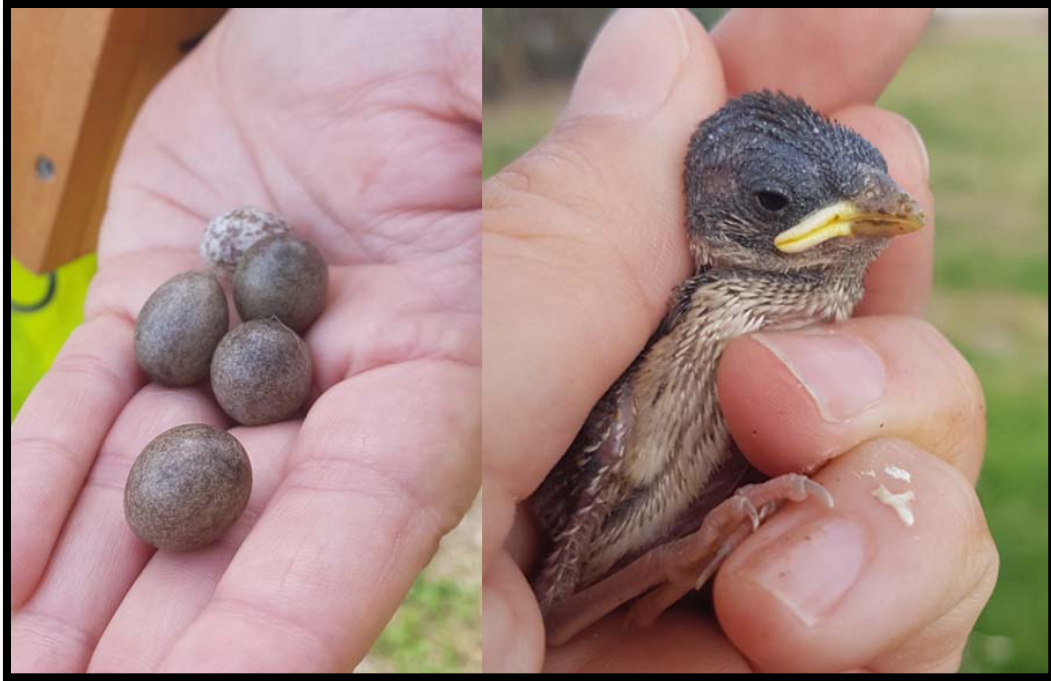
Fotografía 15. a) Huevos de gorrión molinero y pollo recién eclosionado. b) Pollo de 8 días listos para el anillamiento. Volarán con 14 días.