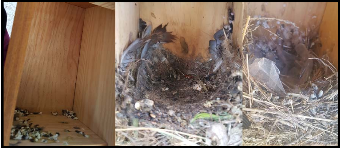
Fotografía 14. Cajas Nido que actúan como dormitorio de Gorrión molinero.