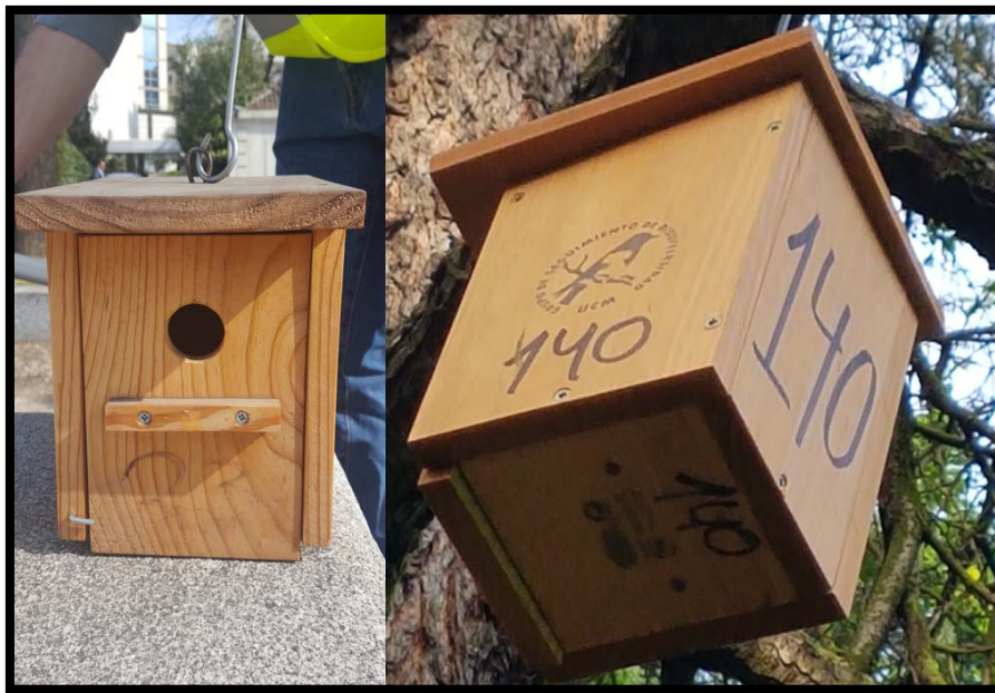
Fotografía 2. Caja nido con las especificaciones técnicas recomendadas.

En el mes de febrero, se limpiaron todas las cajas, se pesaron y se guardaron los nidos para estudiar la relación entre el peso del material del nido y los parámetros de reproducción como medida indirecta de la calidad de los padres.