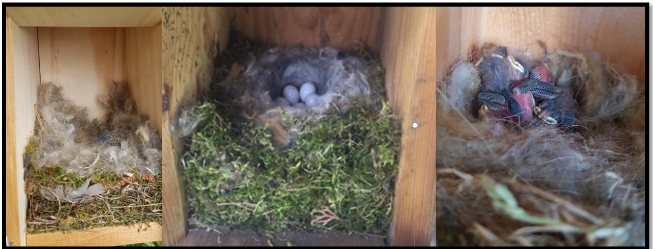
Fotografía 13. Cajas Nidos con nido totalmente construido NTC de párido (Carbonero garrapinos).

En la Tabla 3 se muestra el número de cajas ocupadas (Aportes, NPC, NMC y NTC) en cada localidad y su porcentaje de ocupación respecto al total, las cajas que quedaron vacías y las cajas que fueron robadas a lo largo de la temporada de reproducción de 2022 (estas cajas se contabilizan también en el % de ocupación porque primero fueron ocupadas y luego robadas).