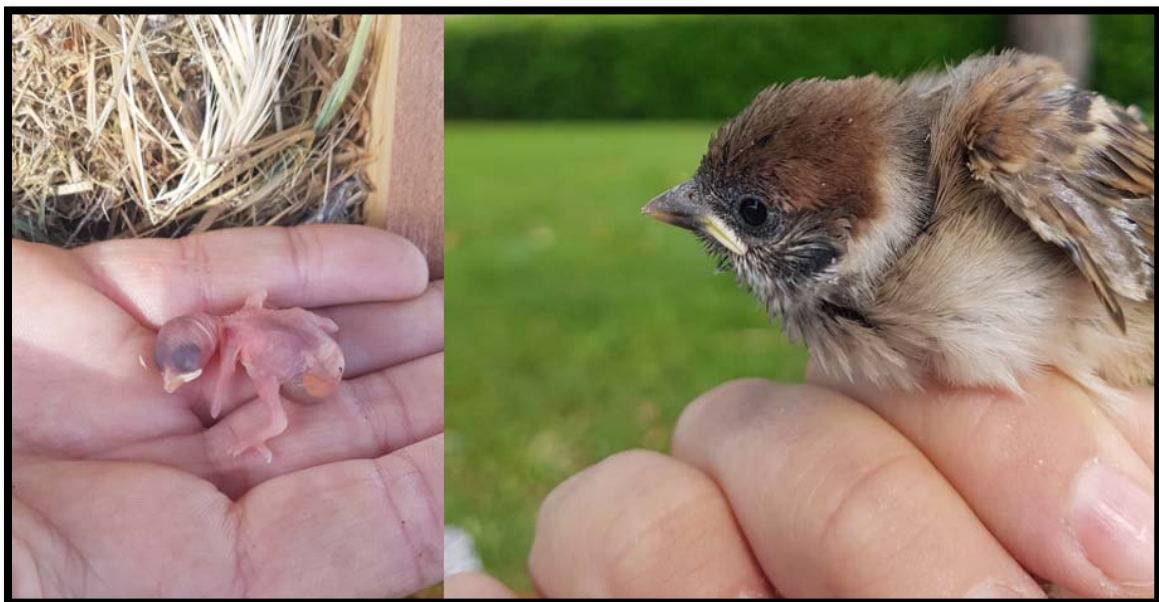
Fotografía 17. a) Pollo de Gorrión molinero recién eclosionado b) Pollo de 10 días.

Las terceras puestas tienen un periodo de puesta más amplio, entre mediados de junio y principios de julio. La fecha media de la segunda puesta es el 28 de junio. Y tras una media de 11 días de incubación, eclosionaron a mediados de julio (13 de julio de media). Con las olas de calor de finales de junio y principios de julio, apenas sobrevivieron los pollos de las terceras puestas, sólo sobrevivieron de aquellos nidos que realizaron la puesta más temprana (mediados de junio).