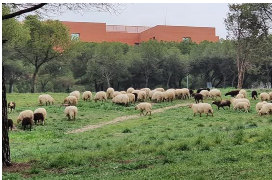
Rebaño de ovejas pastoreando en el campus de Moncloa

Además, los espacios verdes de la Complutense ya han acogido de manera esporádica rebaños de ovejas en su recorrido de trashumancia desde la sierra de Madrid a la casa de Campo o con el Rebaño por el Clima, con motivo de la celebración de la COP 25 en Madrid.