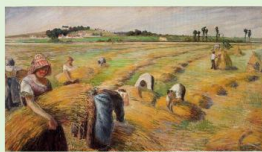
The Harvest, Camille Pissarro, 1882, Hodgson Museum of Art

Seminarios del IUSMP 2023-2024: LA VOZ DE LOS MAESTROS. SEMINARIO PERMANENTE DEL IUSMP