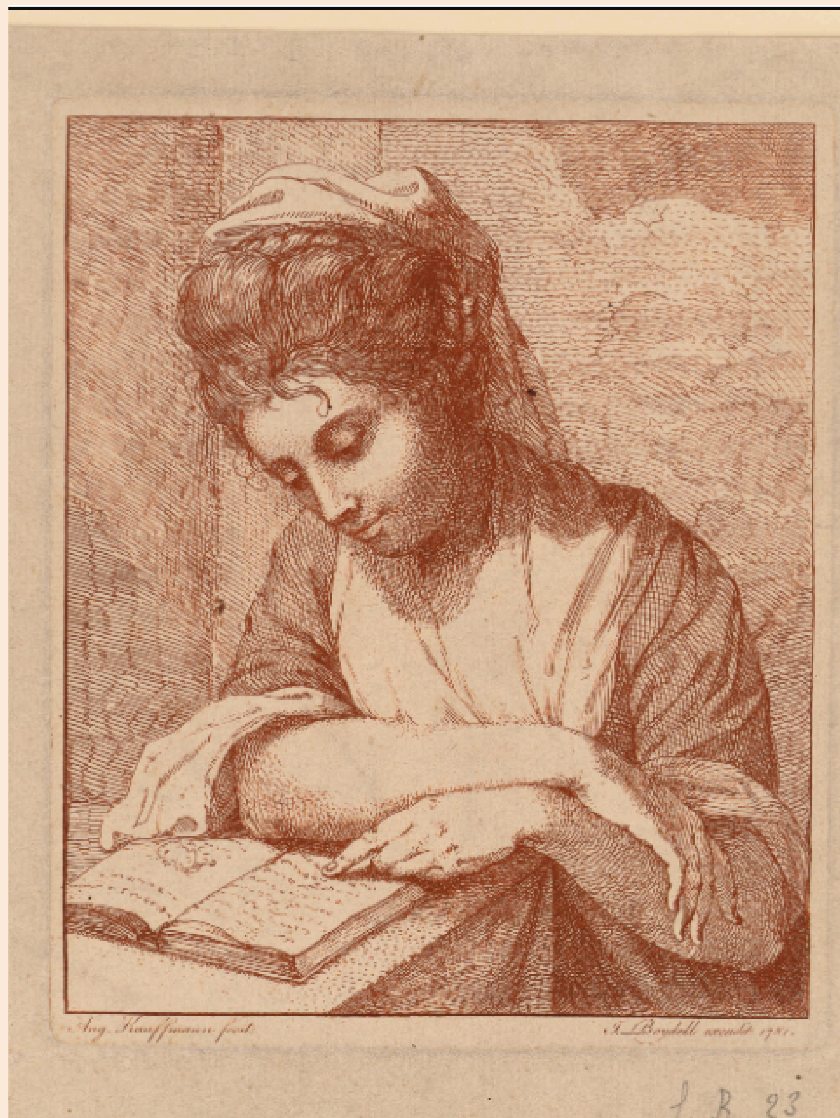
Imagen procedente de los fondos de la Biblioteca Nacional de España