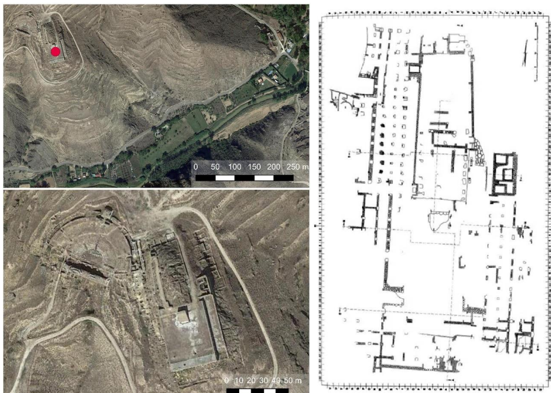
Figura 5. Plano general de Bilbilis y planimetría del foro, según Martín-Bueno.