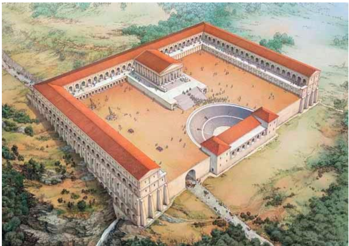
Figura 2. Vista general del santuario de Hércules Victor . Archeorivista.