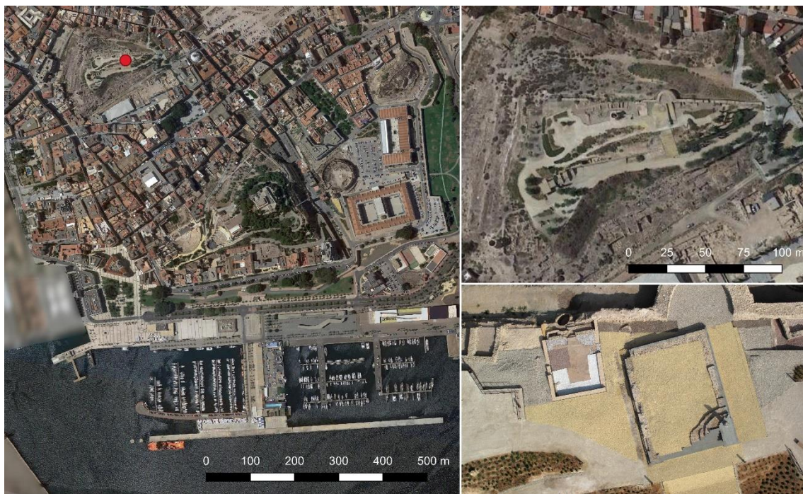
Figura 3. Plano general de la ciudad de Cartagena y detalle del cerro del Molinete. Elaboración propia.