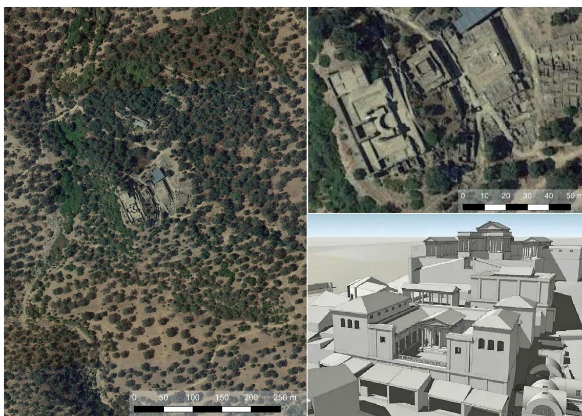
Figura 6. Plano general de Munigua e infografía del foro y el santuario de terrazas visto desde el este, según Schattner y Ruipérez.