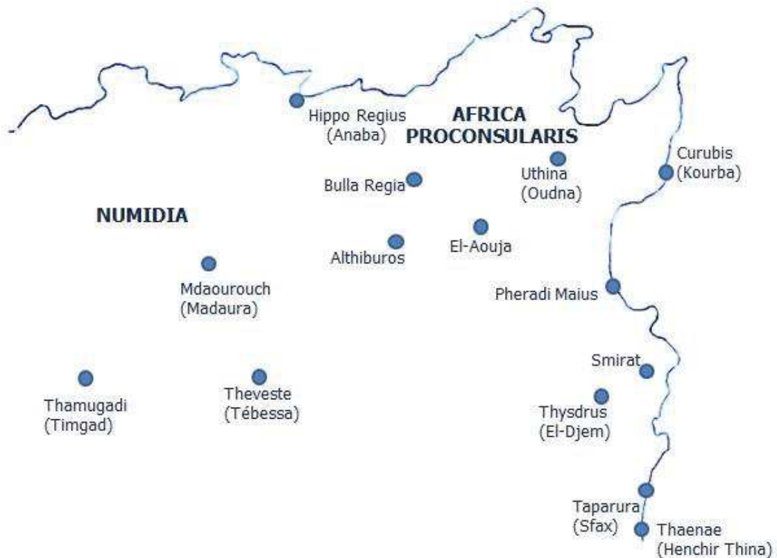
Fig. 2: Mapa que evidencia las principales ciudades donde se documenta la representación del creciente sobre asta. Se incluye entre paréntesis el nombre actual de cada sitio arqueológico.