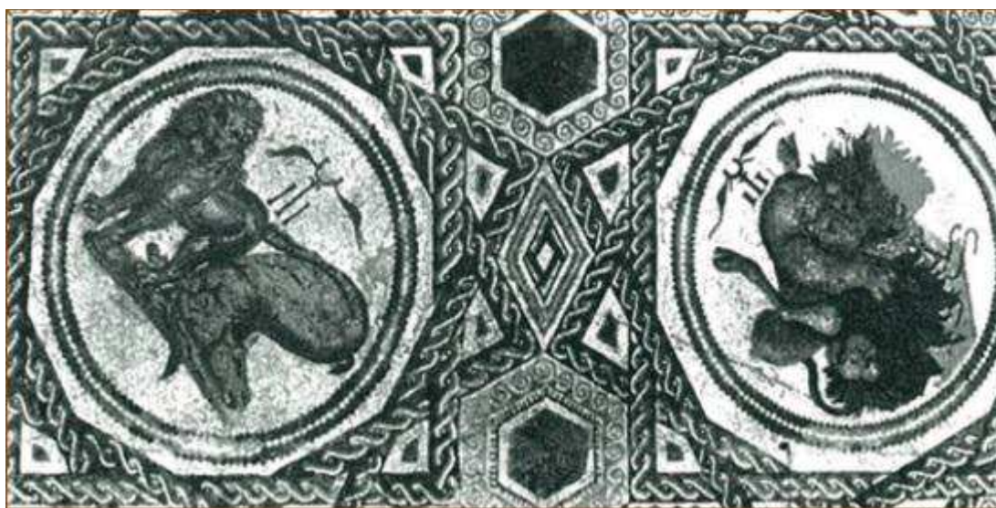
Fig. 4: Thysdrus (El-Djem). Casa de la "Cour e la Ferme Ferjani Kacem". Oecus . Detalle mosaico que representa la lucha de fieras junto al emblema de los Telegenii .