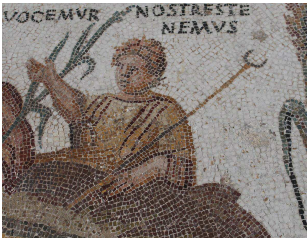
Fig. 3: Thysdrus (El-Djem). Mosaico del banquete. Detalle de venator portador del creciente sobre asta y cifra III. Fin. S. III d.C. Museo del Bardo, Túnez.