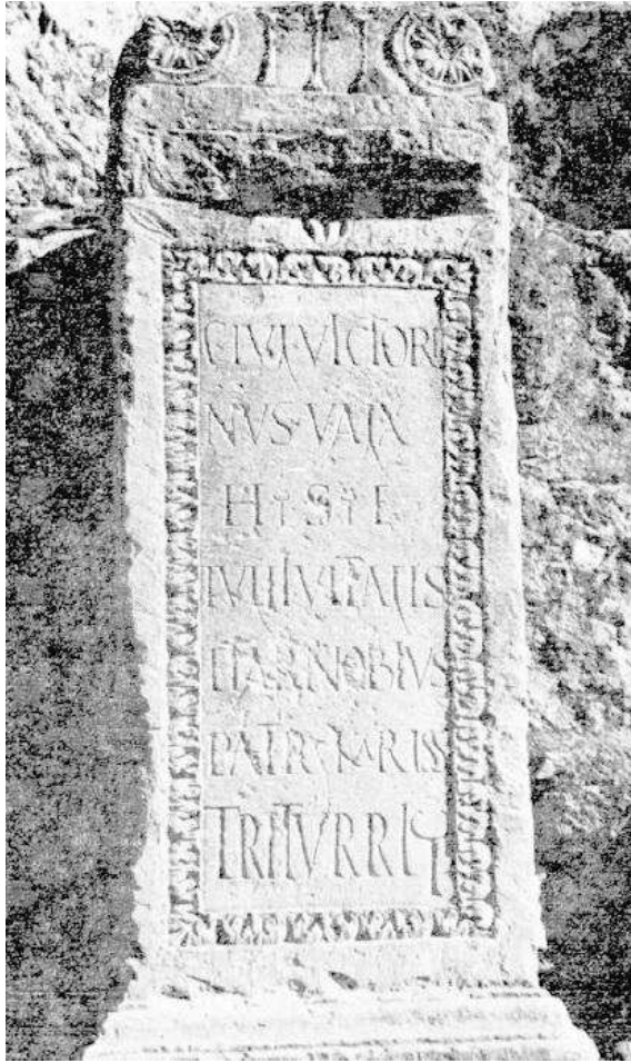
Fig. 5: Theveste (Tébessa). Epitafio con el nombre de la sodal de los Trivvri , creciente sobre asta y la cifra III, ésta en la parte superior.