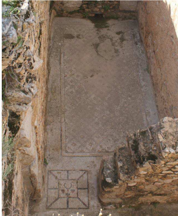
Fig. 1: Bulla Regia. “Casa del tesoro”. Piso subterráneo. Cubiculum . En el umbral de ingreso se representa el emblema de los Telegenii .