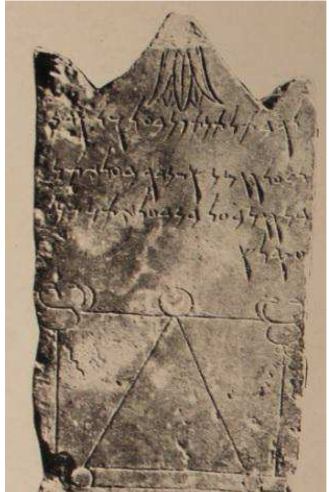
Fig. 6: Cartago. Estela votiva. Símbolo de Tanit sujetando dos caduceos. Piedra calcárea gris. S.III-II a.C. Museo del Bardo, Túnez.