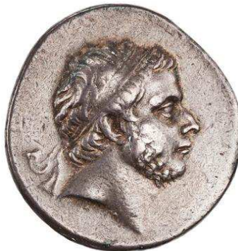
Fig. 2: Anverso de tetradracma de Prusias I.