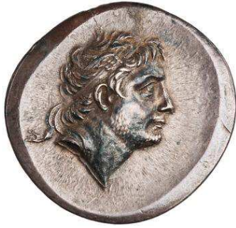
Fig. 4: Anverso de tetradracma de Prusias II.