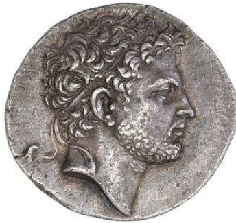
Fig. 5: Anverso de tetradracma de Perseo de Macedonia.