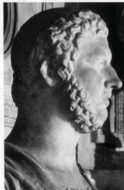
Fig. 3: Prusias Residenz.