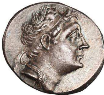
Fig. 6: Anverso de tetradracma de Nicomedes II.