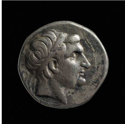
Fig. 1: Anverso de tetradracma de Nicomedes I.