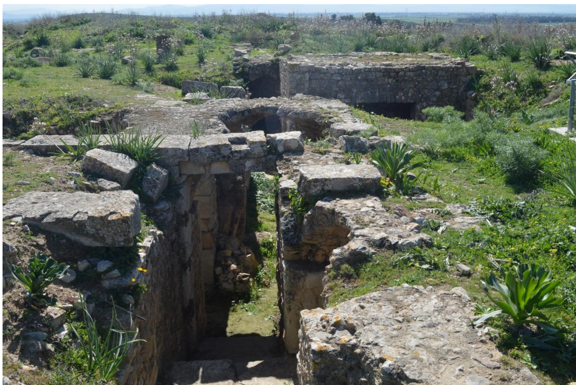
Fig. 6. Bulla Regia. "Casa del Pavo Real". Vista del piso subterráneo desde el piso superior (arruinado) (Fotografía de la autora).