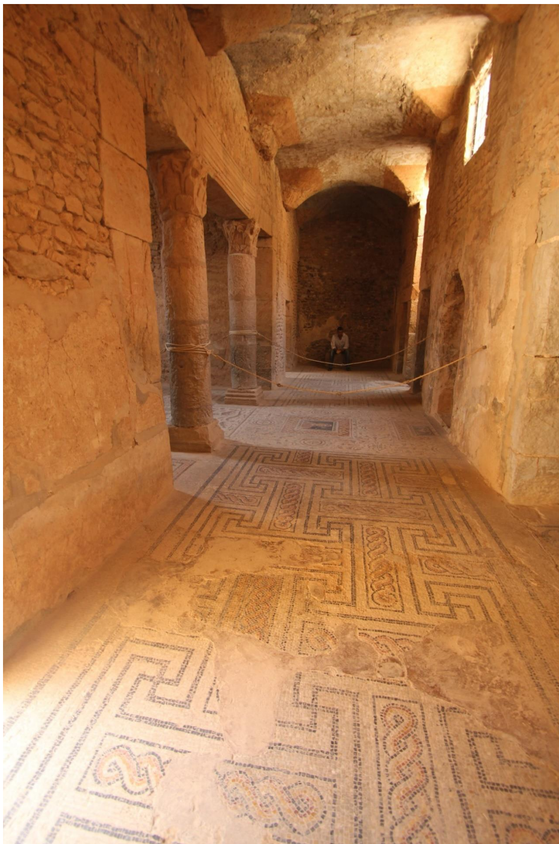
Fig. 5. Bulla Regia. "Casa del Triunfo de Venus Marina". Piso subterráneo. Vista del pasillo principal en torno al cual se disponen las distintas estancias.