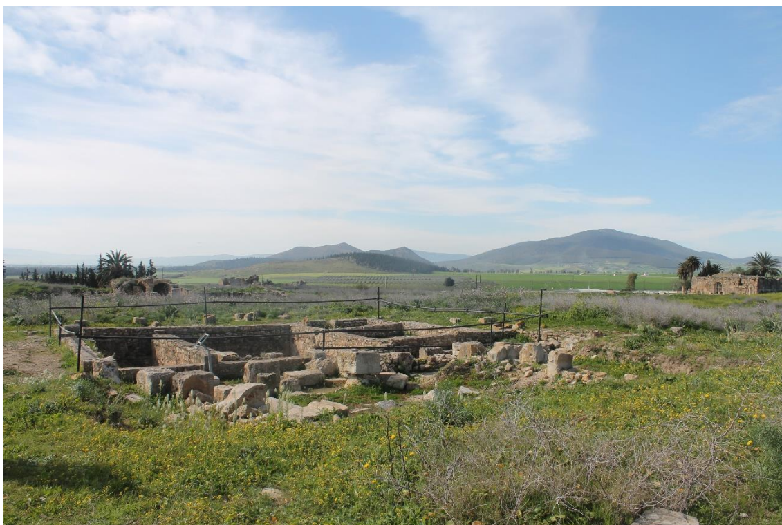
Fig. 2. Bulla Regia. "Casa del Tesoro". Vista del piso subterráneo desde el nivel superior.