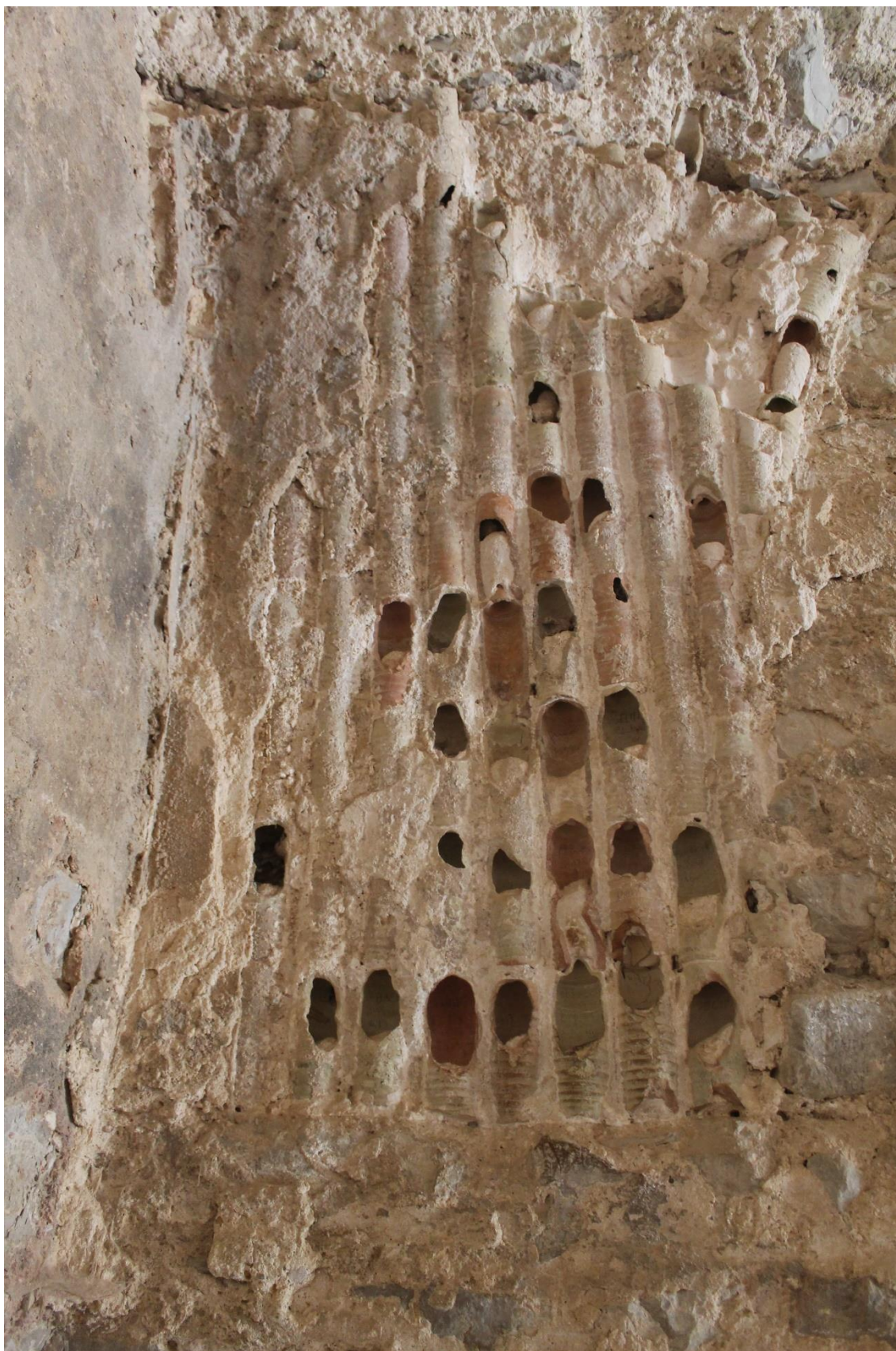
Fig. 4. Bulla Regia. "Casa de la Caza". Triclinium . Detalle de tubi fittili.