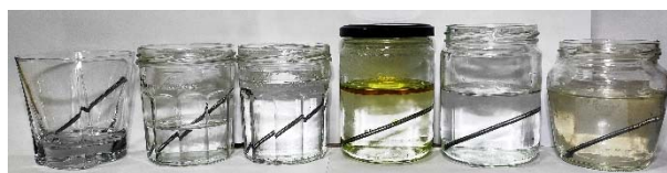
Figura 2. Montaje de la práctica.