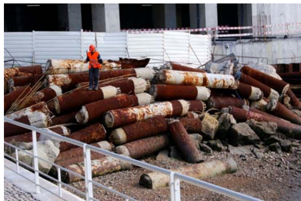
Figura 1. Herrumbre en acero situado en proximidad al agua de mar.