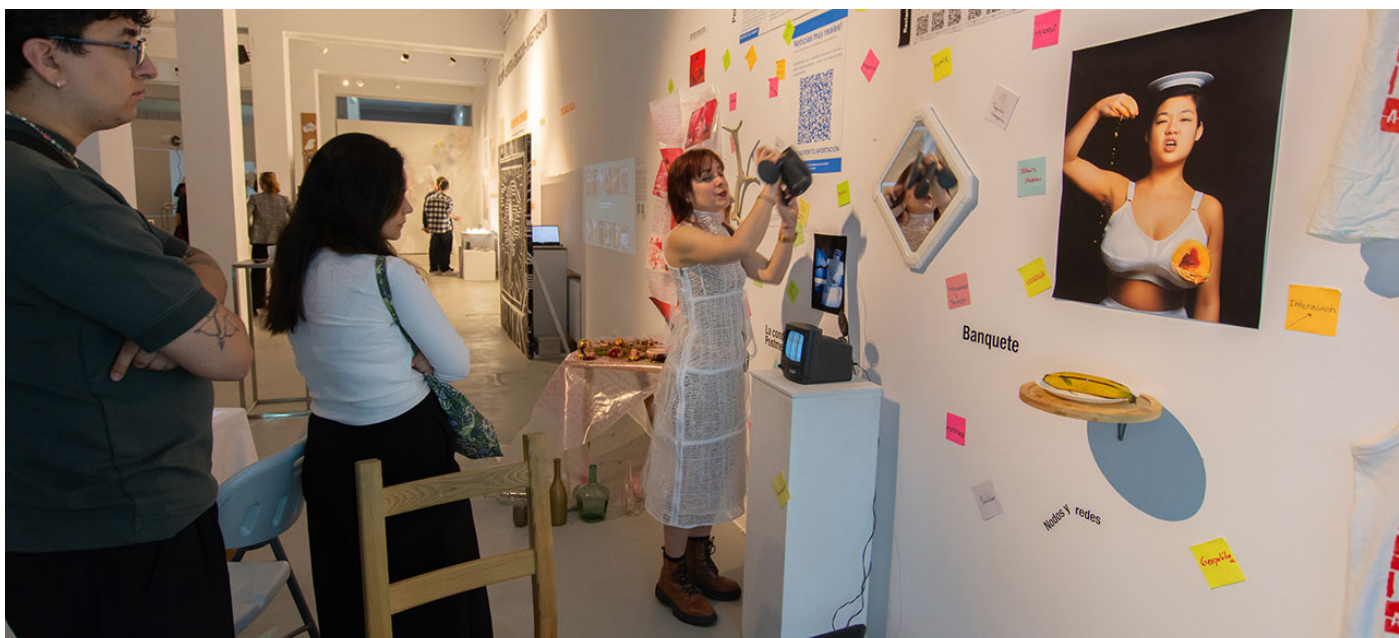
Exposición “Conectoma. Red de redes en el archivo de MediaLab Madrid”