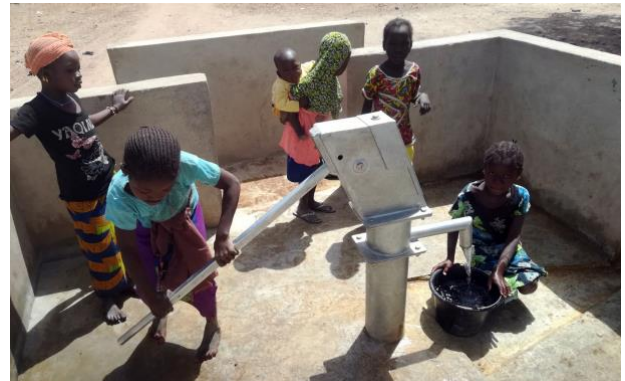
El sistema de abastecimiento doméstico de agua en muchos núcleos rurales del Sahel es el pozo comunitario. El acarreo de agua suele recaer sobre los más pequeños. En la imagen, un pozo comunitario equipado con bomba manual en Beleko (Mali).

La aplicación predice la presencia de agua de manera fiable en nueve de cada diez ocasiones. Además, las imágenes de satélite y el software de información geográfica en el que se integra —QGIS—, son de libre acceso, por lo que los resultados se obtienen a coste cero.