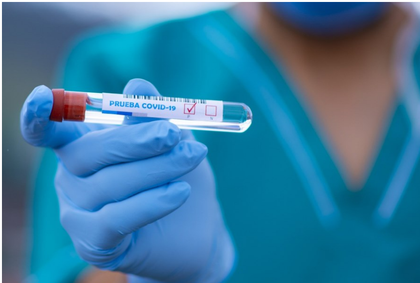
Aunando ventajas de la PCR y de los test rápidos, RAP-ID19 pretende aumentar la fiabilidad de los diagnósticos de COVID-19.

UCC-UCM, 19 de junio. - El proyecto RAP-ID19, coordinado por la Universidad Complutense de Madrid (UCM) con participación de la Universidad de Granada (UGR) y la empresa Atrys Health (ATH), comienza a desarrollarse con el objetivo de preparar un dispositivo diagnóstico portátil más fiable y rápido para la detección del SARS-CoV-2.