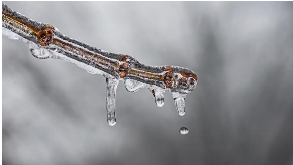
La clave del crecimiento peculiar de los cristales de nieve está en la estructura de su superficie.

UCC-UCM, 20 de mayo. - La superficie del hielo puede estar en tres estados diferentes con distinto grado de desorden. El paso de un estado a otro según sube la temperatura produce un cambio súbito en la tasa de crecimiento y explica las distintas formas que adoptan los cristales de hielo en la atmósfera, según una investigación de la Universidad Complutense de Madrid (UCM) y el Instituto de Química Física Rocasolano (IQFR-CSIC).