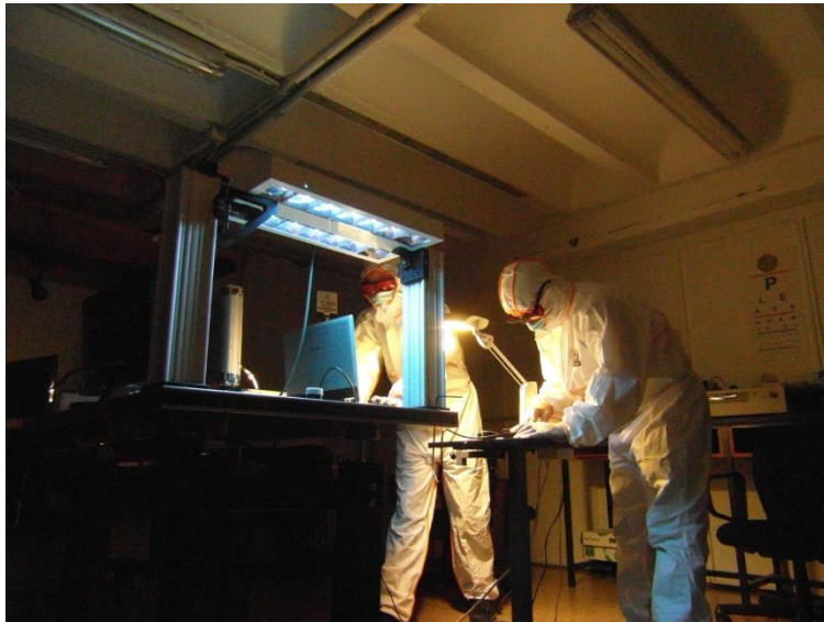
Tareas de Calibración de las lámparas ultravioleta en los laboratorios de la UCM.

Otra de las aportaciones del estudio ha sido incluir la caracterización óptica de los medios de cultivo del virus en los laboratorios, que en muchas ocasiones no son completamente transparentes. “La luz que realmente llega al patógeno se absorbe en mayor o menor medida según las características ópticas y la forma que toma el medio de cultivo que aloja el virus. Nuestro trabajo ha incluido estos efectos y ha permitido una mejor determinación de la energía de inactivación del SARS-CoV-2”, señala Alda.