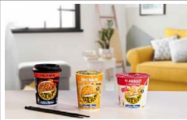
Yatekomo de Gallina Blanca.

La Justicia europea anuló en 2019 la marca Yatekomo de Gallina Blanca para ciertos productos al indicar que existía la posibilidad de confusión con la previamente registrada Yatecomeré.