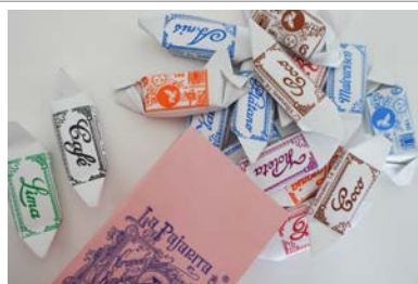
Caramelos La Pajarita.

a) Ser secreto, en el sentido de que, en su conjunto o en la configuración y reunión precisas de sus componentes, no es generalmente conocido por las personas pertenecientes a los círculos en que normalmente se utilice el tipo de información o conocimiento en cuestión, ni fácilmente accesible para ellas; b) tener un valor empresarial, ya sea real o potencial, precisamente por ser secreto, y c) haber sido objeto de medidas razonables por parte de su titular para mantenerlo en secreto; el diseño industrial lo está en la Ley 20/2003, de 7 de julio, de Protección Jurídica del Diseño Industrial definiéndose éste como la apariencia de la totalidad o de una parte de un producto, que se derive de las características de, en particular, las líneas, contornos, colores, forma, textura o materiales del producto en sí o de su ornamentación.