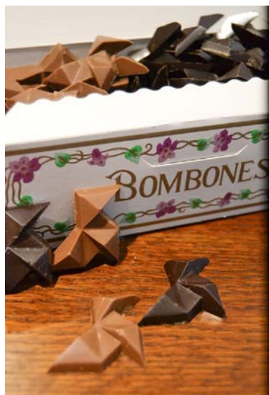
Bombones La Pajarita.

Y es que sobre un mismo objeto se pueden aplicar diferentes instrumentos jurídicos de protección aunque no siempre son compatibles entre sí. Este es el caso de los caramelos “La pajarita”.