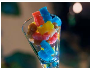
Ositos con alcohol.

La empresa alemana HARIBO amenazó con emprender acciones legales contra la startup vasca (Ositos&co) por considerar que los ositos con alcohol que esta última produce y comercializa pueden crear confusión con los de su marca por su gran similitud.