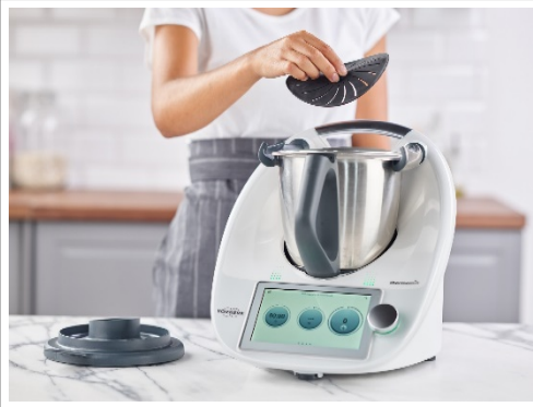
Thermomix® TM6.

Además, la sentencia ha condenado a Lidl a: