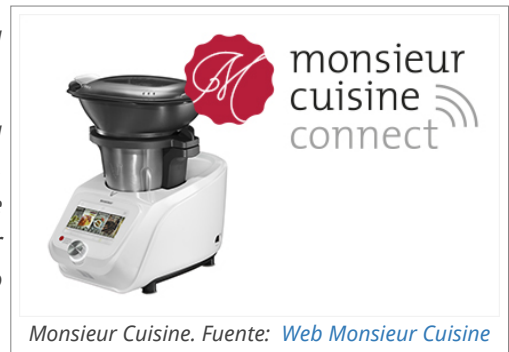
Monsieur Cuisine.

Y si estás muy pero que muy interesada/o, aquí puedes consultar la propia Sentencia del Juzgado de lo Mercantil núm. 5 de Barcelona.