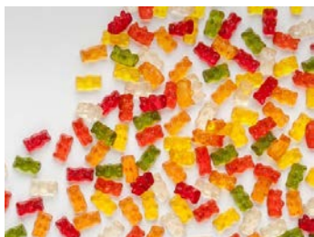
Ositos Haribo.

Fuente: El País y The Guardian ; y aquí la nota de prensa de Ositos&co.