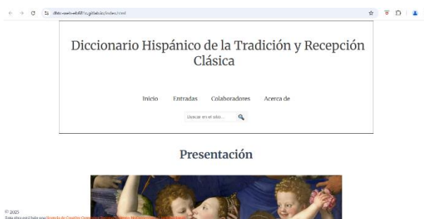
Figura 2. Apariencia de la página de inicio del DHTC-en línea.

Esta herramienta digital permite acceder al mapeo conceptual más exhaustivo disponible en cualquier lengua acerca de la disciplina de la tradición y recepción clásica. De esta manera, el usuario podrá tener un acceso inmediato a información fiable y contrastada, redactada por especialistas internacionales en la materia. En el caso de los alumnos, que a menudo buscan información en internet y no se preocupan por sus fuentes o por su veracidad, el DHTC-en línea supone un recurso fundamental para su educación.