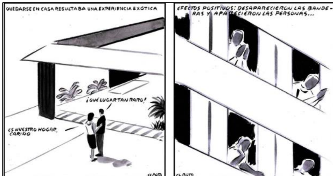
Viñetas de El Roto en El País el 16 de marzo y el 8 de abril, respectivamente.