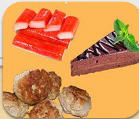
Alternativa a las grasas