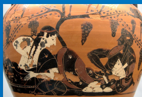
Ariadna y Dioniso Ánfora ática (ca. 520 AEC) Berlín Staatliche Antikensammlungen [1562]