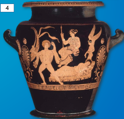
Ariadna dormida Atrib. Pintor de Ariadna Estamno ático (400-390 AEC) M. Fine Arts, Boston [00.349a]

...y tras el abandono, la boda con el dios.