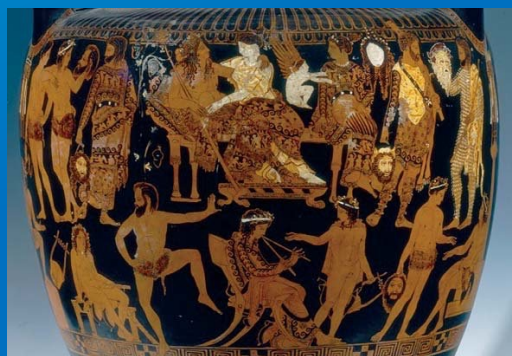
Cratera de Prónomo Atrib. Pintor de Prónomo ca. 400 AEC Museo Archeologico Nazionale Napoli [H3240]

Ariadna, entronizada como diosa, celebra con Dioniso la música y el drama, de los que es protector en los festivales de la antigua Grecia.