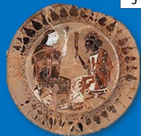
Ariadna con flor y Dioniso Maratón (ca. 550 AEC) Berlín Antikensammlung [F 1809]