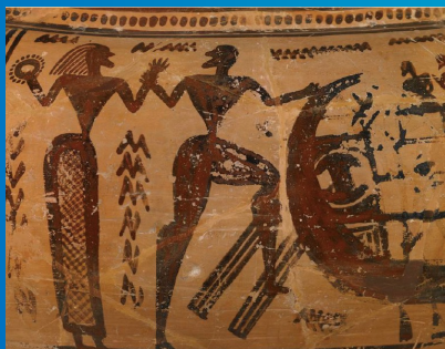
¿Teseo y Ariadna? huyendo por mar ca. 735 AEC Cratera procedente de Tebas British Museum [1899, 0219.1]