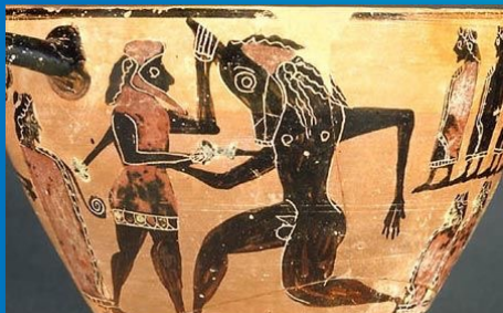
Ariadna, Teseo y el Minotauro Esquifo de fig. negras (ca. 550 AEC) Musée du Louvre [MNC 675]

Ἀριάνη (SEG 1-41 2.396 Macedonia Aet.Romana; SEG 1-41 36.590, Macedonia; SEG 1-36 4.15, Siracusa; IG XII 1 759, Rodas; TAM V, 1-2 432.15, Lidia 215 AEC; Sardis 7.1 162.2, Lidia III-II AEC; Hsp 41 41.32, Corinto VI-V AEC; Agnello [Sicilia] 41.1, Siracusa) y Ἀριάδη/Ἀριάδα según Zenódoto (Sch. in Iliadem 18.592) y Calímaco Filólogo ( Aetia 67.13). La forma es confirmada en Hesiquio (Hsch. α.7201): Ἀριάδαν- τὴν Ἀριάδην. Κρήτες