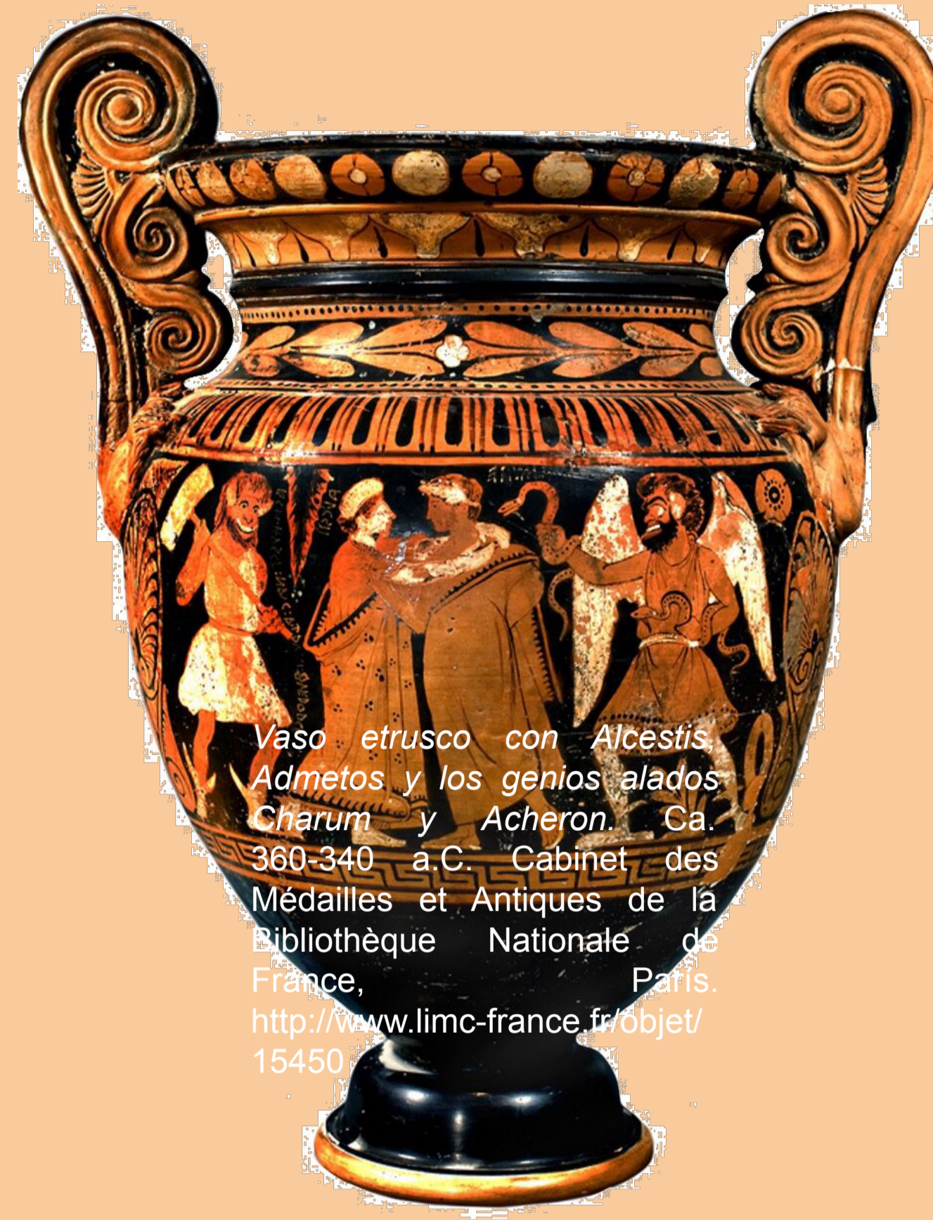
Vaso etrusco con Alcestis, Admeto y los genios aliados Charun y Acheron, ca. 360-340 a.C. Cabinet des Médailles et Antiques de la Bibliothèque Nationale de France, París. http://www.limc-france.fr/objet/15450