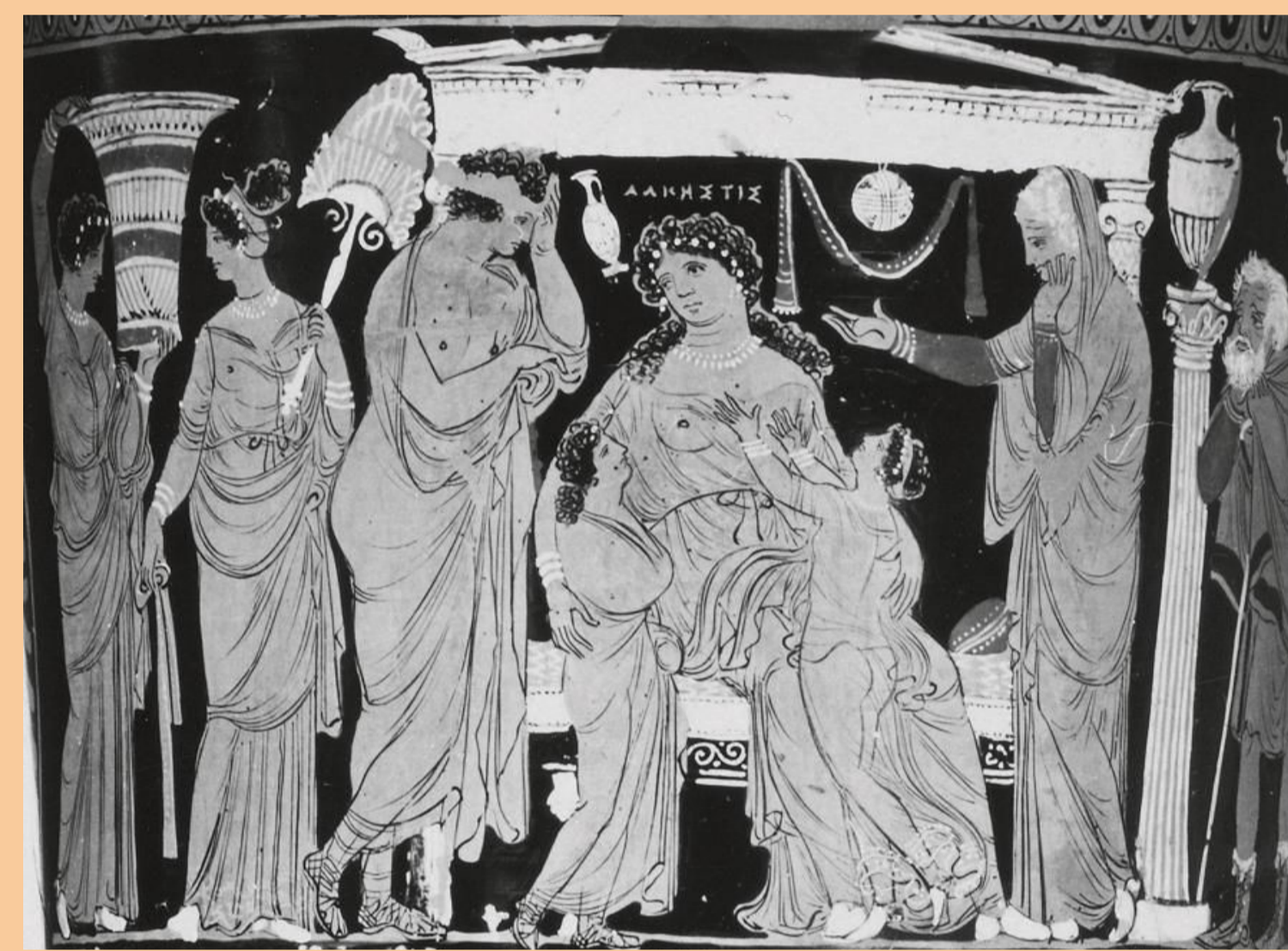
Lutróforo de Alcestis. Fecha desconocida. Antikenmuseum und Sammlung Ludwig, Basilea.

Durante la época moderna, el mito de Alcestis tiene un nuevo enfoque, la muerte: se representa principalmente el momento en el que Heracles la rescata del Hades y lucha con la Muerte; o el momento en el que se yace muerta sobre su cama. Es interesante ver cómo los valores románticos del tema se adecuan a su momento histórico y prima ante todo esa lucha y la hazaña de volver a la vida y de perderla por amor. Asimismo, se puede apreciar que en casi todos los casos, Alcestis va acompañada de sus hijos, implicando así que los artistas siguieron y tomaron las fuentes clásicas de Eurípides.