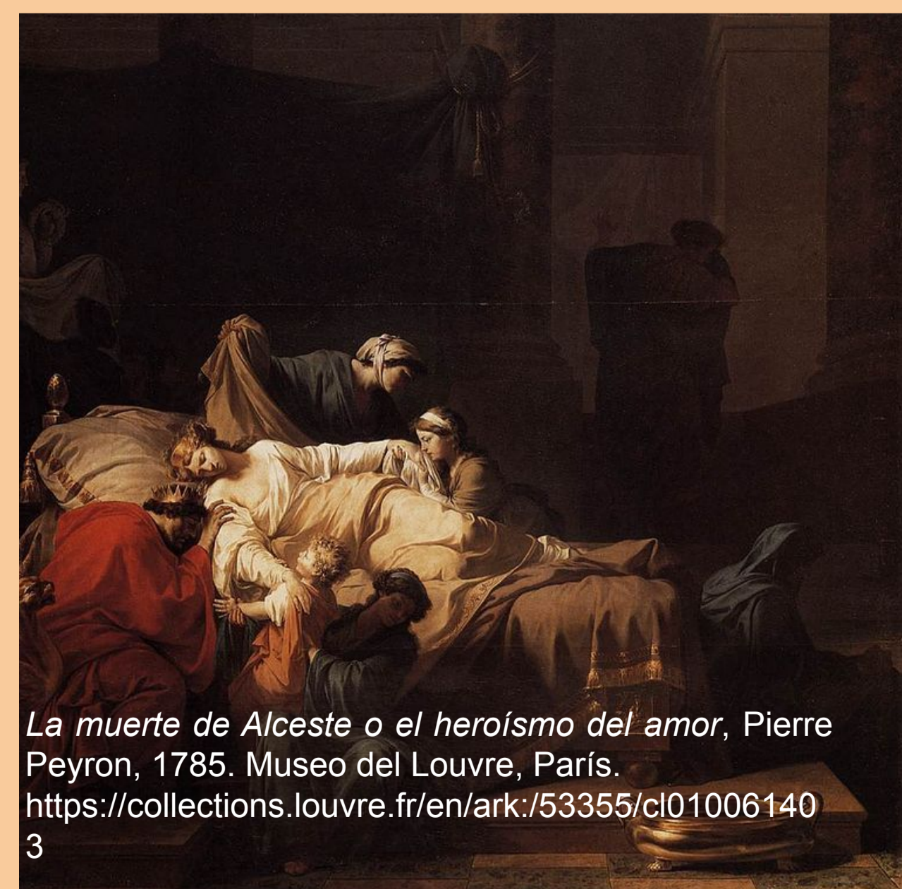
La muerte de Alceste o el heroísmo del amor, Pierre Peyron, 1785. Museo del Louvre, París. https://collections.louvre.fr/en/ark:/53355/cl010061403

Durante la época moderna, el mito de Alcestis tiene un nuevo enfoque, la muerte: se representa principalmente el momento en el que Heracles la rescata del Hades y lucha con la Muerte; o el momento en el que se yace muerta sobre su cama. Es interesante ver cómo los valores románticos del tema se adecuan a su momento histórico y prima ante todo esa lucha y la hazaña de volver a la vida y de perderla por amor. Asimismo, se puede apreciar que en casi todos los casos, Alcestis va acompañada de sus hijos, implicando así que los artistas siguieron y tomaron las fuentes clásicas de Eurípides.