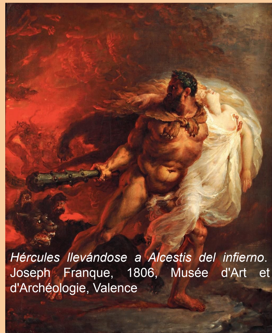
Hércules llevándose a Alcestis del infierno, Joseph Franque, 1806, Musée d'Art et d'Archéologie, Valence