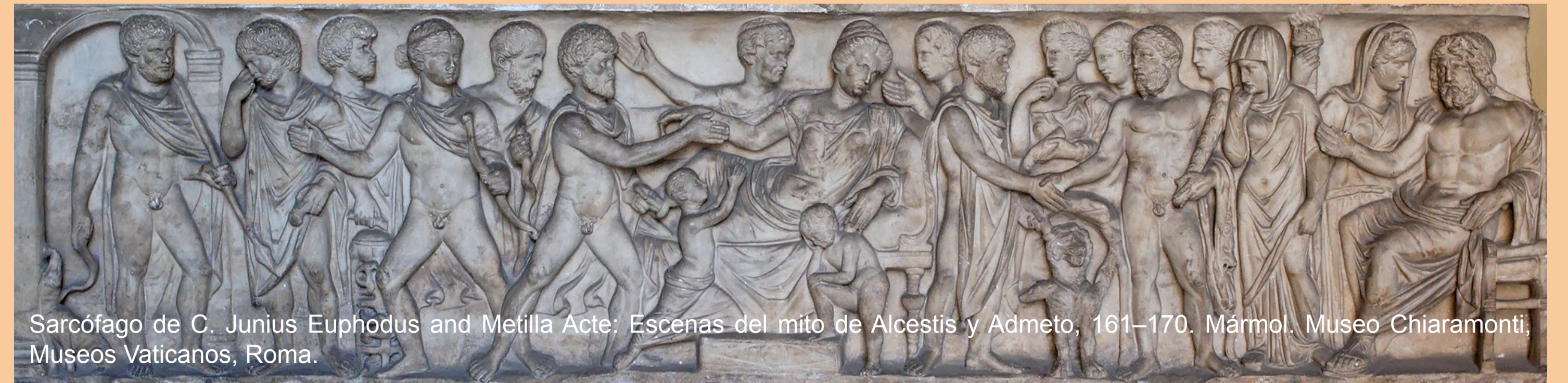
Sarcófago de C. Junius Euphodus and Metilla Acte: Escenas del mito de Alcestis y Admeto, 161-170. Mármol, Museo Chiaramonti, Museos Vaticanos, Roma.

Alcestis es una princesa de la mitología griega conocida principalmente por el amor incondicional a su marido Admeto, ya que dio su vida por él para más tarde ser rescatada del Hades por Heracles. Es una mujer que ha sido tema y objeto de inspiración principal de numerosas obras literarias desde la antigüedad ( Alcestis , tragedia de Eurípides, 438 a.C.) hasta época moderna ( Alceste , obra de teatro de Benito Pérez Galdós, 1914) por la valentía y el sacrificio que realiza en señal de amor hacia su esposo, siendo un símbolo no sólo de mujer afectuosa, sino también de fuerza, generosidad, fortaleza, vigor y valentía. A la hora de representar a esta heroína se juega con los dos momentos más importantes de su mito: cuando se suicida y lloran su pérdida, y cuando es rescatada por Heracles del Hades. Es interesante mencionar que estas dos temáticas apuntan diversos valores, ya que mientras el primero impone la fuerza y el valor del sacrificio femenino, en el segundo es el rescate masculino de la mujer. Independientemente, su figura ha sido y es un ejemplo de expiación hacia las personas que más amamos dando incluso la propia vida.