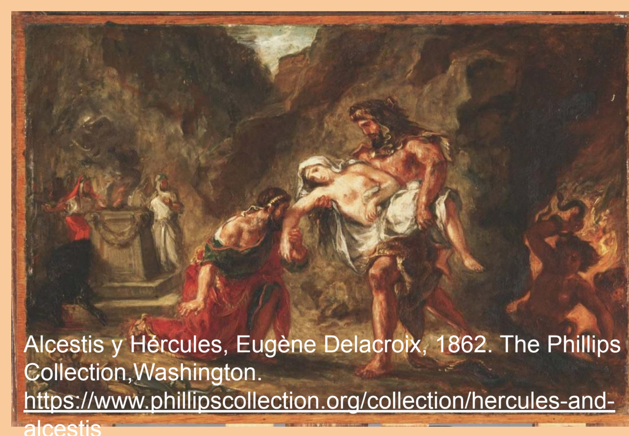
Alcestis y Hércules, Eugène Delacroix, 1862. The Phillips Collection, Washington. https://www.phillipscollection.org/collection/hercules-and-alcestis