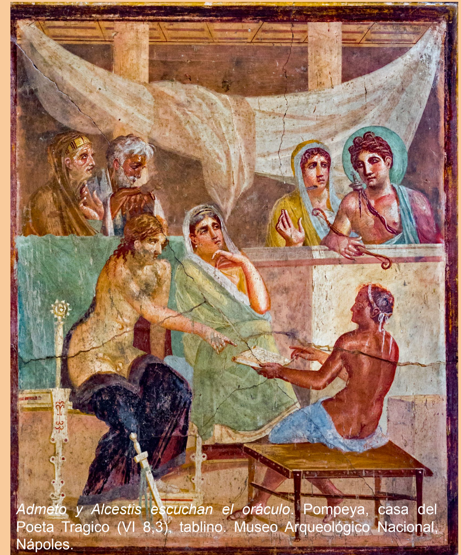
Admeto y Alcestis escuchan el oráculo, Pompeya, casa del Poeta Tragico (VI 8,3), tablino. Museo Arqueológico Nacional, Nápoles.