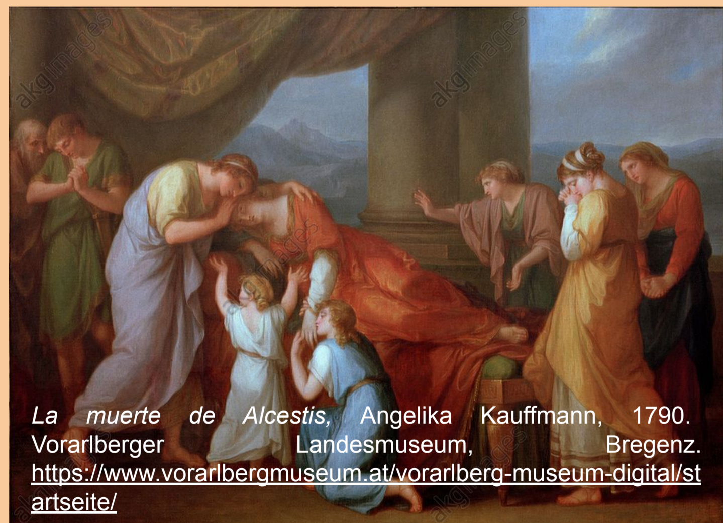
La muerte de Alcestis, Angelika Kauffmann, 1790. Vorarlberger Landesmuseum, Bregenz. https://www.vorarlbergmuseum.at/vorarlberg-museum-digital/st-arteite/