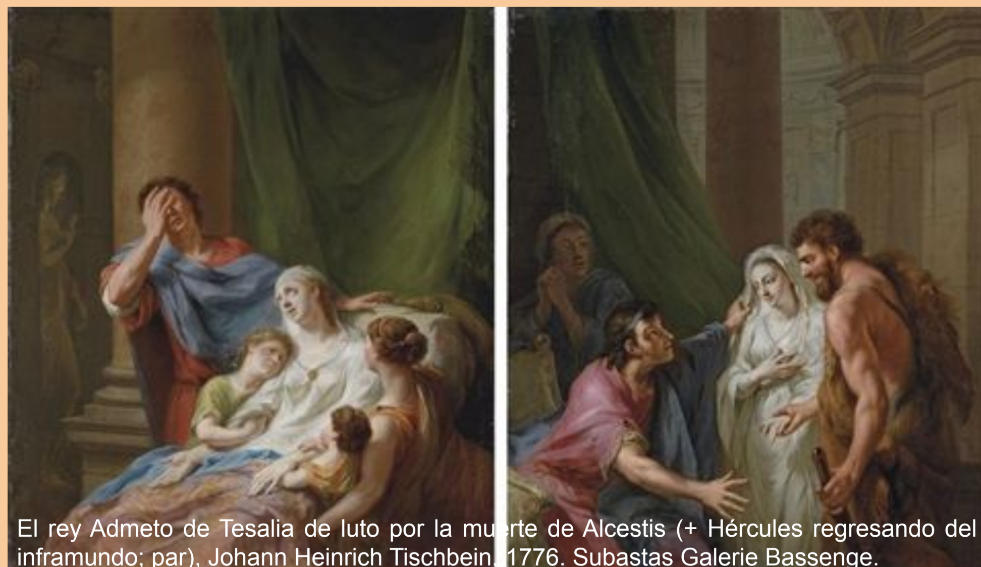
El rey Admeto de Tesalia de luto por la muerte de Alcestis (+ Hércules regresando del inframundo; par), Johann Heinrich Tischbein, 1776. Subastas Galerie Bassenge.

"Mira la ambición de los hombres que te rodean y considera cuán singularmente se ven afectados por el amor de ganar un nombre. ¿Supones que Alcestis habría muerto por Admeto, o que Aquiles habría buscado la muerte en el cadáver de Patroclo si hubieran ¿No se espera que ganemos 'un recuerdo inmortal del valor', que ahora conservamos?" (Diotima a Sócrates. Platón, El Banquete 208d).