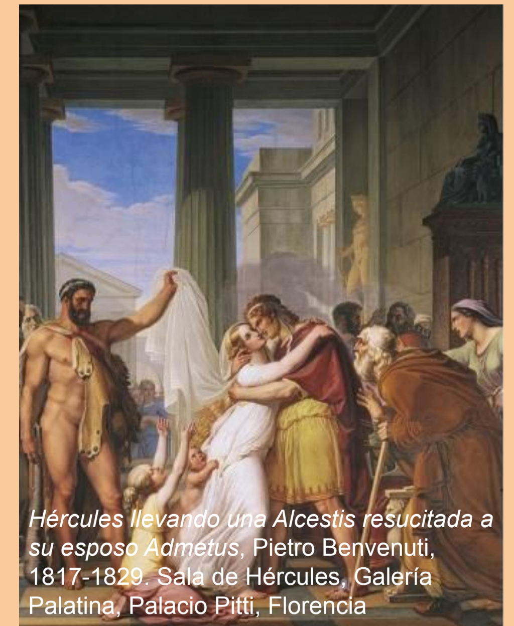
Hércules llevando a Alcestis resucitada a su esposo Admeto, Pietro Benvenuti, 1817-1829. Sala de Hércules, Galería Palatina, Palacio Pitti, Florencia