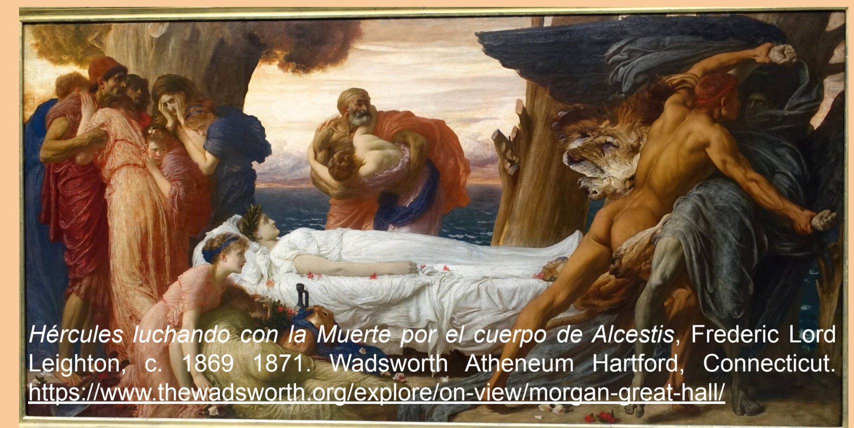
Hércules luchando con la Muerte por el cuerpo de Alcestis, Frederic Lord Leighton, c. 1869-1871. Wadsworth Atheneum Hartford, Connecticut. https://www.thewadsworth.org/explore/on-view/morgan-great-hall/