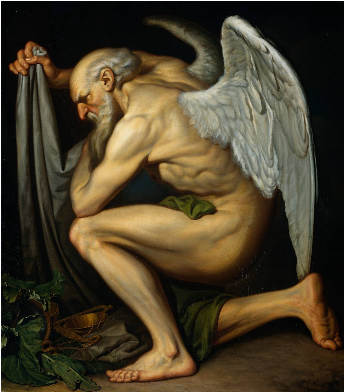
Pieter Cornelis Wonder: Father Time, 1810; Rijksmuseum, Amsterdam

El tiempo es implacable: revela la Verdad, puede al Amor y a la Belleza. Pero también es siniestro, como lo pintaron Rubens y Goya. Rubens lo representó con un realismo despiadado y con las tres estrellas que nos recuerdan su condición planetaria y Goya con una visión negra, sangrienta, paranoica, ... en ambos casos mortal. El Triunfo del Tiempo vence sobre todas las cosas, desemboca en la muerte. Después del mito griego existen muchas preguntas y muchas reflexiones en torno al Tiempo y por eso las diferentes culturas han evocado su imagen demoledora, para recordarnos, al fin y al cabo, que somos mortales.