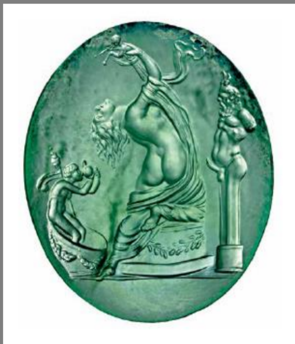
s. I d. C. Rijksmuseum van Oudheden, Leiden