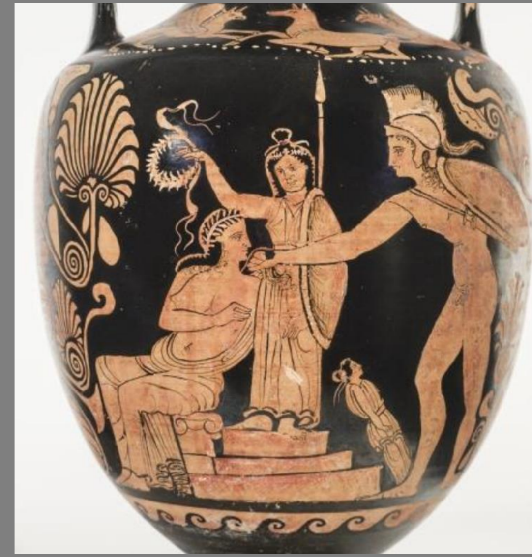
350 a.C. MAN