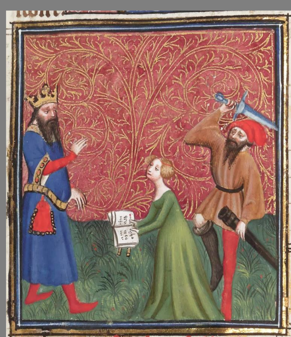
Cassandra predice su propia muerte en "Cas des nobles hommes et femmes" Traducción al francés de Boccaccio ms. Français 12420, f. 48v, (s. XV) Bibliothèque nationale de France

Entre los siglos XV-XVII abundan episodios secundarios de la vida de Cassandra en los que se busca potenciar su santidad, su piedad, respeto a los dioses y defensa de la familia.