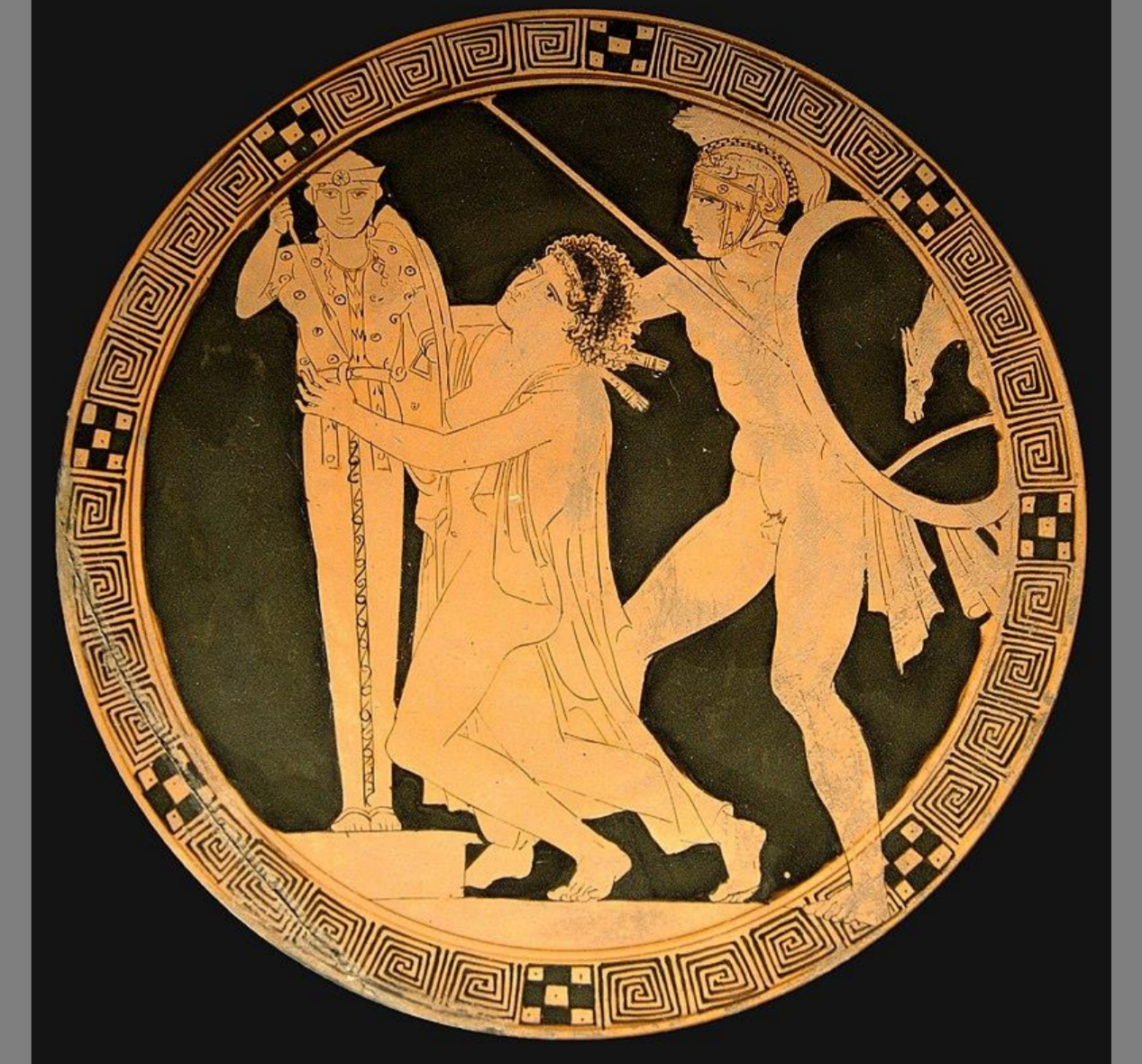
440-430 a. C. Louvre