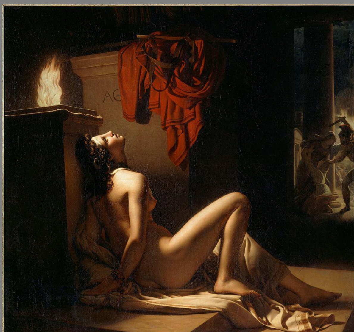
Cassandra implorando venganza a Minerva contra Ajax Jérôme Martin Langlois (1810) Musée des Beaux Arts de Chambéry