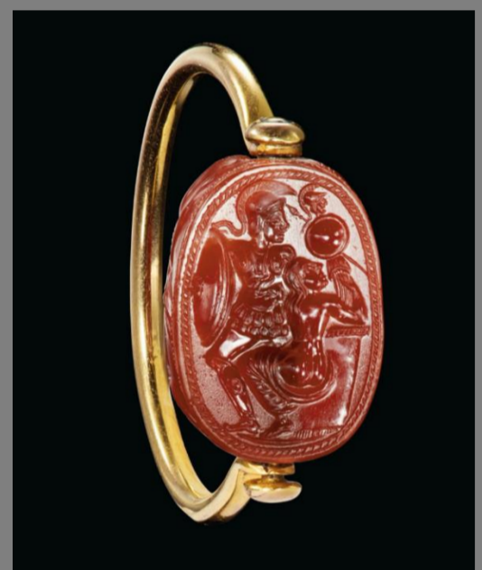
s. V a. C (Etrusco)