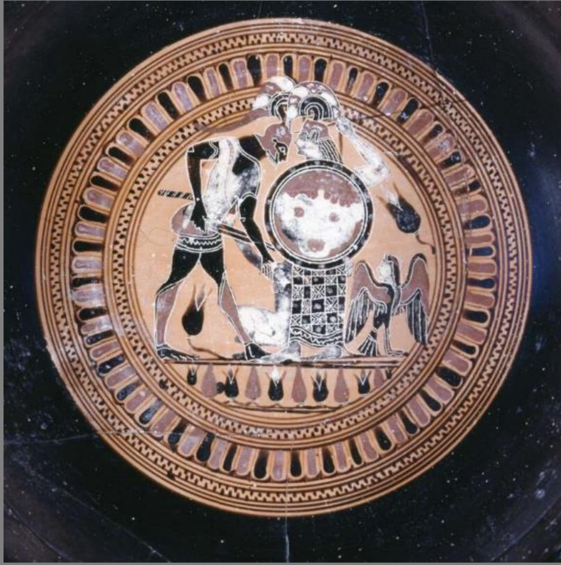
570-560 a. C. British Museum

Ante la caída de Troya, Cassandra se refugia en el santuario de Atenea y se acoge a la protección de la diosa, abrazando su escultura que algunas fuentes confunden con el propio palladium , una estatua realizada en madera que aseguraba la pervivencia de la ciudad. El guerrero aqueo Ajax el Menor desoye los ruegos de Cassandra e ignora la sacralidad del recinto: tira de ella, derriba el icono y somete a la princesa. El sacrilegio del guerrero provocó la ira de los dioses, quienes lo castigaron hundiendo su barco. En la pintura vascular Cassandra suele aparecer desnuda o semidesnuda, aludiendo no solo a la agresión sexual sino también a su vulnerabilidad. La gestualidad de Ajax varía desde la clara violencia - cogiendo por el brazo o los cabellos a Cassandra - hasta posturas más benignas que se asocian a escenas galantes pero con ciertas connotaciones funerarias. En época romana el tema continuará casi sin modificaciones.