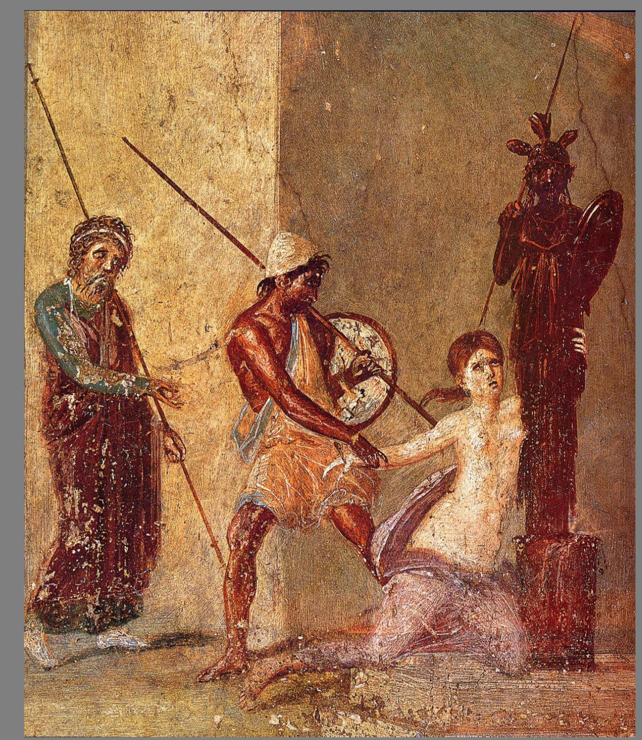
s. I d. C. Casa del Menandro, Pompeya