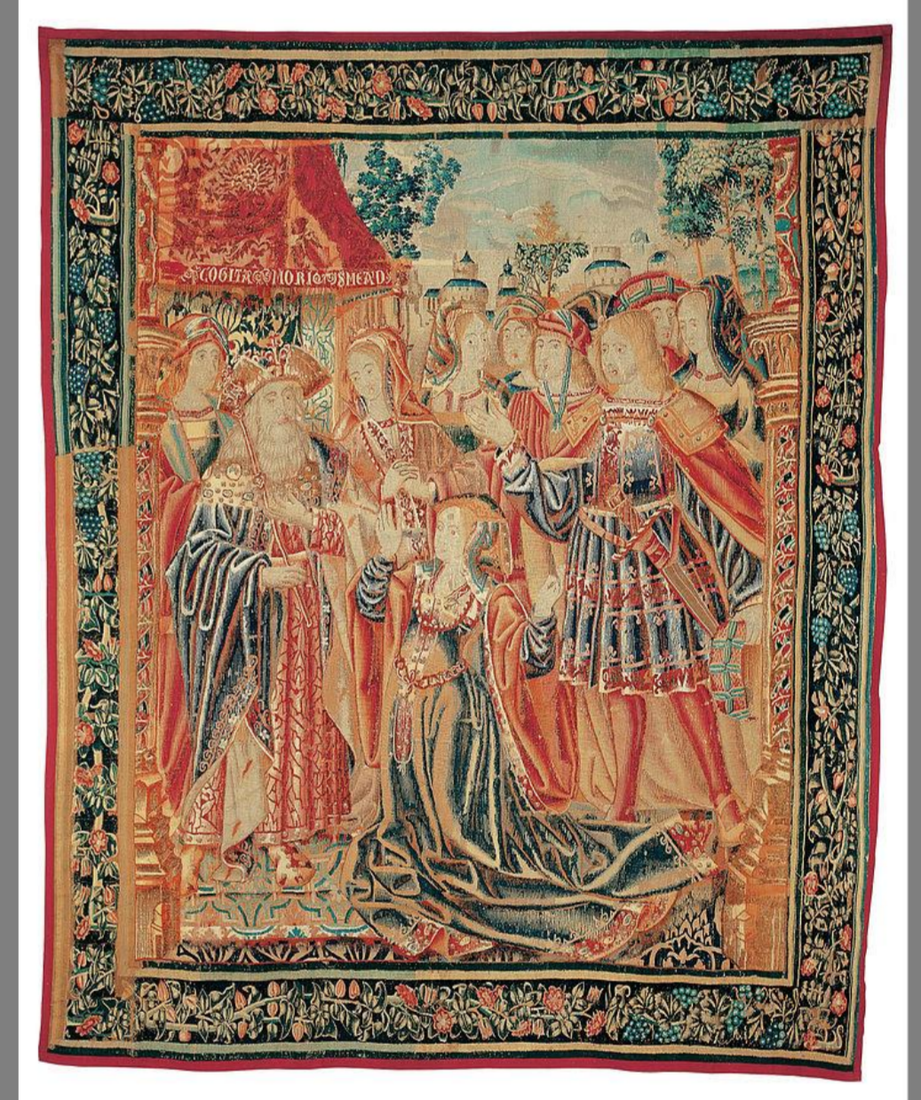
Cassandra intercede ante Príamo para obtener el perdón para Paris (1515-1525) Tapiz de lana y seda Banco Santander