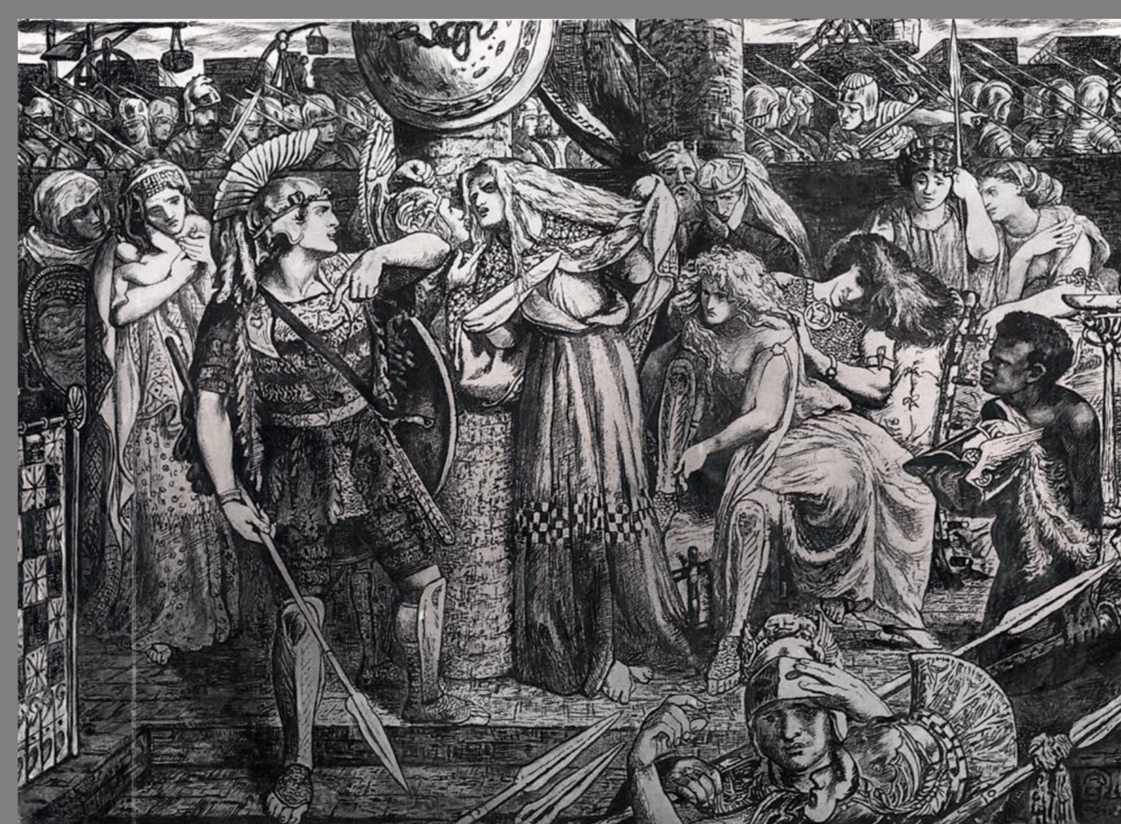
Cassandra Dante Gabriel Rossetti (1861-1867) British Museum