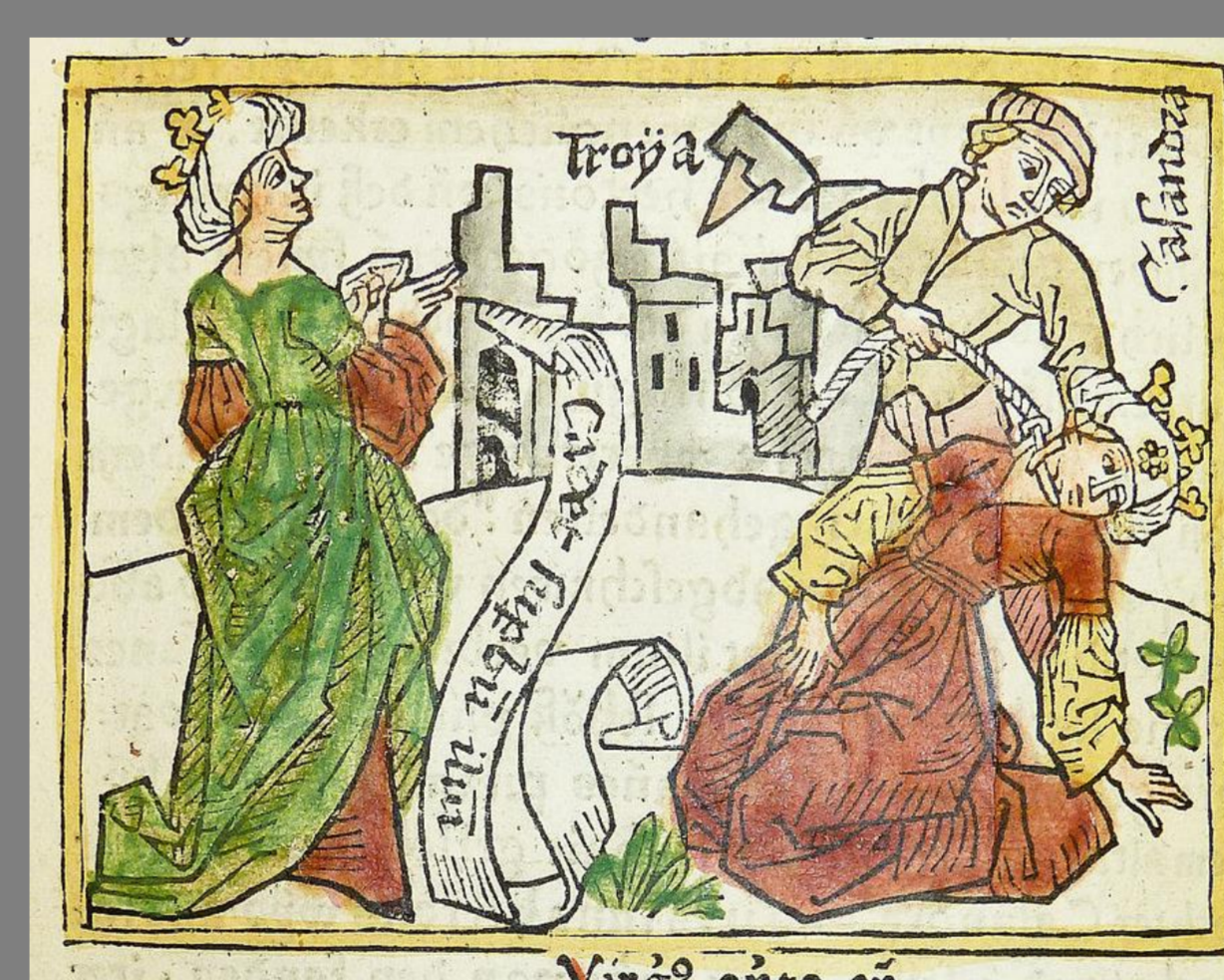
Cassandra predice la caída de Troya y su propia muerte Traducción en alemán de Boccaccio (1474) Bibliotecas Penn