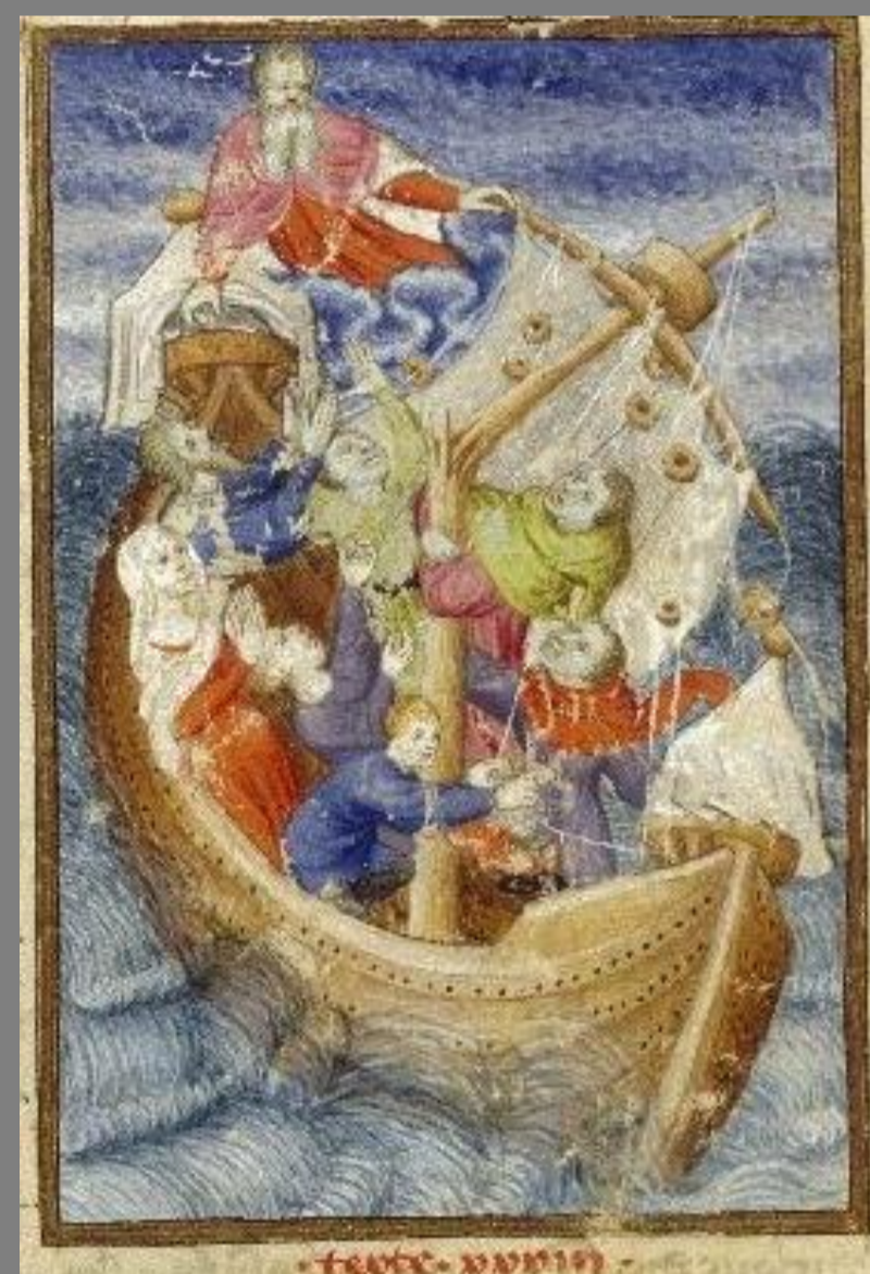
Cassandra rezando a Poseidón Obras varias de Christine de Pizan (1410-1414) Master of the Cité des Dames British Library