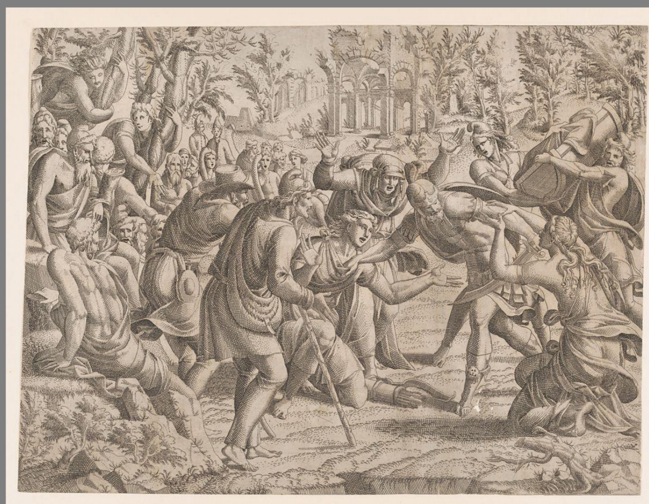
Cassandra impidiendo que Deifobo mate a Paris Jean Mignon (1535-1555) Metropolitan Museum of New York