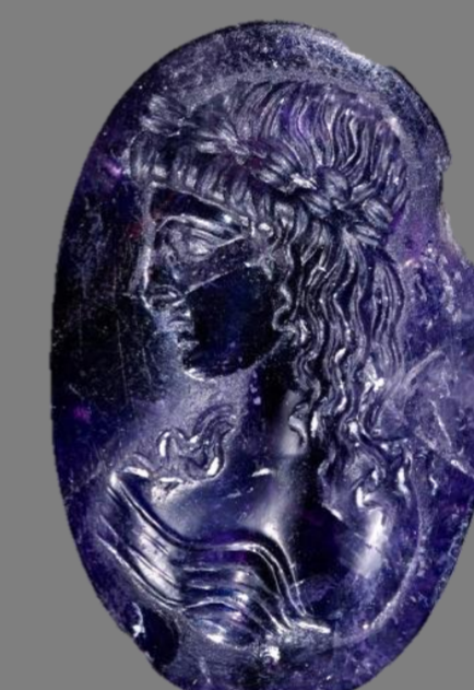
s. I d. C. The J. Paul Getty Museum