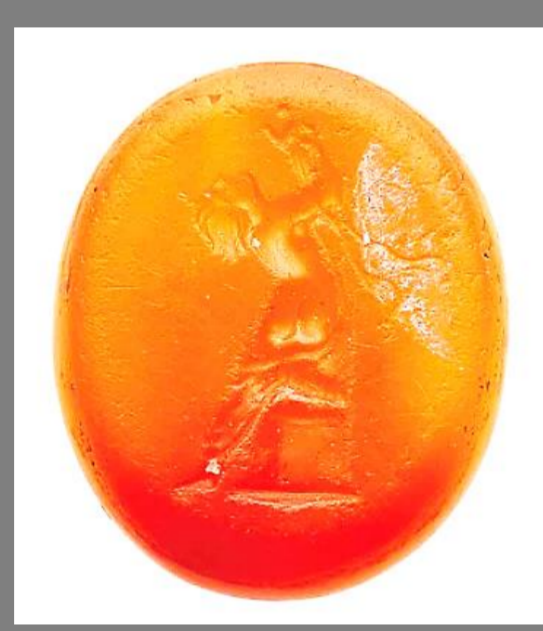
s. II d. C. d. C. (Romano) Christie's