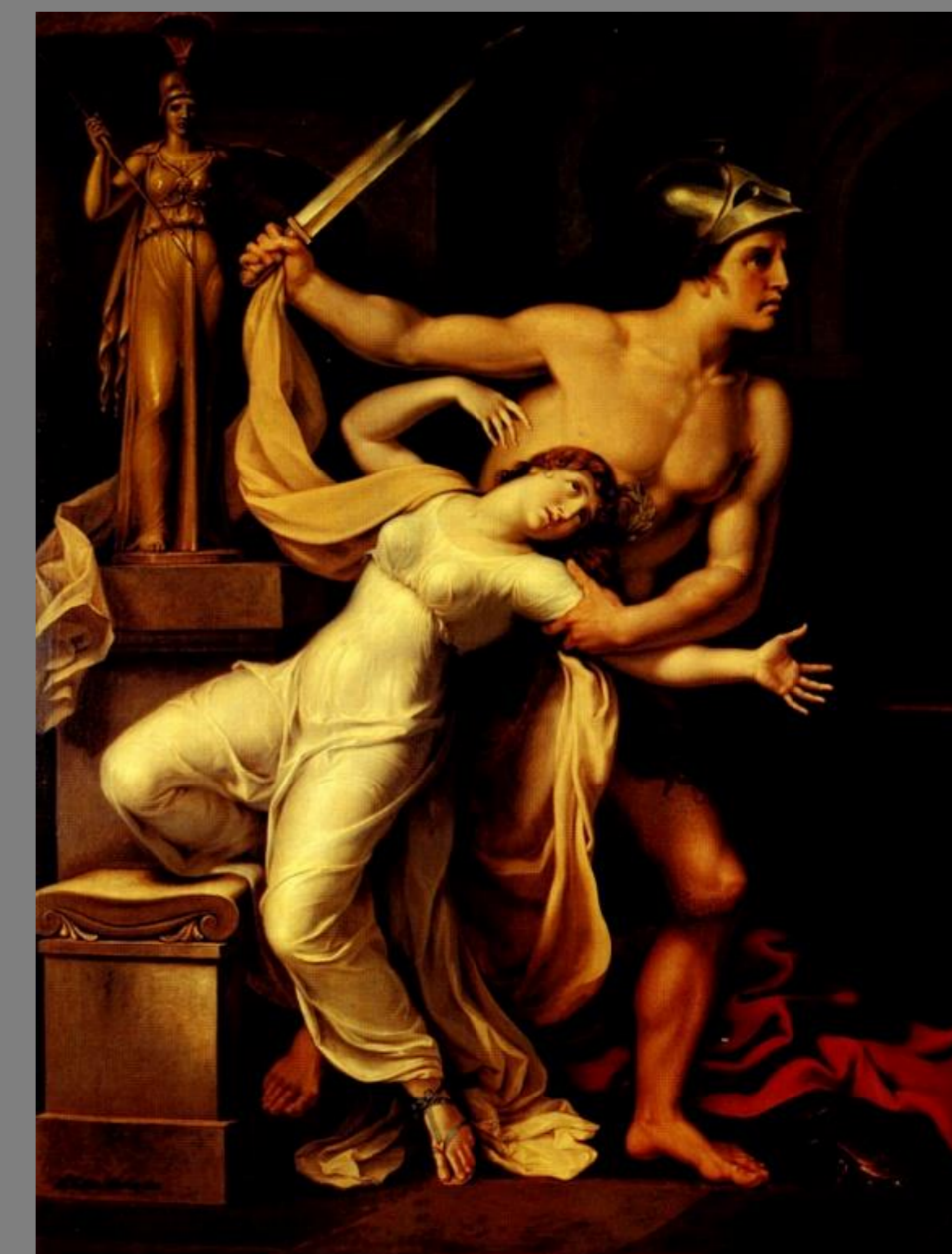
Cassandra y Ajax Johann Heinrich Wilhelm Tischbein (1806) Grossherzogliches Schloss