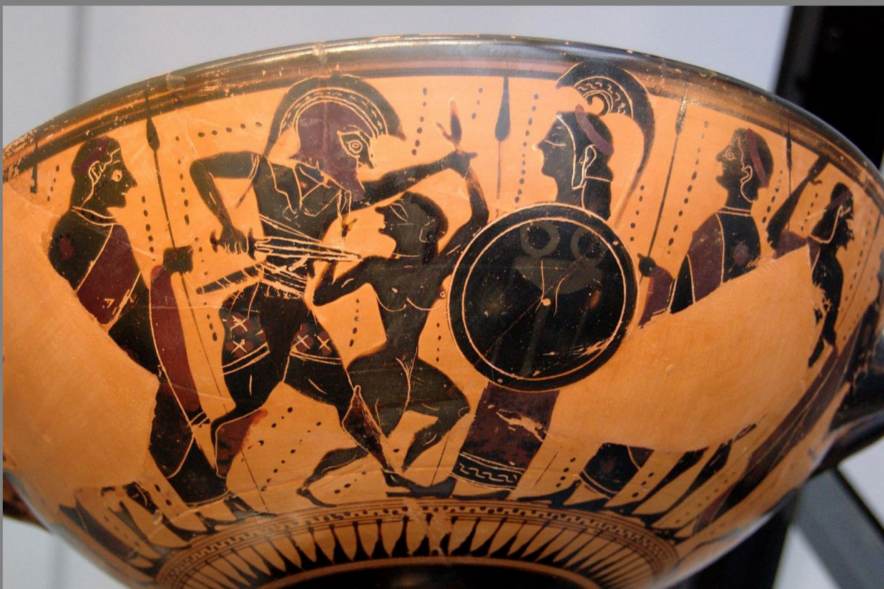
550 a. C. Staatliche Antikensammlungen