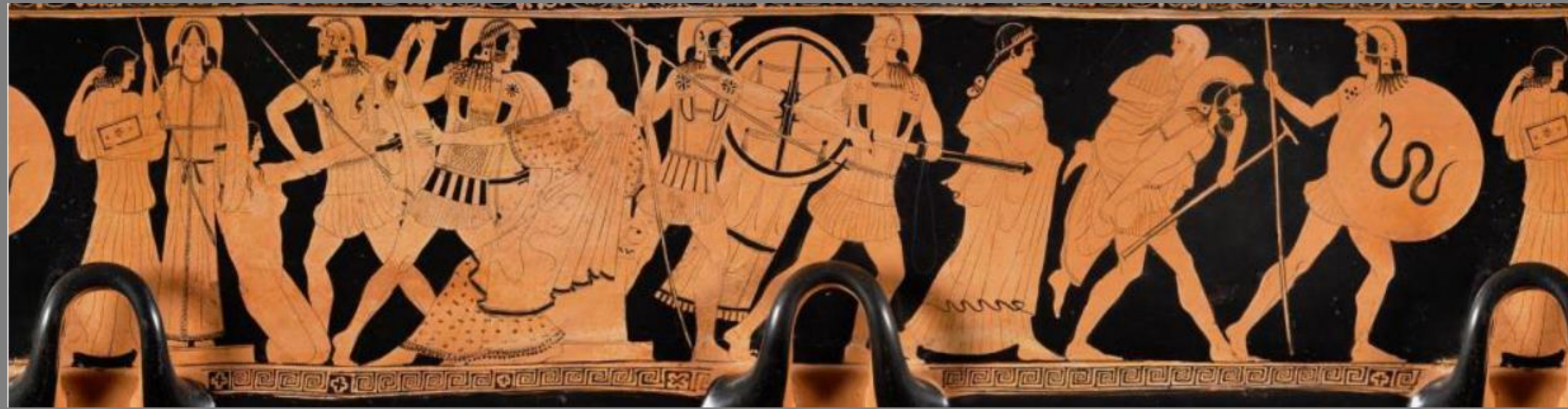
470 a. C. Museum of Fine Arts of Boston