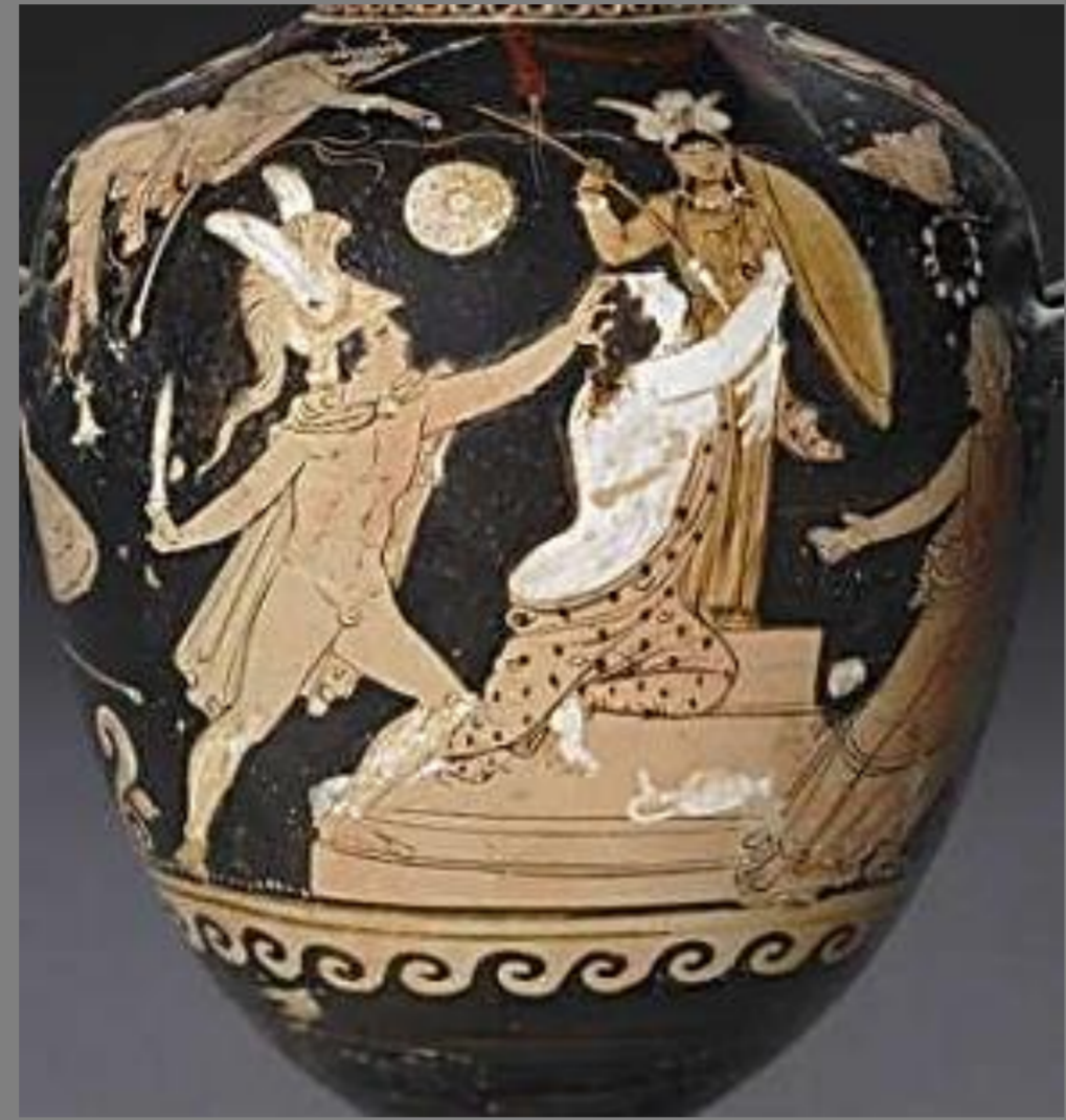
340-320 a.C. British Museum