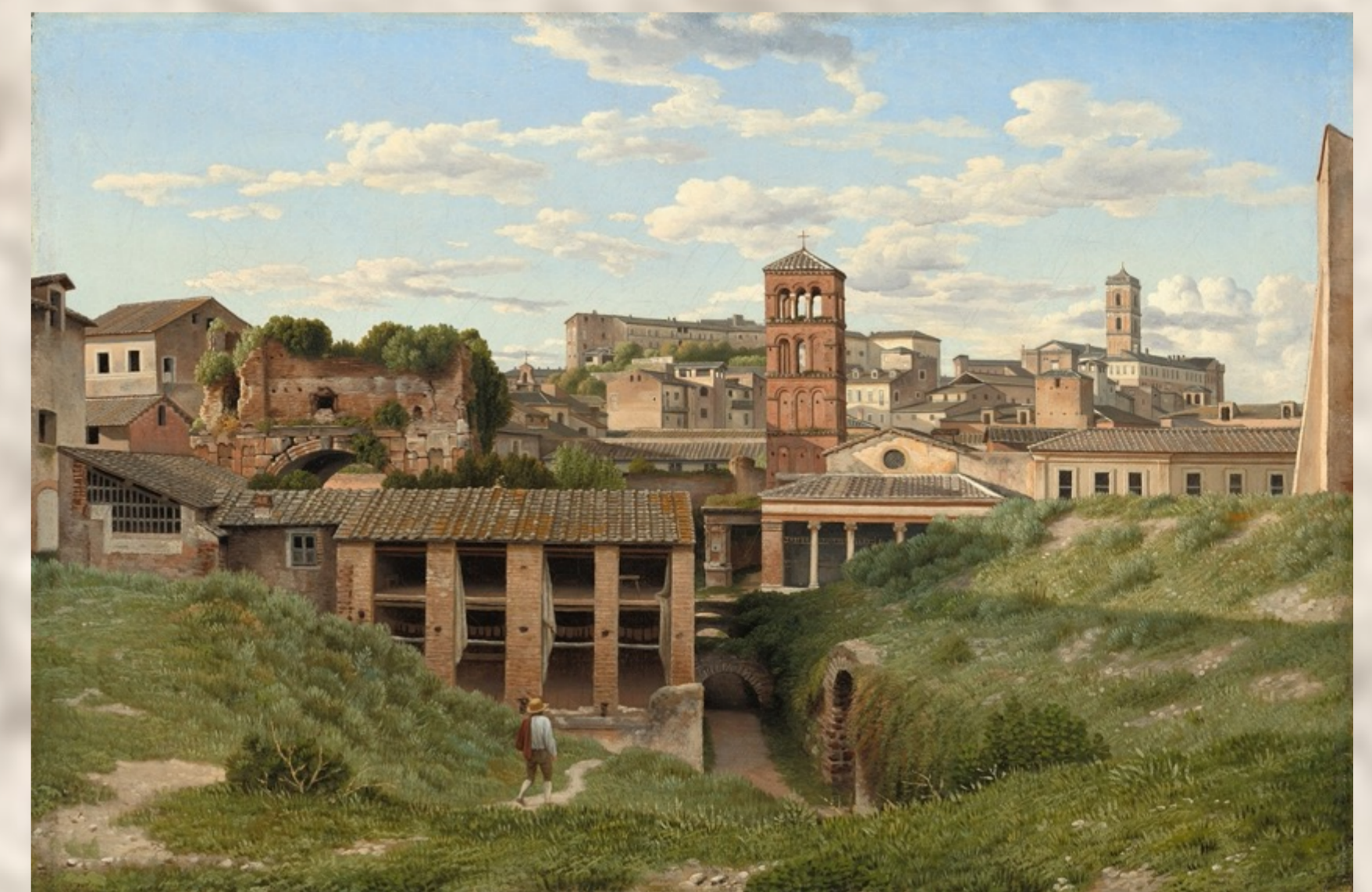
Velabrum, Christoffer Wilhelm Eckersberg (1814).