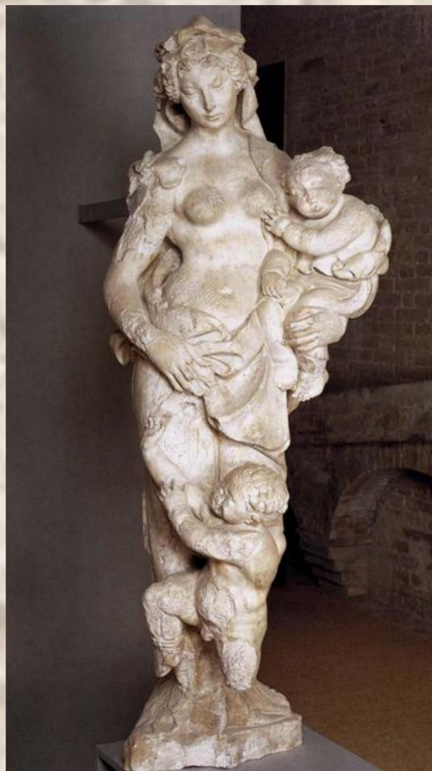
Aca Larentia, Jacopo della Quercia (1414). Palazzo Pubblico, Siena.

Pero Aca Larentia ofrecía públicamente su cuerpo y había ganado abundante dinero con ese menester. Según está escrito en la Historia de Antias , en su testamento ella hizo heredero de sus bienes al rey Rómulo; mas según nos han transmitido algunos otros, al pueblo romano. Por ese mérito, el flamen de Quirino celebra en su honor un sacrificio, y se añadió a los Fastos un día en nombre de ella. Pero en el libro primero de las “ Cosas Memorables ”, Masurio Sabino dice, siguiendo a algunos escritores de historia, que Aca Larentia fue la nodriza de Rómulo Aulo Gelio, Noches áticas , VII,5