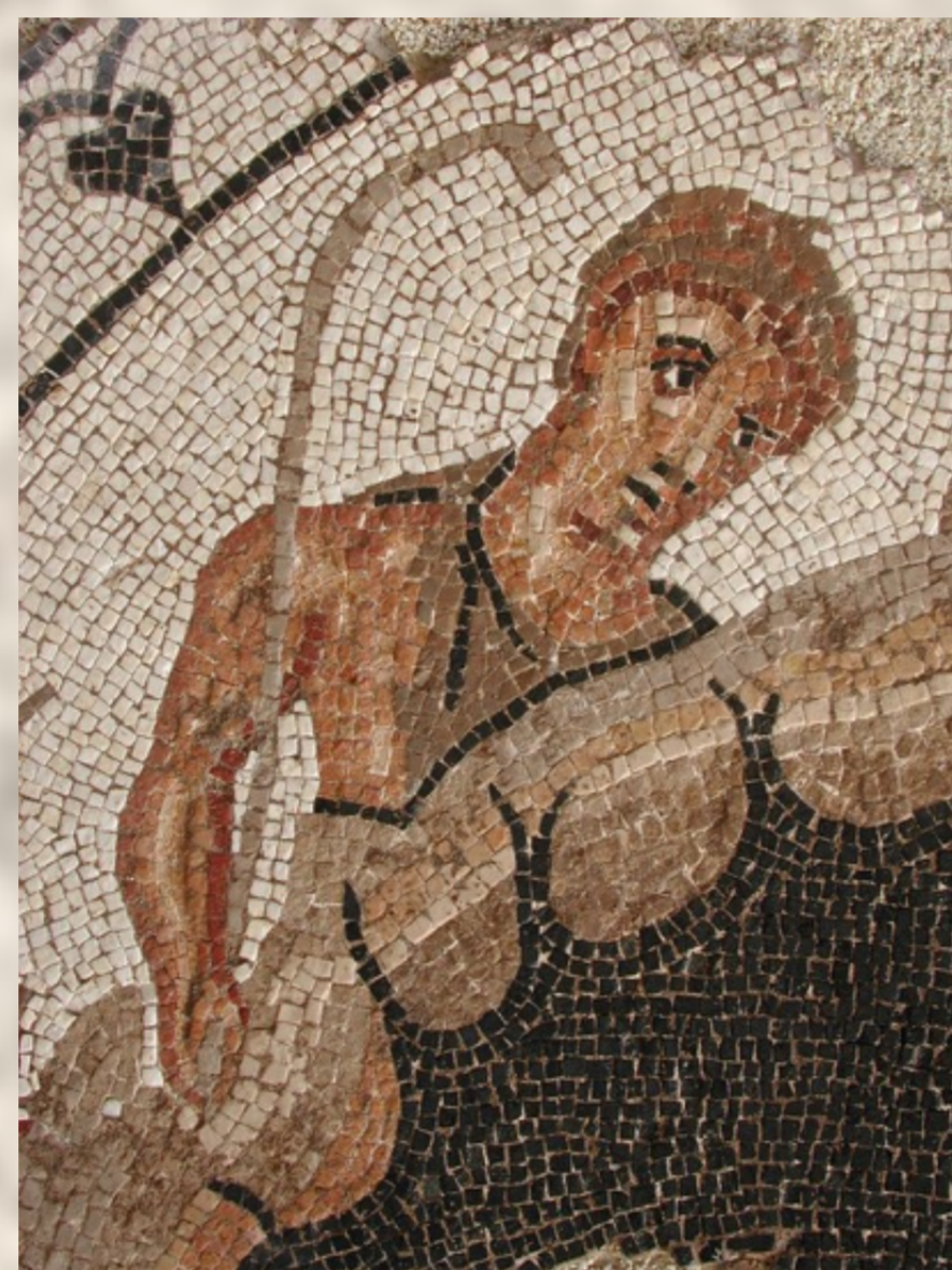
Fáustulo representado en el mosaico de Font de Mussa, conservado en el Museo de Prehistoria de Valencia.

Fáustulo, hombre bondadoso y caritativo, es el pastor que recogió en las orillas del Tíber a los gemelos Rómulo y Remo y los confió a su esposa, Aca Larentia, para que los criase. Cuando se produjo la lucha fratricida, murió al intentar interponerse. Lo enterraron en el Foro, y más tarde erigieron sobre su tumba una estatua de un león.