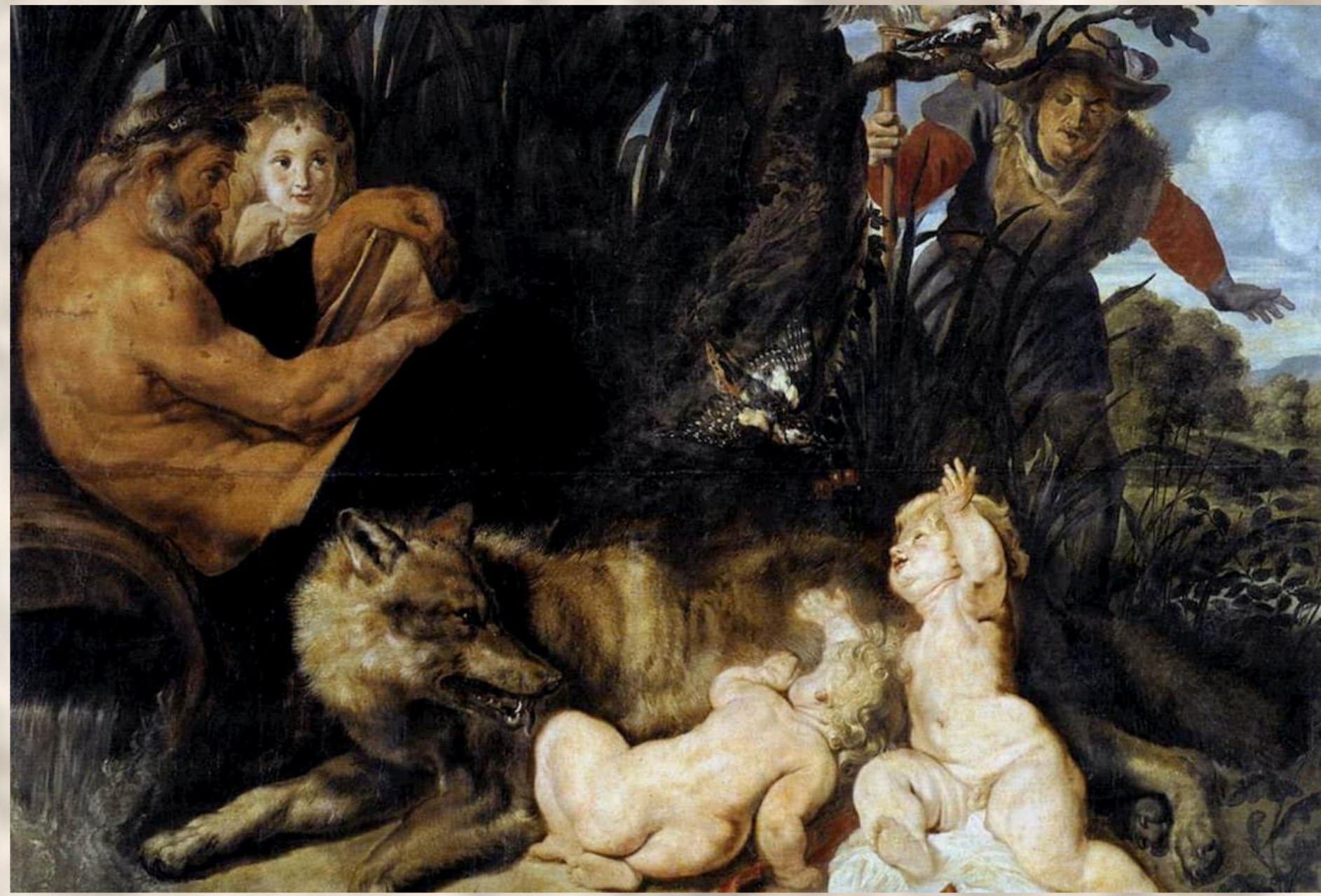
Rómulo y Remo, Rubens (1615). Museos Capitolinos, Roma.

Según la leyenda, Rómulo y Remo, los fundadores de Roma, fueron criados por una loba. Tras su nacimiento fueron abandonados en el río Tíber, donde la corriente los desplazó hasta el Velabro, un valle situado entre las colinas del Capitolio y del Palatino. En este lugar los rescató y alimentó la loba hasta que fueron encontrados por un pastor, Fáustulo, que los llevó a su hogar para ser criados por su mujer, Aca Larentia –hay quienes han querido ver en esta mujer la personificación de la legendaria loba–. En latín el término acca no tiene significado, si bien en sánscrito significa madre. Aca Larentia podría hacer referencia a la madre de los lares o de los antepasados –Aca Larentia sería una especie de Diosa Madre representada bajo la apariencia de una loba.