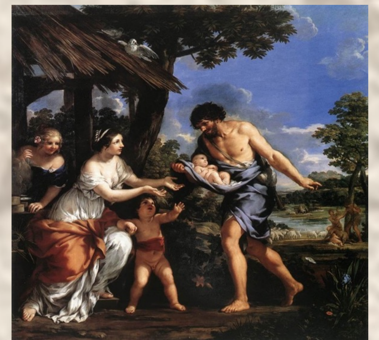
Rómulo y Remo, Pietro da Cortona (1634). Museo del Louvre, París.