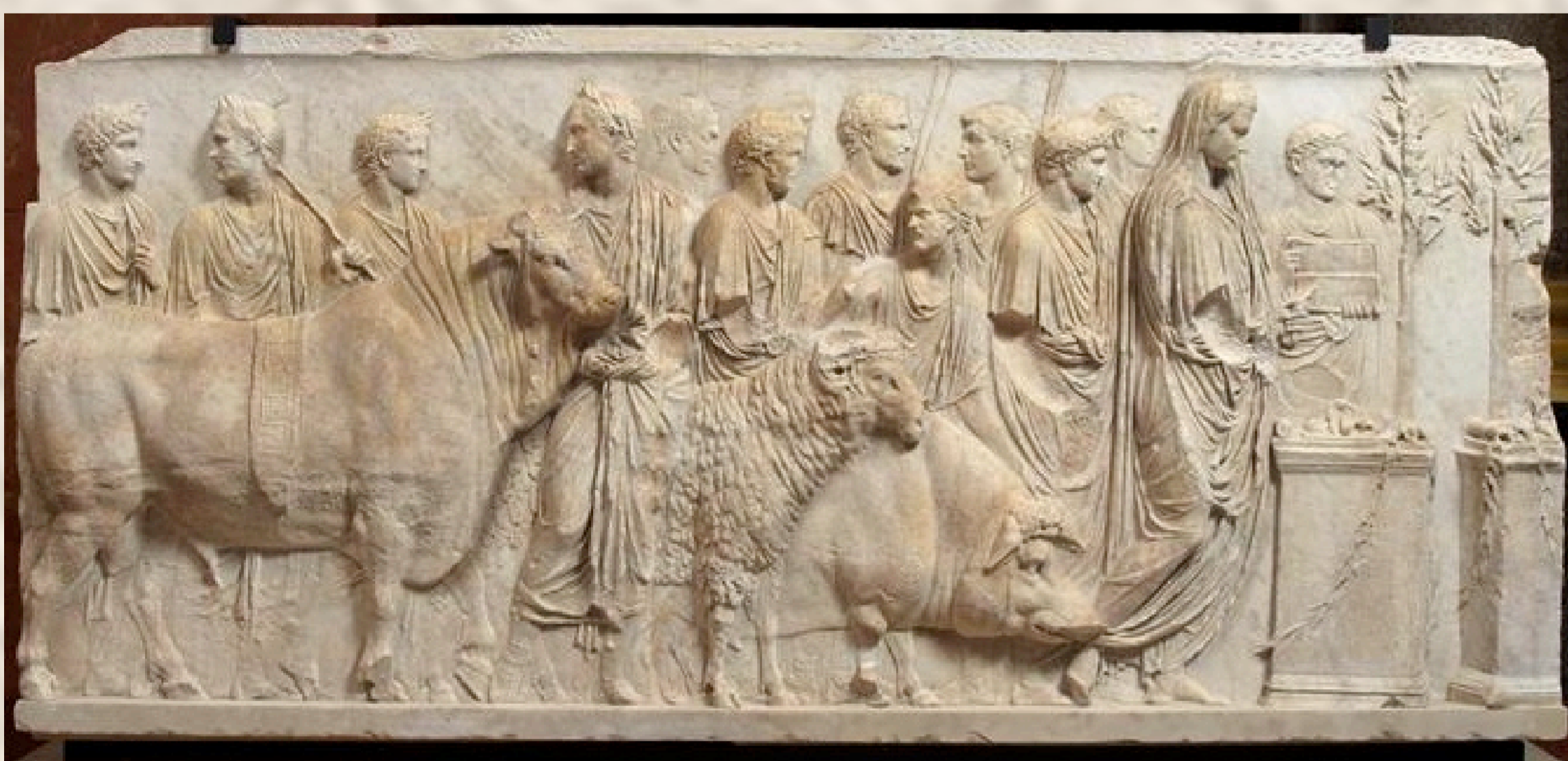
Ambarvalia. Museos del Louvre, París.

Los Fratres Arvales fueron una cofradía sacerdotal integrada en sus orígenes (s. VIII a.C.) por doce flámenes consagrados al culto de Dea Dia , divinidad romana protectora de la agricultura y las cosechas, más tarde identificada con Ceres.