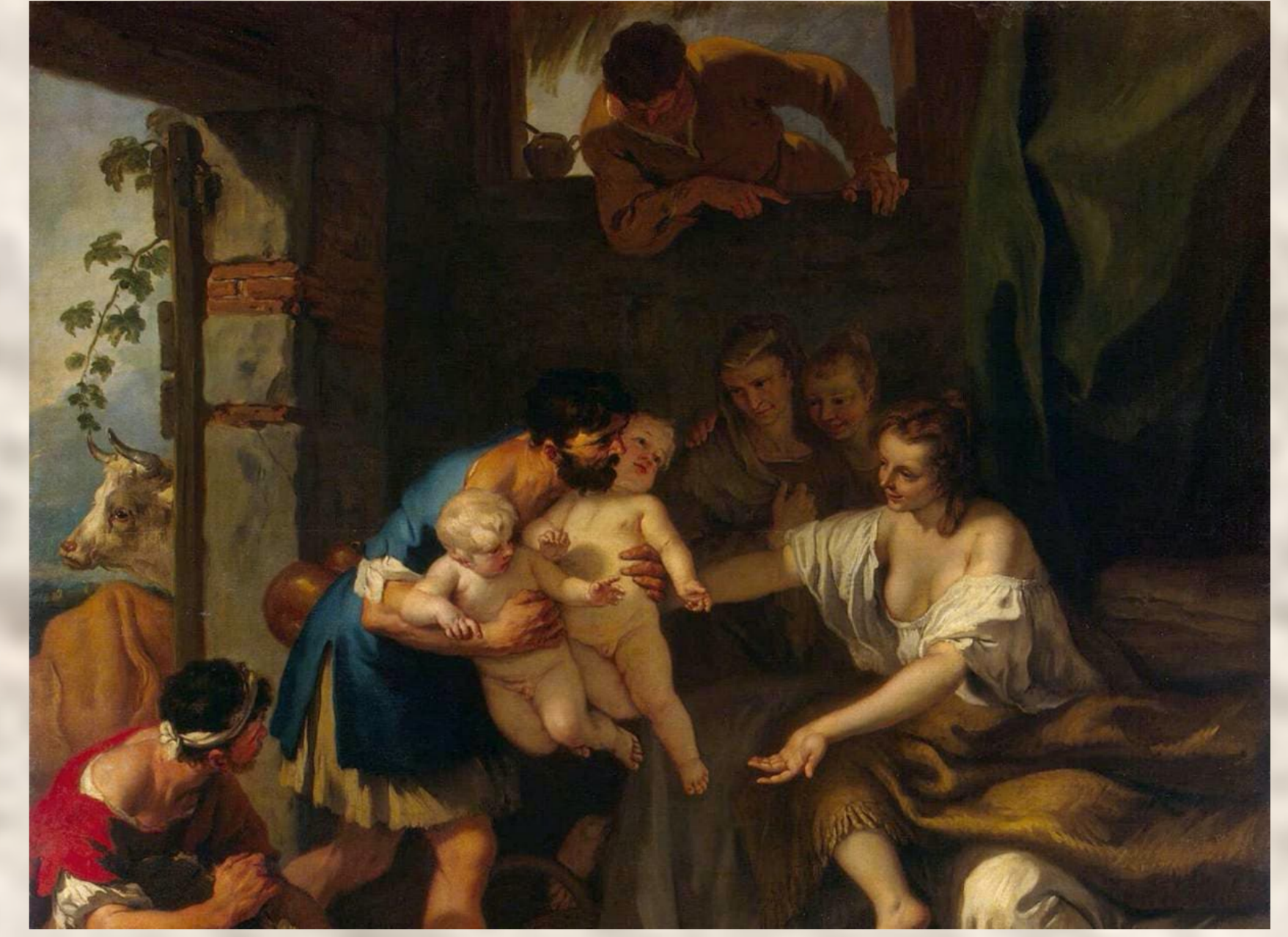
Fáustulo entregando a Rómulo y Remo a Aca Larentia, Sebastiano Ricci (1708). Museo del Hermitage, San Petersburgo.

Fáustulo, hombre bondadoso y caritativo, es el pastor que recogió en las orillas del Tíber a los gemelos Rómulo y Remo y los confió a su esposa, Aca Larentia, para que los criase. Cuando se produjo la lucha fratricida, murió al intentar interponerse. Lo enterraron en el Foro, y más tarde erigieron sobre su tumba una estatua de un león.