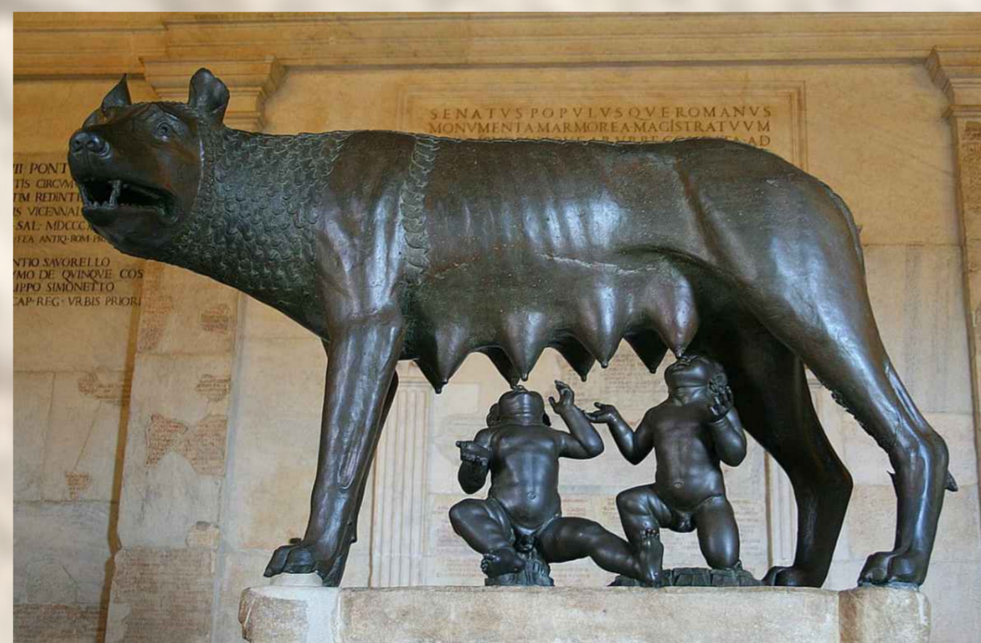
Lupercal. Museos Capitolinos, Roma.