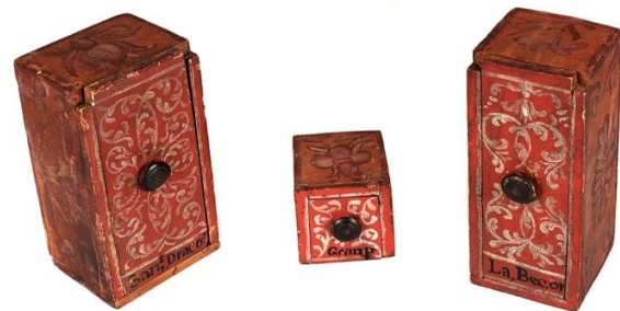
Cajoncillos de madera policromada para guardar simples medicinales: sangre de dragón, granates y piedra bezoar. Pertenecen a una farmacia de viaje del siglo XVII que se conserva en el Museo de la Farmacia Hispánica. Facultad de Farmacia, Universidad Complutense de Madrid.

El Museo de la Farmacia Hispánica les desea Feliz Navidad y próspero Año Nuevo 2025