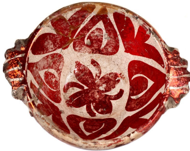
Sangradera. Siglo XVIII. Cerámica de reflejo dorado. Museo de la Farmacia Hispana. MFH 358.