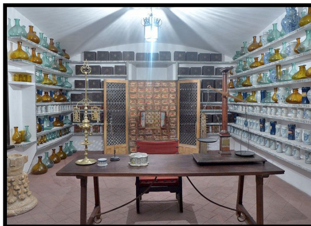
Comparativa entre la botica original del siglo XVII ubicada en el Hospital Tavera de Toledo (izquierda) y la reproducción del Museo de la Farmacia Hispana (derecha)