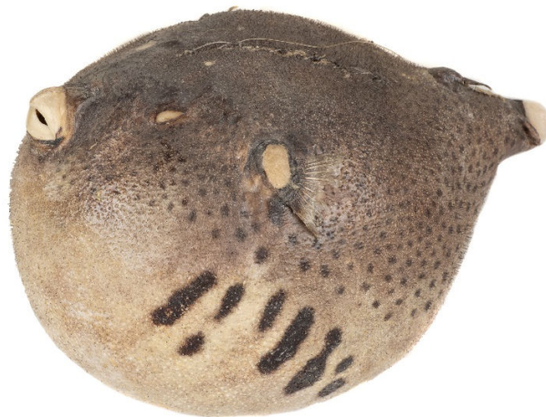
Pez globo. Siglo XX. 15 x 11,5 cm Museo de la Farmacia Hispana. MFH 8497.