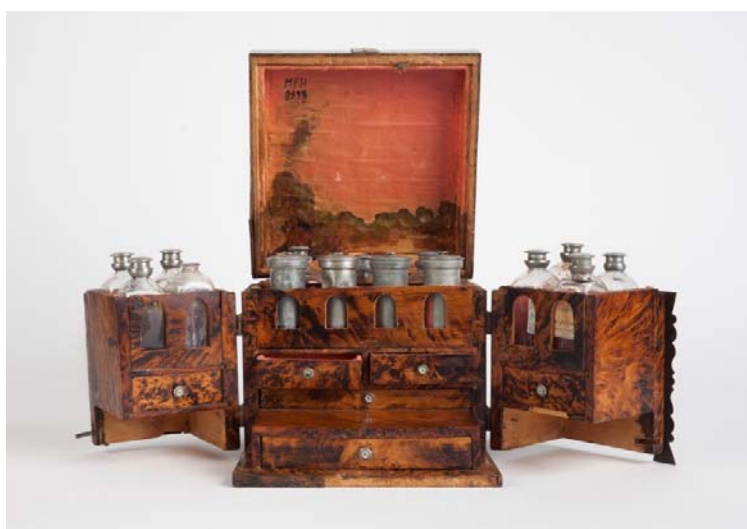
Botiquín de viaje. Siglo XVIII.