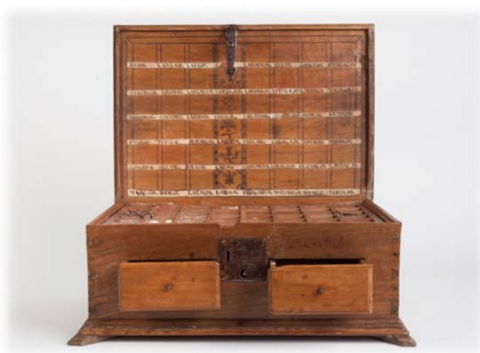
Farmacia de viaje del siglo XVIII.