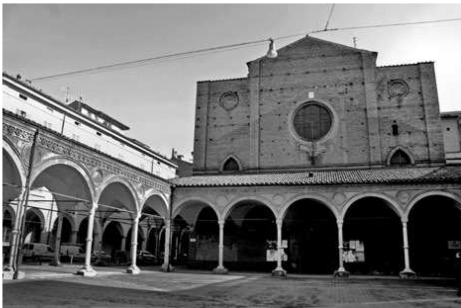
Fig. 1. Bologna, Convento dei Servi di Maria, prospetto della chiesa, stato attuale.