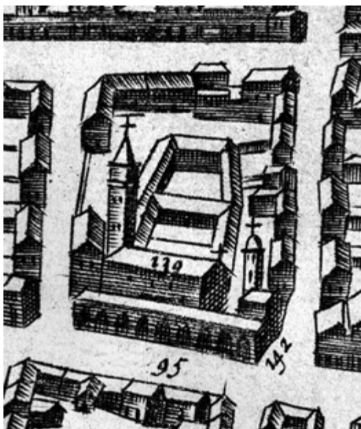
Fig. 2. Matteo Florimi, Bologna , fine XVI sec., incisione, particolare: convento dei Servi di Maria (Bologna, Biblioteca comunale dell'Archiginnasio, Gabinetto disegni e stampe, Raccolta piante e vedute della città di Bologna , cartella 1, n. 7).