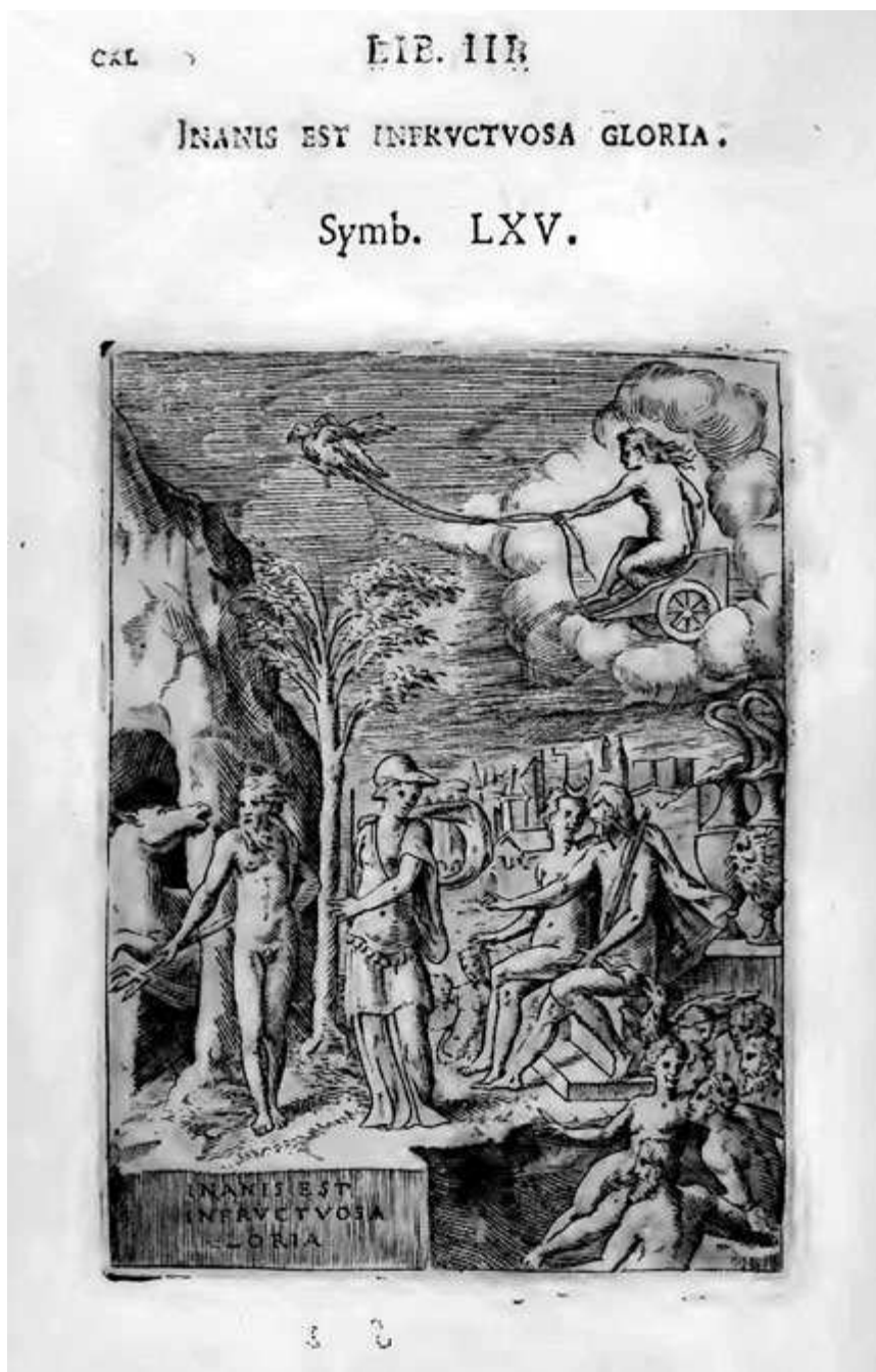
Fig. 5. Giulio Bonasone, «Inanis est infructuosa gloria», 1555, incisione (da Bocchi 1574, simb. LXV, p. CVL).