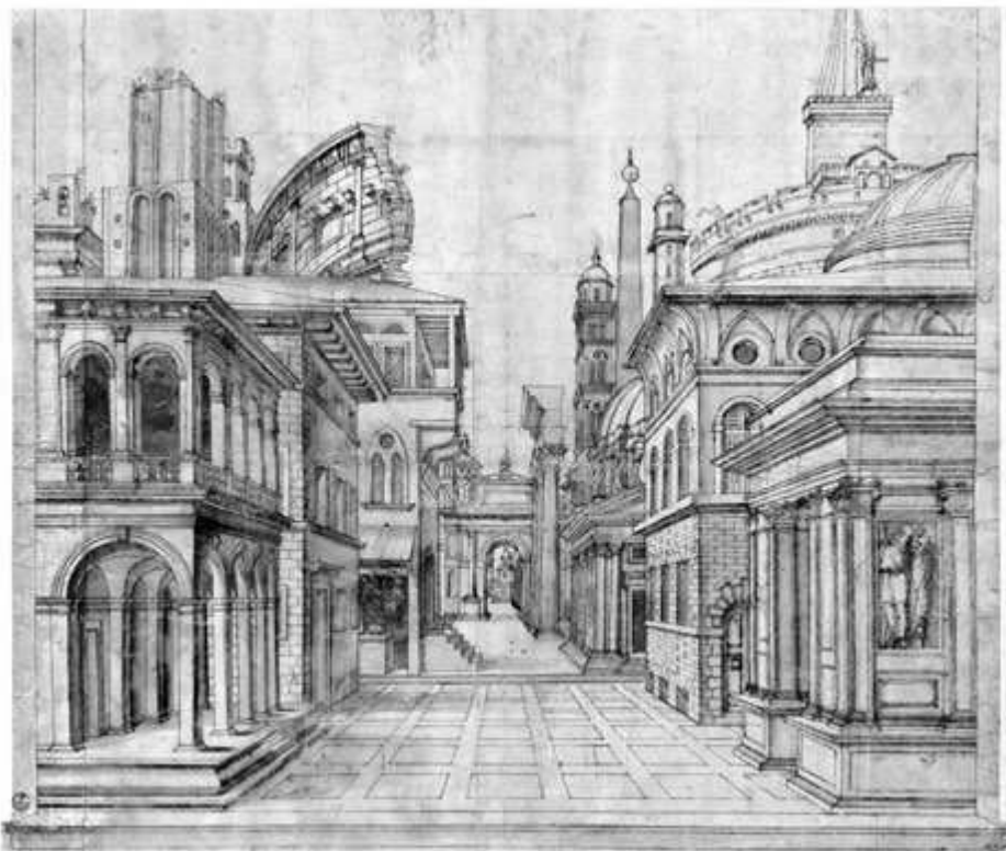
Fig. 4. Giorgio Vasari (?), Scena teatrale, 1542 (?), disegno (Firenze, Gabinetto disegni e stampe degli Uffizi, inv. 291 A).