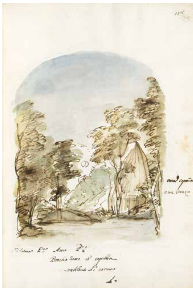
4-5. Filippo Juvarra, diseños teatrales con el tema del paisaje prioritario (1708-1712). Londres, Victoria and Albert Museum.