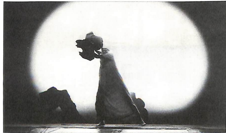
“La buena persona de Sezuán”, espectáculo dirigido por Giorgio Strehler a partir de la obra de B. Brecht. Escenografía: Luciano Damiani. Piccolo Teatro de Milán. (Temp. 1957-58).