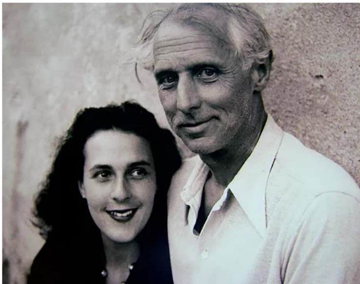
Leonora Carrington y Max Ernst en Saint-Martin d'Ardèche en el verano de 1939.