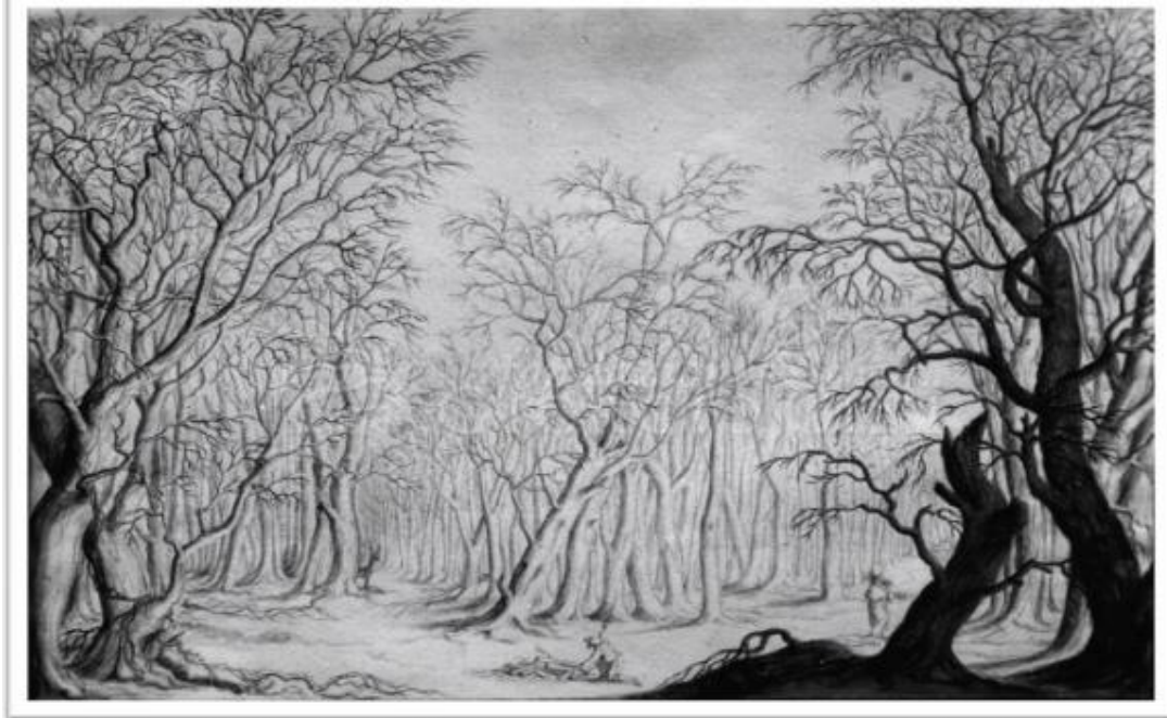
Lodovico Ottavio Burnacini, Bozzetto di bosco . Fondo Elena Povoledo. Fondazione Giorgio Cini. Tenebrismo escenográfico. Siglo XVII.