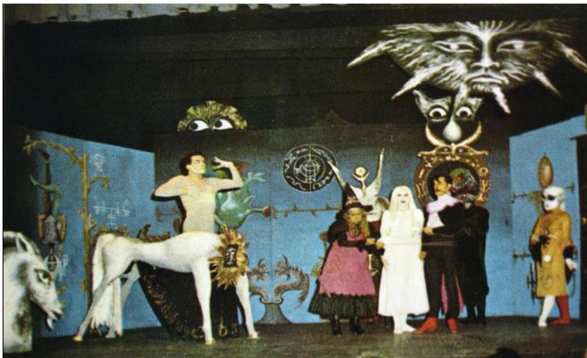
Representación de Penélope , 1960.

El caballo como alter ego de un mundo adverso, representación de la sabiduría en su versión de centauro -como el mitológico Quirón, preceptor de Aquiles-, al tiempo prefiguración de la naturaleza salvaje y racional, inherente a todo ser humano. Representación en una misma iconografía del enfrentamiento entre lo dionisiaco y lo apolíneo, presente con acentuada fiereza en la figura del artista en general y de algunos en particular, con especial preeminencia del espíritu expresivo e indomable, como lo fue Leonora, con la separación definitiva de Ernst y su exilio ultramarino hasta su asentamiento definitivo en México, país en el que murió ya octogenaria.