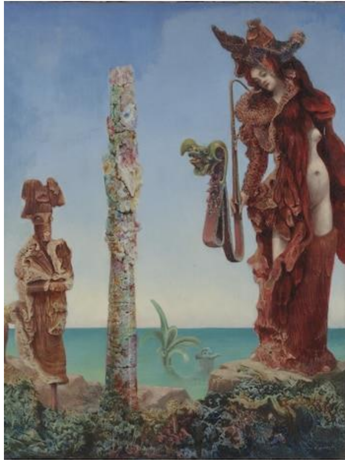
Napoleón en el desierto (1941) de Max Ernst

Todo ese imaginario de su itinerario vital y ya evidenciado de forma temprana se reconoce en los personajes de la composición escenográfica proyectada en el montaje de la obra Penélope , posteriormente dirigida por el artista chileno Alejandro Jodorowsky en el año de 1961 en México. Un catálogo completo de personajes recurrentes a lo largo de su obra, representados sobre un escenario, envolvente y evasivo, liberado de las directrices de la ventana albertiana renacentista, que surcan primeros planos y fondo, coexistiendo a varios niveles, alejados de las estrictas normas cartesianas de la verosimilitud impuesta por el uso de la perspectiva científica aplicada a la escenografía, rompiendo igualmente los preceptos de los géneros dramáticos, codificados desde el siglo XVI, en los grabados serlianos.