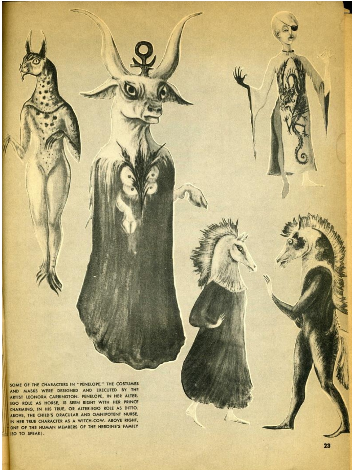
Diseños de Carrington para el montaje de Penélope en reseña de prensa.