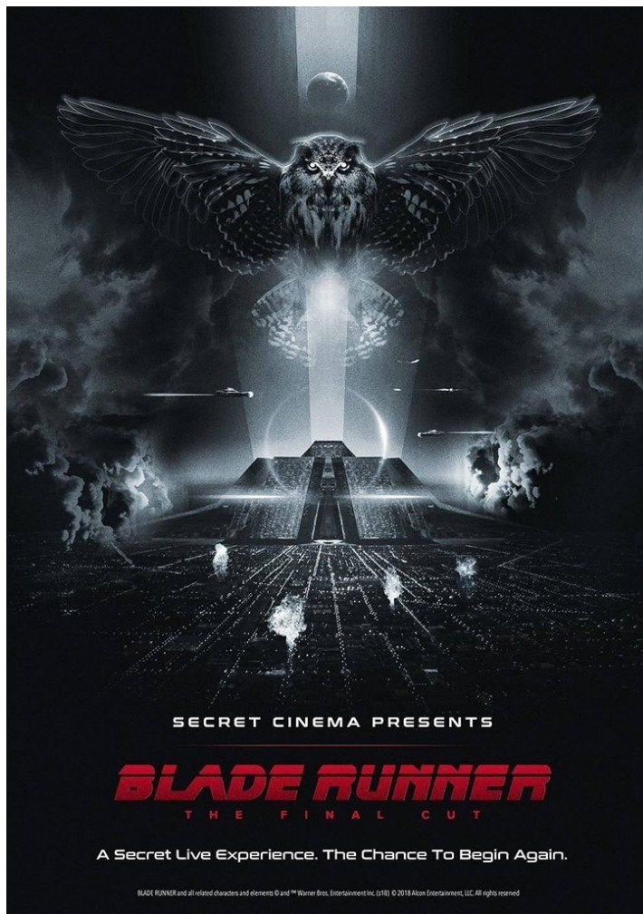
Fig. 5. Blade Runner , Ridley Scott, 1982. El texto de P.K. Dick, ¿Sueñan los androides con ovejas eléctricas? , fue el punto de partida de la creación fantasmagórica de espacios influenciados por la mastaba egipcia, por las pirámides precolombinas, por los laberintos sombríos de Piranesi y por los poemas arquitectónicos de los visionarios franceses de finales del siglo XVIII. Los símbolos de la Noche y de

Lloyd Wright, geométrica y de rugosa textura, aséptica y cálida a la vez. Ciudad cósmica, sagrada y profana, reflejo de las reflexiones de la Antigüedad clásica, en la que se reconoce el mito de Aracne y los relatos del laberinto del Minotauro y Ariadna.