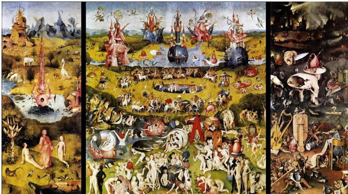
Fig. 8. El jardín de las Delicias de El Bosco ha sido mencionado por el director de Blade Runner , lienzo esencial para su proceso creativo que, sin duda, ha marcado el viaje de la oscuridad a la luz, de la luz a las sombras que rememoran la sempiterna presencia de la alegoría de la caverna de

Una formulación visionaria llevada al delirio surrealista con claro paralelismo en obras del Bosco, como el Jardín de las Delicias, con presencia y alusión a los Elementos inherentes a la Naturaleza, a la creación cosmológica. Visión laberíntica también perceptible en la Villa (1962) de Jean Claude Bernard, igualmente con reminiscencias de las utopías ilustradas, como las de Boullé y Ledoux, con sus edificios individualizados y aislados, aun formando parte de una dimensión unitaria, con osatura básica de horizontales y verticales, entremezcladas de nervatura cóncava y convexa y concatenación rítmica de espacios abiertos y cerrados, luego tan presentes tanto en la arquitectura alemana contemporánea y en la danza como su reflejo.