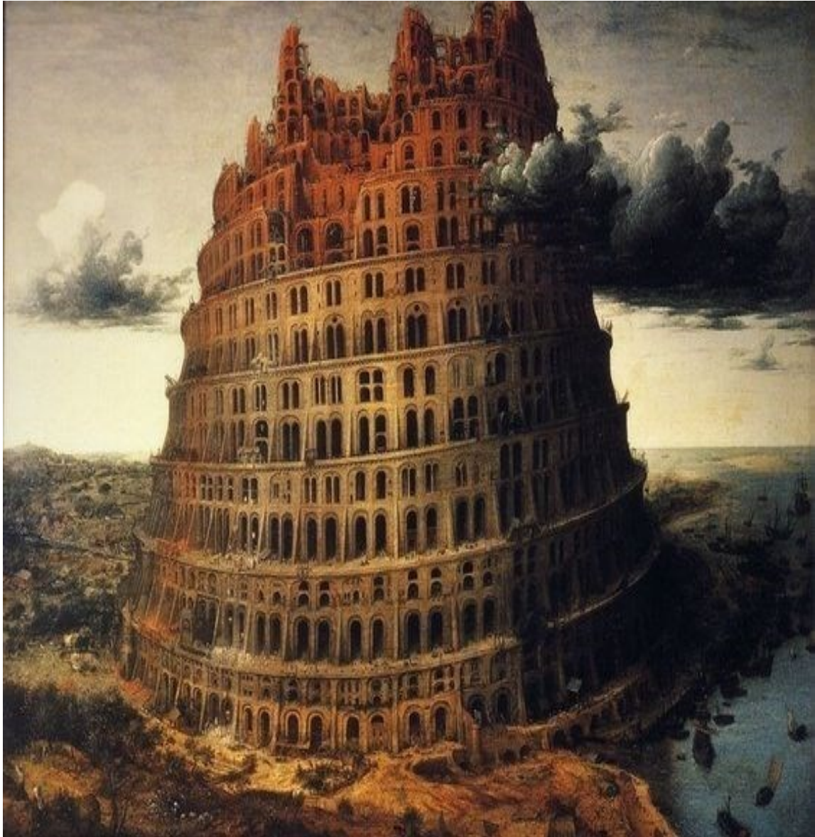
Fig. 1. La Torre de Babel , Pieter Bruegel. Imagen desdoblada en dos colores, se trata, retomando a Sorte y a Lomazzo, de un paisaje septentrional, de incendio y nocturno, pero sin fuego; Babel es una construcción interpretada en el Humanismo cristiano y pagano, emblema ensalzado por el misticismo para reconstruir el camino simbólico ascendente. Mole arquitectónica representada en la arquitectura alemana de