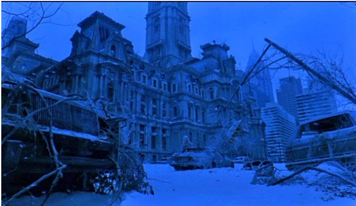
Fig. 9. Imagen de 12 Monos oníricas que se interpretan como una Nueva Troya, la arquitectura ultramundana, utópica y acristalada, conformada desde la premonición y los recuerdos. La capacidad de percepción de los adivinos permite abordar el significado de los espacios en ruinas, abandonados, repletos de diagonales que invocan a Eisenstein y a Orson Welles; desde un montaje alegórico, los monos sagrados se

Ficción dentro de la ficción, evocando y elogiando la película Vértigo de Hitchcock, donde se recuerdan los árboles y bosques, se establecen analogías y símiles entre los protagonistas de Vértigo-12 Monos para mostrar sendas propuestas visionarias y tenebristas, en relación con otros relatos no menos dramáticos de la mitología clásica, como las vicisitudes de Orfeo y de Eurídice. Casandra está muy presente en la ciencia ficción desde los orígenes, planteada su profética historia, buscando la misma estupefacción basada en lo irreparable que aventuraba la caída de Troya y con ello del mundo y la civilización del Bronce tardío, La gran ciudad de 12 Monos es, en parte, Troya .