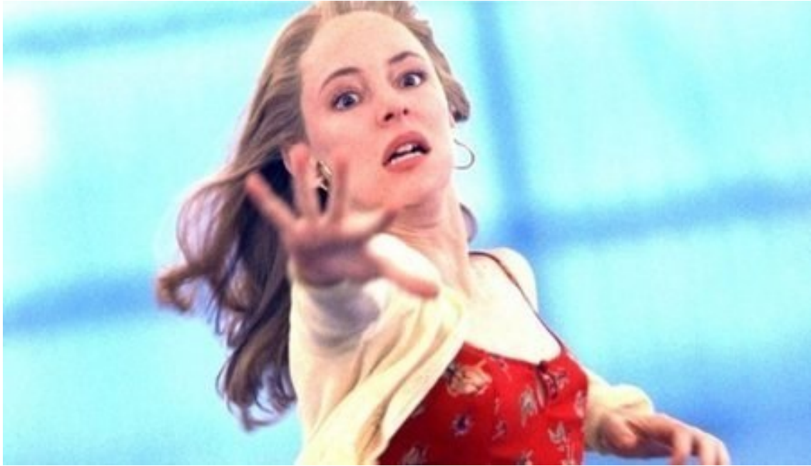
Fig. 10. 12 monos , Terry Gilliam. Viajar en el tiempo, revivir el mito del caballo de Troya, descubrir el Sueño dentro del Sueño inmenso en un Recuerdo. Gilliam nos pregunta por el Ilusionismo y nos adentra en un viaje por la literatura de Cervantes. ¿Qué es real?