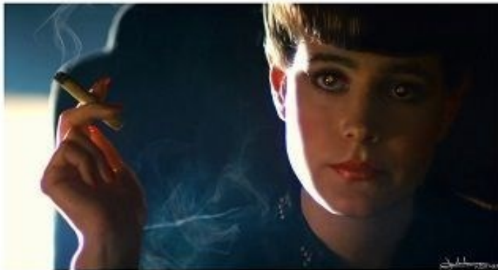
Fig. 6. Blade Runner . Rachel (Sean Young) es una replicante del modelo Nexus, que se convierte en una vital antagonista, dual y andrógina, se convierte en Aracne, la desafiante e insolente tejedora que sueña con

enfrentarse a Atenea, un mito revelado en Aliens . La diosa de las Armas y de las Letras, representada en la arquitectura y, unida a Santa Bárbara, definen los contrarios de Judith y de Saturno en las Pinturas Negras de Goya.