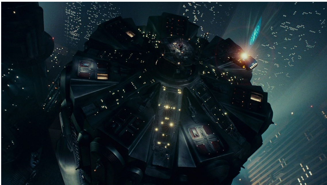
Fig. 7. Blade Runner . Torre mítica que remite a la gran torre de Babel, mole que se define con el baluarte de la tradición alemana que, según el razonamiento de Marcello Fagiolo, lleva a la iconografía de santa Bárbara en arte flamenco del siglo XV. Girar en el más allá, moverse como los planetas y la estrellas, como los espectáculos analizados por la profesora Esther Merino sobre la semiótica de la armonía de las esferas.

enfrentarse a Atenea, un mito revelado en Aliens . La diosa de las Armas y de las Letras, representada en la arquitectura y, unida a Santa Bárbara, definen los contrarios de Judith y de Saturno en las Pinturas Negras de Goya.