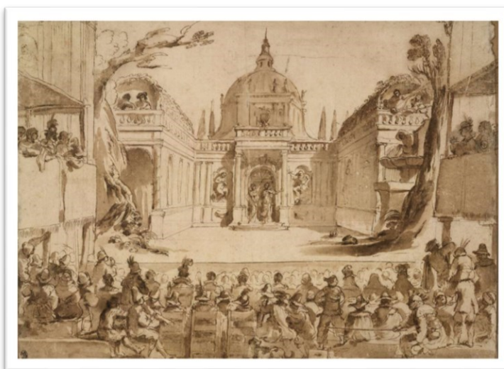
Fig.2. G. F. Barbieri (1591-1666) Il Guercino, Una scena teatrale all'aperto vista dall'uditorio , The