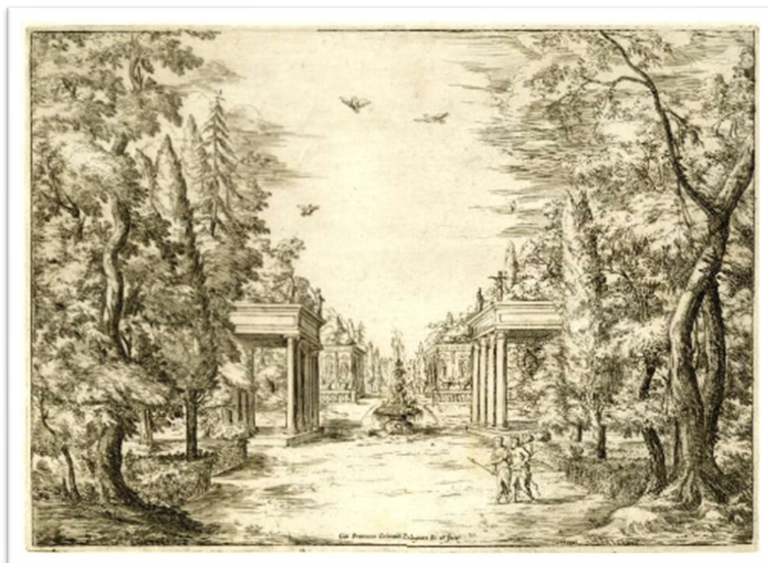
Fig. 3. G. Fco. Grimaldi, Hércules y Iole en un jardín, La sincerità trionfante , 1639. The British Museum.

Galestruzzi casi con toda seguridad era florentino según la enciclopedia Treccani 4 y al parecer comenzó su carrera como pintor, llegando a ser igualmente miembro de la Academia de San Luca en Roma, trabajando en la órbita de Annibale Carracci y donde desarrolló una extensa trayectoria como grabador, entre otras de los frescos de Polidoro da Caravaggio, una de cuyas reediciones de la obra fueron publicadas por Arnold van Westerhout, el mismo que realizó las estampas de Il greco in Troia 5 de Giacompo Chiavistelli (1621-1698), para las celebraciones con ocasión del matrimonio de Ferdinando III de Medici y Violante de Baviera, en 1688, con lo cual conectaría con el ámbito escenográfico florentino de la sucesión de figuras que formalizaron la profesión del escenógrafo y el estilo depurado de una ortodoxia clasicista, desde Giulio Parigi, pasando por sus herederos Alfonso Parigi il Giovane (1606-1656) Ferdinando Tacca (1619-1686) y los grabadores de buena parte los espectáculos cuyas decoraciones ellos idearon, como fueron Jacques Callot (1592-1635) y Stefano della Bella (1604-1656), a quien es más que probable que conociera personalmente y de quien muestra una evidente cercanía estilística.