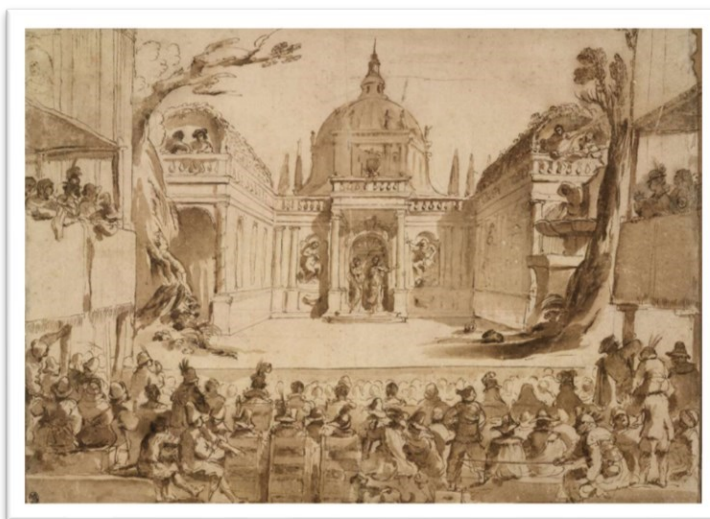
Fig.2. G. F. Barbieri (1591-1666) Il Guercino, Una scena teatrale all'aperto vista dall'uditorio , The