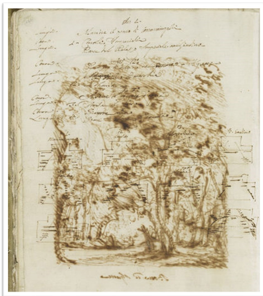
Fig. 1. Filippo Juvarra, Diseño Teatral (17081712).

Con numerosas anotaciones que se pueden considerar como estudios preparatorios de los grabados definitivos para el montaje final de Il Ciro , Victoria & Albert Museum.