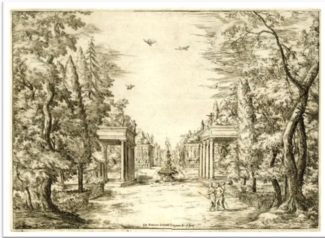
Fig. 3. G. Fco. Grimaldi, Hércules y Iole en un jardín, La sincerità trionfante , 1639. The British Museum.

ad hoc , que ya se estaba larvando en los espectáculos romanos vinculados con la aristocracia pontificia, en torno a mediados del 1600, incluso antes de que falleciera la reina Cristina de Suecia, que había patrocinado muchos de ellos y en los cuales la Naturaleza empezaba a cobrar protagonismo hegemónico.