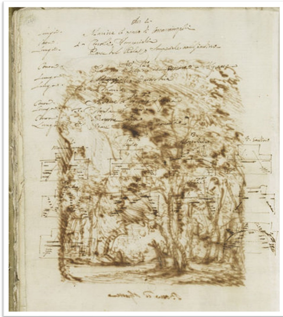
Fig. 1. Filippo Juvarra, Diseño Teatral (1708-1712).

At the end of the 17th century the signs of the Baroque Theatre prototypes tiredness began to be felt, coinciding with the introduction of the angular perspective of the Bibiena and other mutations, derived from a more pictorial conception, which ended up defining the new scenographic model of the 18th century, of the "scene-picture".