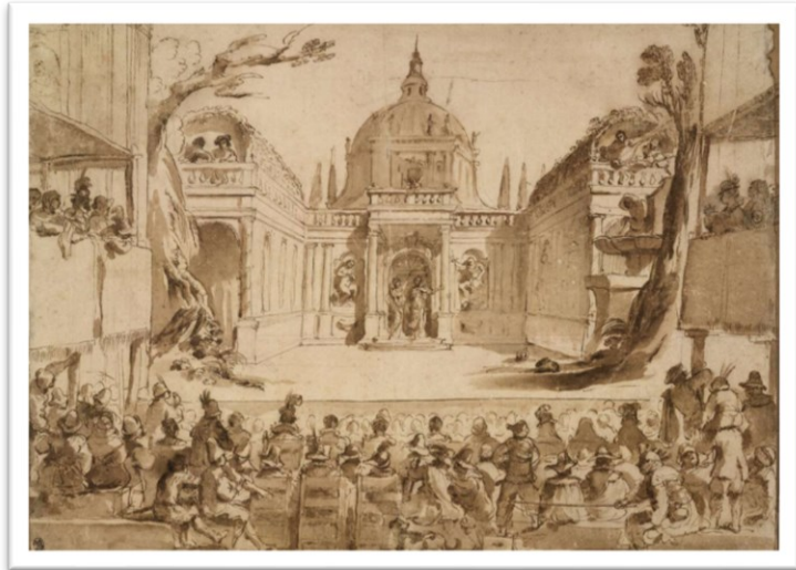
Fig.2. G. F. Barbieri (1591-1666) Il Guercino, Una scena teatrale all'aperto vista dall'uditorio , The