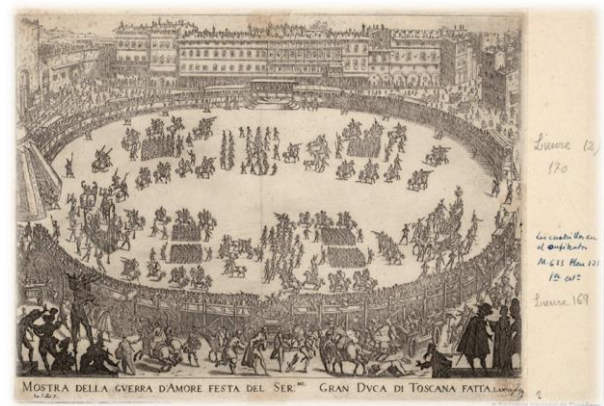
Fig. 5. Guerra de Amor . Febrero 1616. Torneo temático: Cosme II disputaba el torneo como rey de Narsinga por el favor de la reina Lucinda de la India, encarnada por (la Duquesa) María Magdalena. BNE. Texto de Salvadori, diseño escenográfico de Giulio Parigi y estampa de Jacques Callot.

preeminencia como dominador de los elementos naturales, entre ellos el terrestre. Se trataba, en definitiva, de la plasmación de la ideología del pensamiento áulico. Es evidente el carácter alegórico de la trama argumental en general, así como de cada uno de los personajes en particular y el escenógrafo trabajaba en colaboración directa con el autor especulativo de los textos también para la creación de los diseños de vestuario, como se deduce de las notas de la “Guardarroba medicea”, por ejemplo en el caso de representación del montaje de La regina Sant’Orsola de Jacopo Cicognini, en octubre de 1624, en las que consta que la Vanidad habría de llevar «una vesta di tocca di colore... L’ Inganno, una sopra vesta di Carcasso, La Sirena una vesta come si veste di sirena (lógicamente) et una nicchia argenttata piena di corali perle et altre gemme et una Cappliera lunga...per cinque furie con cinque habiti come si sogliono fare ad usanza di più per le vergini cappegliere et gioie e perle falsi...» 10 .