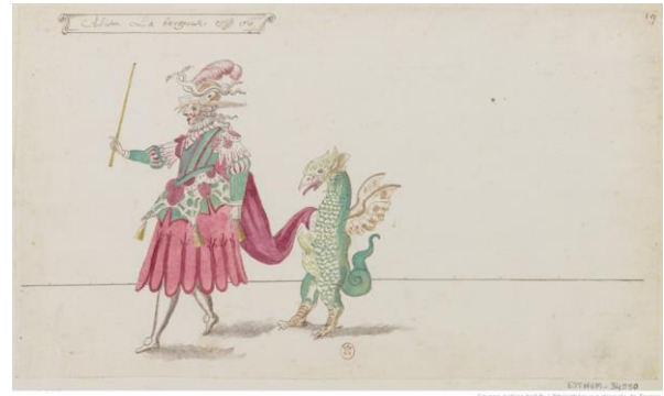
Fig. 19. Atelier de Daniel Rabel, Alison La hargneuse : dessin, 1625, Figura en el inventario como “Costume de danse Relancer la recherche sur ce sujet dans Gallica, Costumes -- 17e siècle Relancer la recherche sur ce sujet dans Gallica”, Gallica, BNF. https://gallica.bnf.fr/ark:/12148/btv1b10544016r/f1.item

En la indumentaria teatral de la época moderna se multiplicaron las alusiones a o referencias al mundo islámico. Se fue haciendo habitual como reflejo de la realidad histórica y social, en la que “El Moro” se erigió en alter ego del héroe de la literatura artúrica, fusionada en las historias de las Cruzadas a través de las hazañas en busca del Santo Grial. Posteriormente, se fueron insertando en los argumentos de los distintos espectáculos cortesanos, como representación de la cuota de participación de los distintos señores y príncipes en distintas batallas especialmente representativas en la lucha contra el Infiel a manera de recreaciones o crónicas de lo acaecido, como el caso de la “cruzada” saldada en la pírrica de Lepanto, en la que participaron los Medici, encargando a sus escenógrafos la inclusión de ese papel de enemigo tipológico en sus espectáculos con carácter propagandístico, ya desde los Intermezzi de finales del siglo XVI.