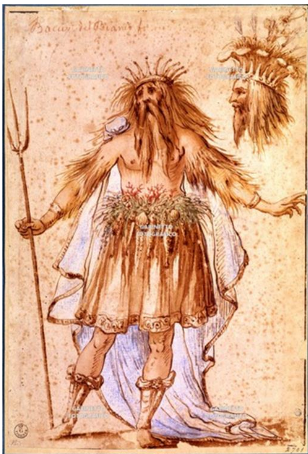
Fig. 23. Baccio del Bianco, Nettuno , costume per maschera, Opera 2701 / Gabinetto Disegni e Stampe – Santarelli, Gabinetto Disegni e Stampe, Uffizi, Florencia.

olímpico de la literatura homérica, con la figura del monarca absolutista.