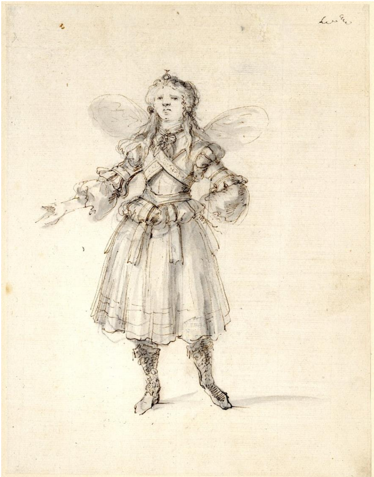
Fig. 15. Stefano della Bella, Diseño de traje de Ninfa para La Hípermestra de Cavalli, con diseño escenográfico de Ferdinando Tacca. British Museum.