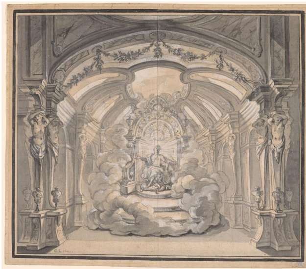
Fig. 22. Cosimo Lotti, Apolo entronizado , The Morgan Library. Procedente de la Colección Oenslager. Se suele mencionar como escenografía para la representación de La selva sin amor , de Lope de Vega, en 1627, en El Coliseo, si bien en la ficha del catálogo de la institución americana consta la inscripción CL 1641.

Francia Luis XIV. En ese contexto no menos interesante resulta la presencia de quien fuera sucesor de las tareas organizativas de los espectáculos en la corte española de Felipe IV, Baccio del Bianco, hijo de Cosimo del Bianco, en el ámbito de la Confraternità dell'Arcangelo Raffaello , conocida como De la Scala , con sede en la plaza de Santa Maria Novella , volcada en la educación moral de jóvenes que podrían así recrearse en una vida más edificantes “participando en la organización de virtuosas comedias, que deberían recitarse con el debido decoro” y así se constató la participación de Bianco junto a Lorenzo Lippi como “apparatori” o creadores del aparato escenográfico de Il trionfo di David , del mismo Cicognini.