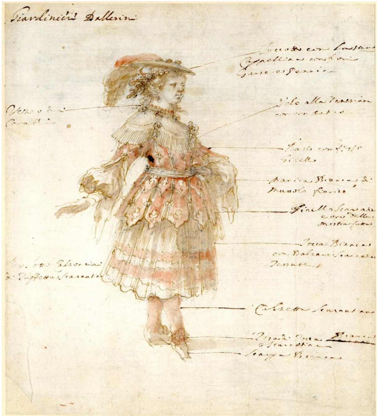
Fig.13. Stefano della Bella, Diseño de traje para La Hipermetra de Cavalli, con diseño escenográfico de Ferdinando Tacca. British Museum. Con exlibris: "Giardinieri Ballerini" and, at left, "Vezzo di / Coralli / Per Sotto Calzoncini / di Taffetta Scarnatina", with at right, "Zucotta con La sua / Cappellina con fiori / Garze e Pennini / Velo alla Veneziana / con oro Antico / Busto con frangie / Girello / Manica Bianca di / Mussolo fiorito / Girello Scarnatino / e oro della Mostrafatta / Tocca Bianca / con Balzane Scarnatine / Tessute / Cazetta Scarnatina / Rosa di Tocca Bianca / o Scarnatina / Scarpa Bianca"