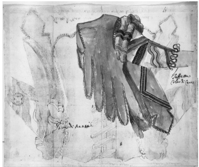
Fig. 10 y 11. Stefano della Bella, Diseño de chaqueta , recto y reverso. British Museum.