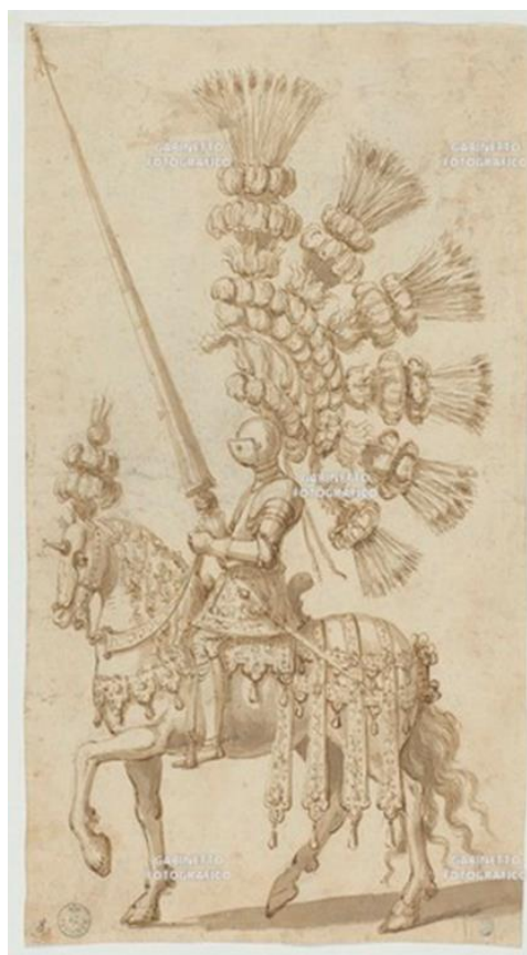
Fig. 8. Giulio Parigi, Diseño de Carosello , Gabinetto Disegni e Stampe – Santarelli, Galleria de los Uffizi, Florencia.

Formado en la tradición de Callot y Remigio Cantagallina, parece innegable su influencia sobre los artistas franceses – también vinculados con el mundo de la estampa- a su vez implicados en el mundo de la fiesta regia, como Israel Silvestre y el magnífico Jean Lepautre. A este respecto, el repertorio del artista florentino es especialmente fértil en lo que a diseños de vestimenta para espectáculos se refiere,