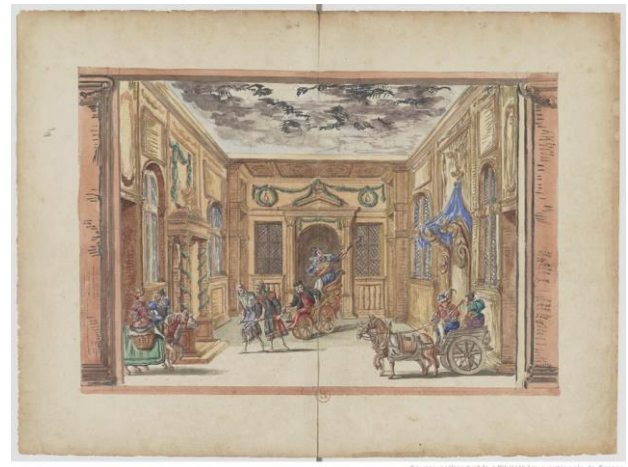
Fig. 20. Henri Gissey, Ballet du Roy aux festes de Bacchus , dansé par Sa Majesté au Palais, ideado por Israel de Benserade, Gallica, BNF.

El mundo islámico en su conjunto se convirtió en modelo antónimo del héroe, protagonista malvado de los argumentos, en los que siempre salía victorioso el primero como emblema del bien frente al maligno, que encarnaba además a la religión que cometió el oprobio de ocupar los santos lugares para el cristianismo, resucitando la lucha de principios morales del mundo antiguo, del orden frente al caos, del enfrentamiento entre oriente y occidente, que se remontaba a los relatos de la literatura homérica, anclada en la