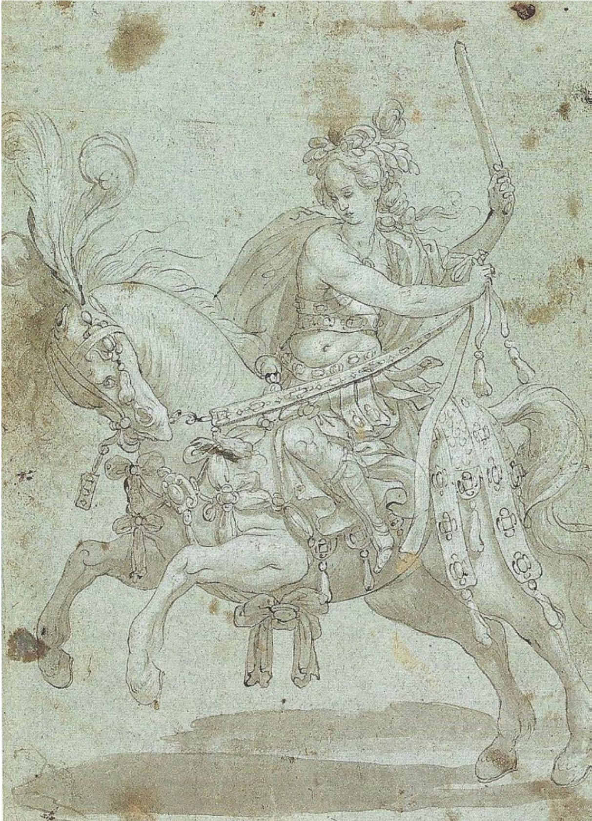
Fig. 4. Giorgio Vasari (1511-1574), Disfraz 6 para La Bufola 7 o máscara de 1566. Gabinetto Disegni e Stampe degli Uffizi. Firenze. Uno de los diez personajes del espectáculo celebrado en la plaza de Santa Croce, en Florencia, para celebrar el matrimonio de Francisco de Medici y Juana de Austria o lo que es lo mismo “ per le nozze del príncipe ereditario e Giovanna d’Austria ”, padres de María de Medici, futura reina de Francia. Se trataba de una cacería ficticia, en la que los participantes iban disfrazados de dioses mitológicos, históricos o alegóricos, relacionados con la caza y cuyo desarrollo del juego se trasladó al resto de las calles de la ciudad.