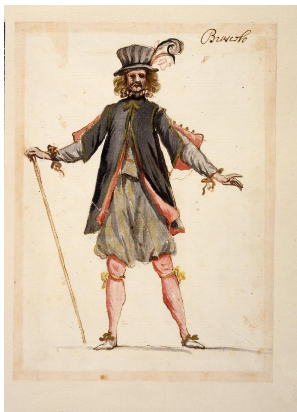
Fig. 24. Baccio del Bianco 24 , Disegno de Vestuario Teatral , cuenta con la inscripción “Bruscolo”. British Museum, Londres.