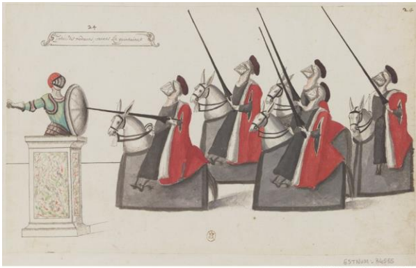
Fig. 18. Atelier de Daniel Rabel, Entrée des medecins courans La quintaine : dessin, 1625, Gallica, BNF.