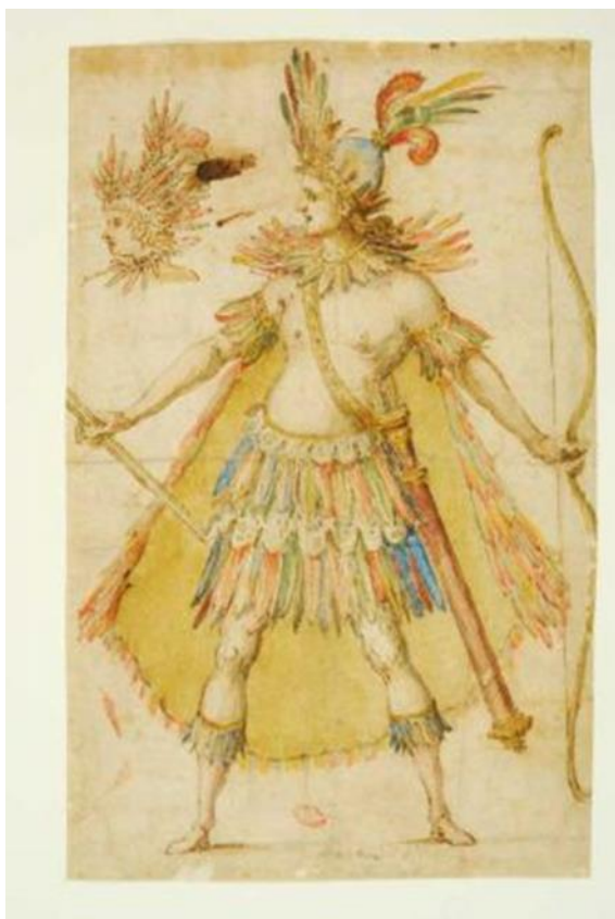
Fig. 7. Giulio Parigi. Disfraz de africano con lanza y arco (Blumenthal, 1980 :101–102, n.471), titulado "soldado indiano de la guardia de la reina Lucinda", si bien es cierto que parece haber una confusión al representar a un miembro de la corte imaginaria de la reina de la India más bien con atributos de los nativos americanos. Diseño para el Torneo titulado

Guerra de Amor . Acuarela firmada. Colección Marucelli. Biblioteca Marucelliana.