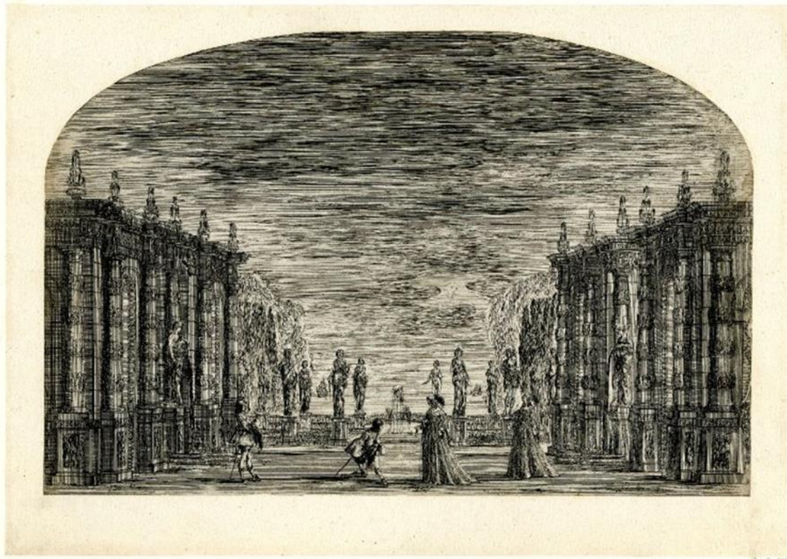
Fig. 9. Giacomo Torelli, Mirame , Escena del Acto Segundo, 1641, con diseño de indumentaria de Stefano della Bella, British Museum.

Medici, caracterizados por su virtuosismo, esplendor textil, colorido y riqueza de materiales, pero también son muchos los diseños conservados para los numerosos grupos de bailarines, de las ineludibles e impactantes coreografías, acompañados de infinitas indicaciones para sastres y modistas, encargados de su ejecución, con el mismo interés y atención a los detalles, en unos y otros, teniendo en consideración que la danza era un aspecto sustancial de estos eventos “poliédricos” cuya función era la de la lúdica áulica, esto es la representación propagandística en perfecta sintonía con la celebración y la educación cortesana –ya mencionada entre las directrices prioritarias del Cortesano de Castiglione, tanto como en la epicéntrica disciplina, a través de la que se articuló la ideología del poder con los bailes mascaradas de Agliè en