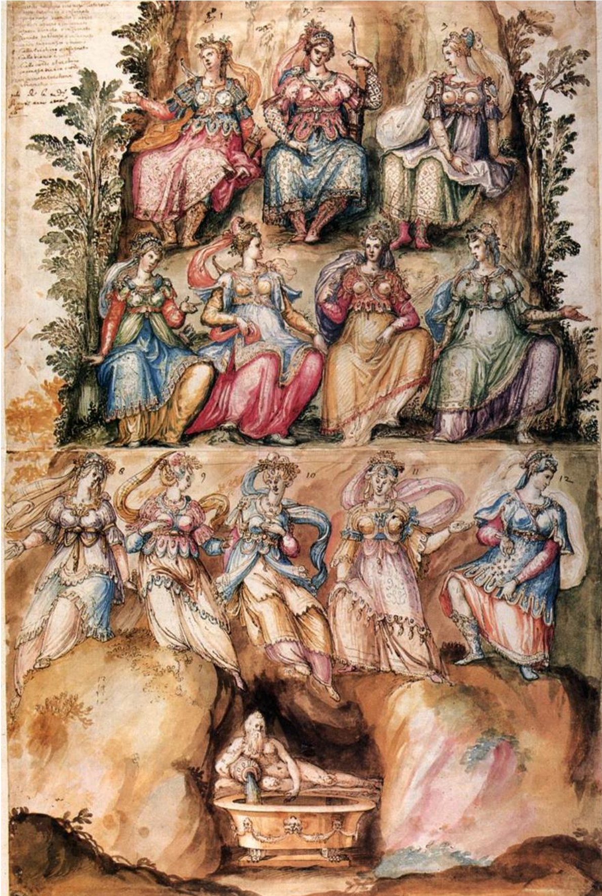
Fig. 1. Bernardo Buontalenti. Diseño de vestuario para La Pellegrina , 1589. Biblioteca Nazionale Centrale, Florencia.