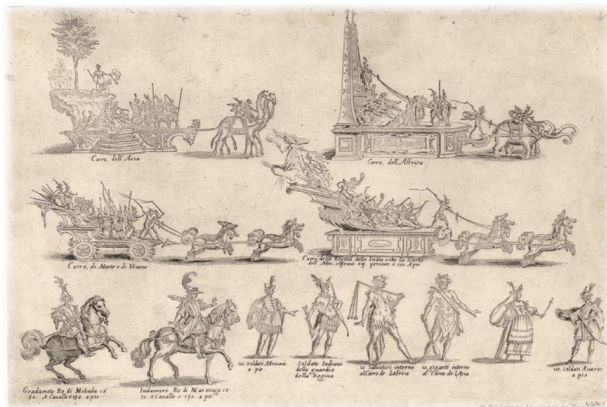
Fig. 6. Guerra de Amor. Febrero 1616. Torneo temático: Cosme II disputaba el torneo como rey de Narsinga por el favor de la reina Lucinda de la India, encarnada por (la Duquesa) María Magdalena. Texto de Salvadori, diseño escenográfico de Giulio Parigi y estampa de Jacques Callot.