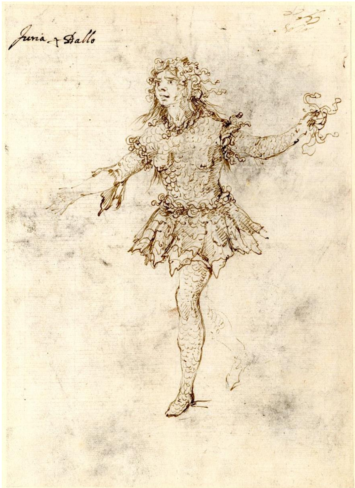
Fig. 16. Stefano della Bella. Diseño de vestuario para representar una Furia mitológica , British Museum. Figura en el inventario como “Costume study for a Fury, formerly in an album; a mad woman wearing a scaly costume turned to left, her arms outstretched and with snakes in her left hand and hair”.