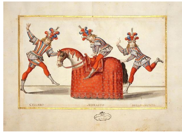
Fig. 17. Tommaso Borgonio, Balletto dei Giuochi Puerili ne L'educazione di Achille e delle Nereidi sue sorelle nell'isola d'Oro , 1650. Biblioteca Nazionale, Turín.

Las fuentes de conocimiento de la obra de Agliè 15 son varias. Una de ellas los trece códices manuscritos de Giovanni Tommaso Borgonio (Biblioteca Nazionale y Biblioteca Reale de Turín), que ilustran numerosas representaciones de bailes celebrados entre 1640 y 1681, incluidas las decoraciones escenográficas.