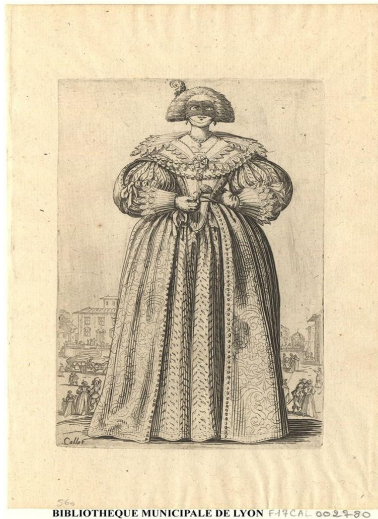
Fig. 2. Jacques Callot, La dame au masque , Bibliothèque municipale Lyon, Gallica. BNF.

En las cada vez más extensas descripciones de los trajes de, en este caso la tipología del ballet ecuestre o carosello , se repiten materiales más que alusiones a diseños propiamente, que resaltan la riqueza de los componentes propios de una élite capaz de permitirse esos costes, como terciopelo, seda, joyería como aderezo así como una ingente variedad de plumaje de aves, como las garzas, para decorar los yelmos de unas armaduras, remanente del traje militar medieval por excelencia, reconvertido en vestuario eminentemente cortesano.