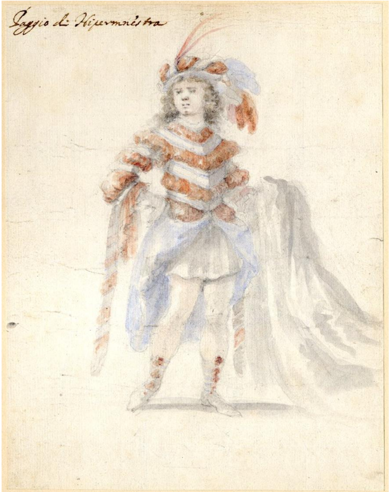
Fig. 12. Stefano della Bella, Diseño de traje para La Hipermestra de Cavalli, con diseño escenográfico de Ferdinando Tacca. British Museum.