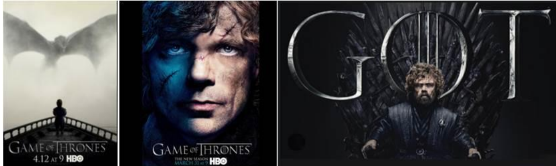
Images 1, 2 and 3: Tyrion Lannister (promotional posters for the series).