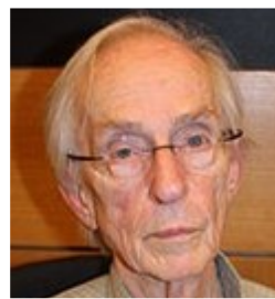
Howard S. Becker April 18, 1928 - August 16, 2023 (age 95) San Fco, California