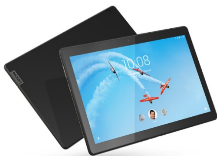
Tablet Lenovo M10 HD

Las fotografías premiadas serán expuestas en la exposición “17 ODS x 1 Mundo Mejor” que se celebrará en la Biblioteca de la Facultad de Ciencias Químicas y, también en la página web del proyecto en el marco en el que se convoca este concurso.