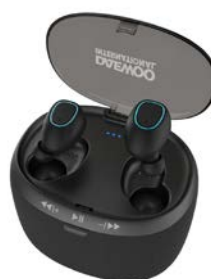
Auriculares inalámbricos + altavoz DA-21 de Daewoo