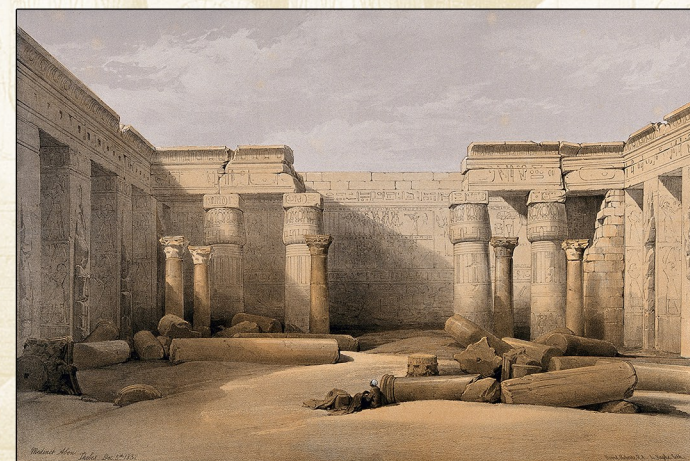
Ruinas de Medinet Habu (Tebas, Egipto) Litografía, Louis Haghe y David Roberts, 1847

DOCTORADO EN ESTUDIOS DEL MUNDO ANTIGUO (con mención de excelencia)