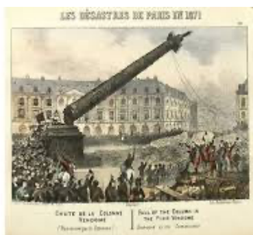
Derribo de la Columna Vendôme. Estampa de época.

* La Semaine sanglante . Thiers y el “auténtico Terror”