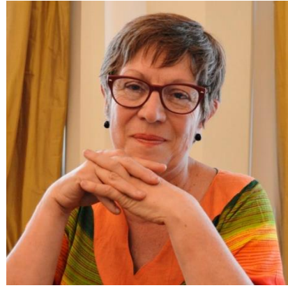
María Teresa Andruetto