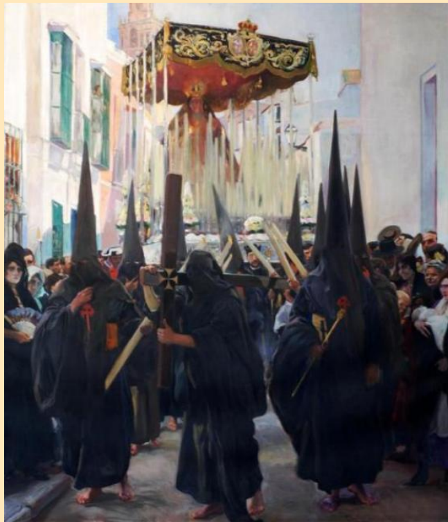
Joaquín Sorolla, «Sevilla. Los nazarenos» (1914), Hispanic Society of America (Nueva York)

En definitiva, el congreso se plantea como una oportunidad para estudiar un motivo literario que no ha sido lo suficientemente atendido por la investigación académica y que puede contribuir a proponer nuevas vías de investigación. Se trata, en definitiva, de analizar de qué forma se ha incorporado o interpretado literariamente este fenómeno de la Semana Santa en relación con una época histórica determinada y con sus coordenadas religiosas, sociales y culturales.