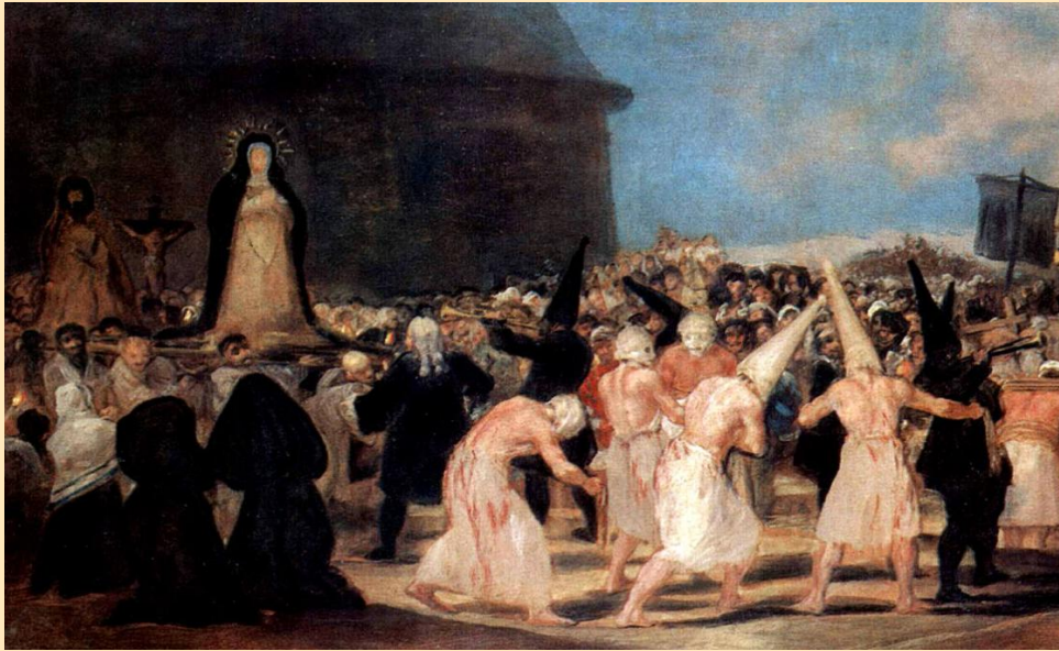
Francisco de Goya, «Procesión de disciplinantes» (1814-1816), Real Academia de Bellas Artes de San Fernando (Madrid)