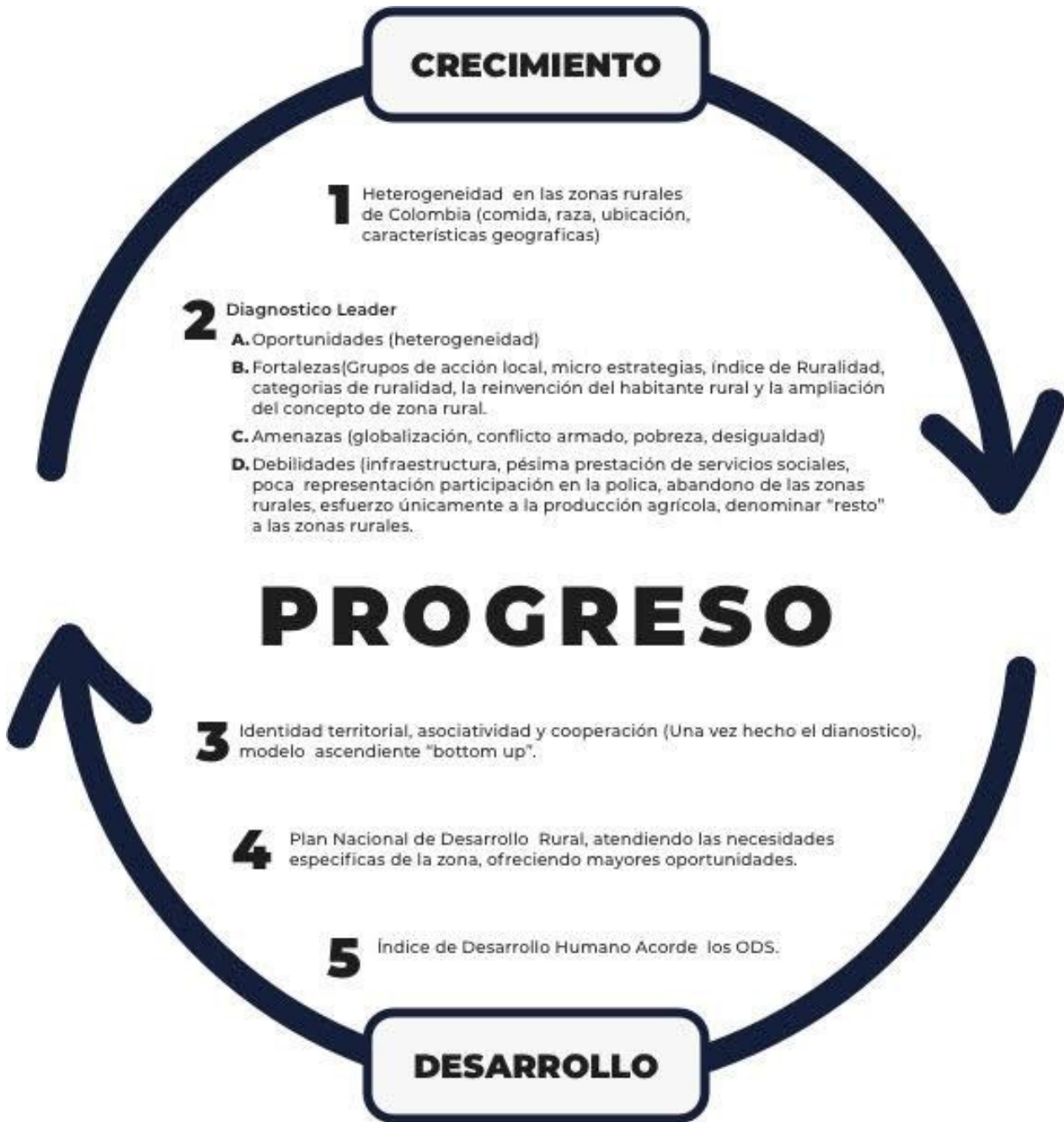
Figura 3. Crecimiento, progreso y desarrollo en el estudio del territorio rural.