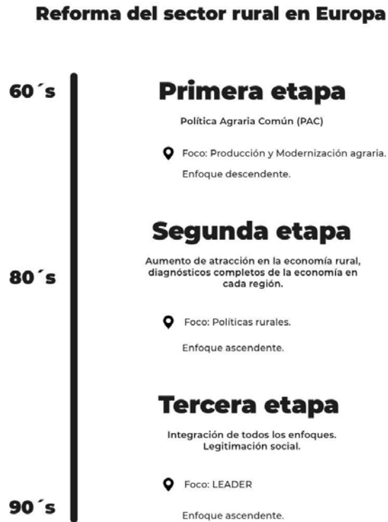
Figura 1. Etapas de la reforma del sector rural en Europa.

colombiano, un exuberante círculo de pobreza, que obligó a que se trasladaran a las urbes (Gaviria et al., 2018).