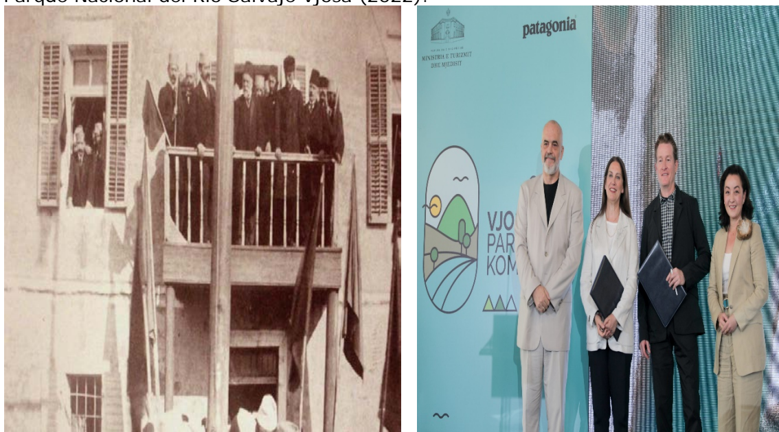
Figura 3. Primer aniversario de la independencia en Vlorë (1913) y declaración del Parque Nacional del Río Salvaje Vjosa (2022).