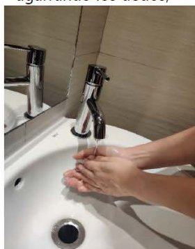
Enjuágate las manos.