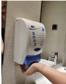
Deposita suficiente jabón en las palmas.