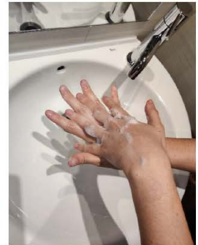
la palma de una mano contra el dorso de la otra, entrelazando los dedos y viceversa,