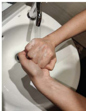
el dorso de los dedos con la palma opuesta, agarrando los dedos,