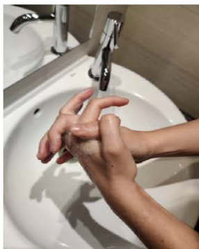
las palmas entre sí, con los dedos entrelazados,