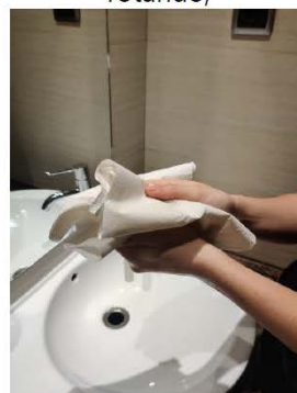
Sécate con una toalla desechable,