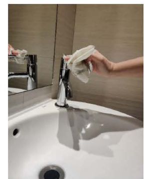
utilízala para cerrar el grifo y tírala a la basura.