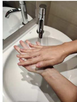
Frota las palmas entre sí,