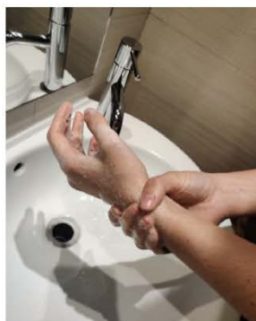
y continua lavando las muñecas.